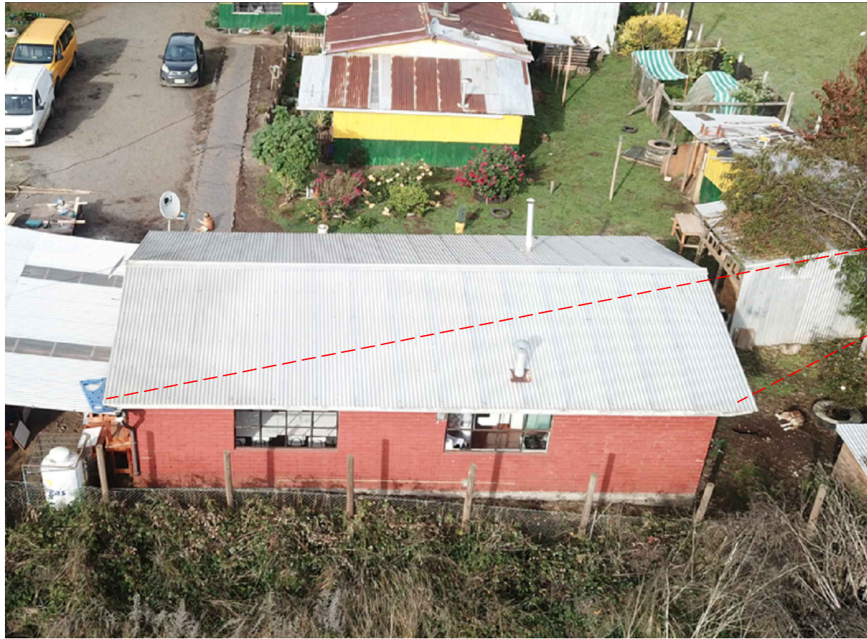
IMAGEN TECHUMBRE DE COCINA SECTOR PROPUESTO PARA INSTALACIÓN DE PANELES FOTOVOLTAICOS