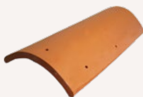
Pieza para Cumbra y Aleros