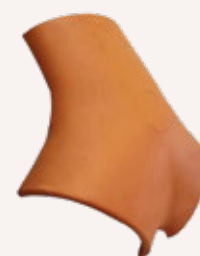
Pieza para encuentro a tres aguas