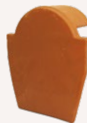
Pieza para tapón de Cumbra