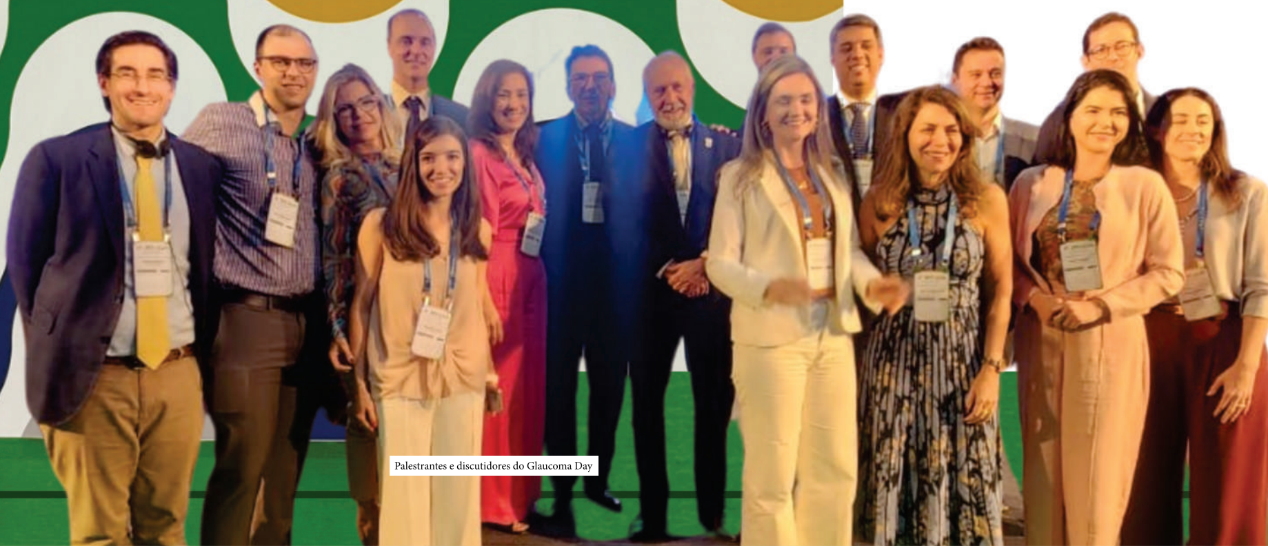
Palestrantes e discutidores do Glaucoma Day

Premium IOLs in Glaucoma: What should we consider?