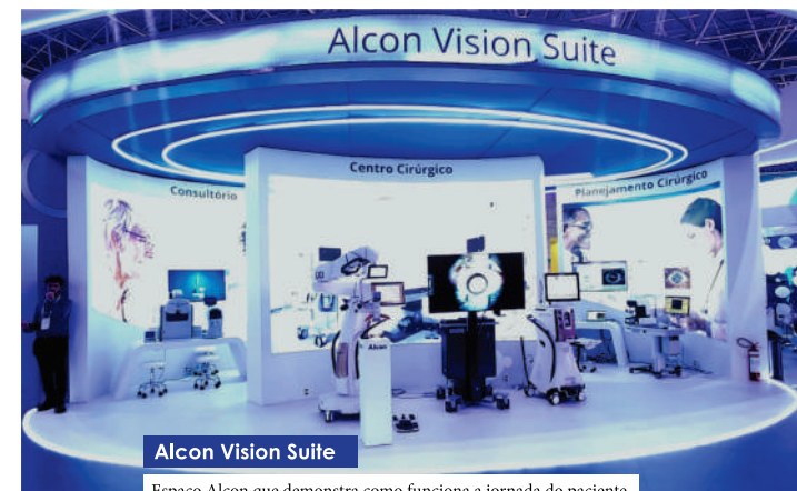
Alcon Vision Suite

Espaço Alcon que demonstra como funciona a jornada do paciente