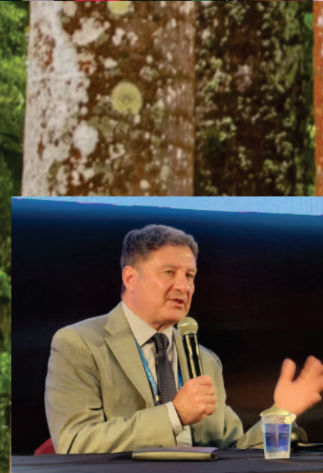
Francesco Carones Provocador - Presbiopia: Córnea ou Cristalino - O laser contra-ataca