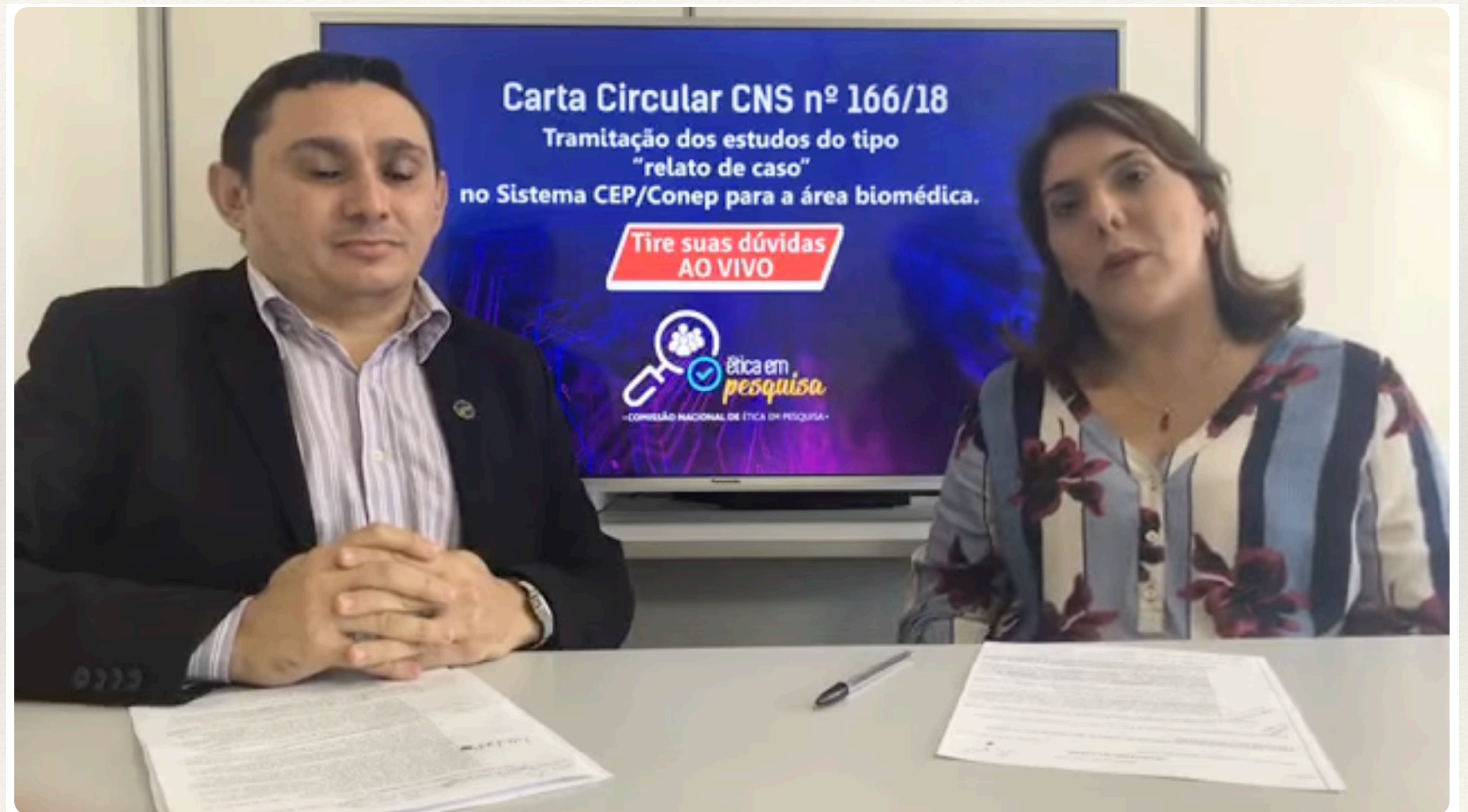
Carta Circular CNS nº 166/2018