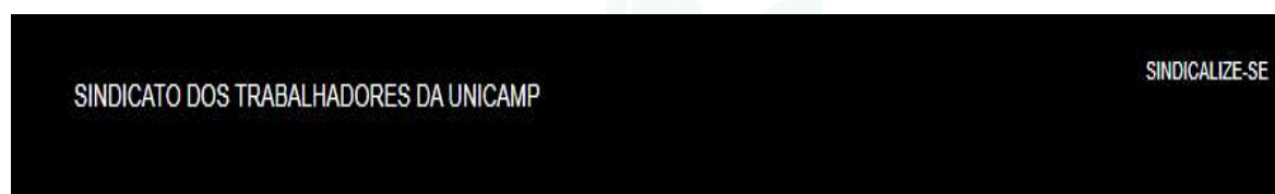
Figura 1 - Programação do Ciclo de Debates: Sindicato dos Trabalhadores da UNICAMP.

Bastante usual em outras entidades, muitos sindicatos de diversas categorias profissionais adotam a prática de realizar debates entre candidatos, como forma de promover a democracia e a transparência em suas eleições. Exemplos: