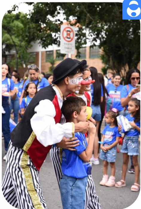
Caminhada Pela Vida