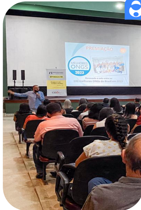
Caravana do Diagnóstico Precoce