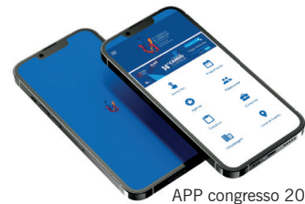
APP congresso 2025

A SBC/BA já entrou na era da tecnologia e do movimento sustentável, com a retirada da impressão do programa científico, criando o seu APP para comunicação direta com seus sócios e participantes de todas as atividades promovidas por nossa sociedade.