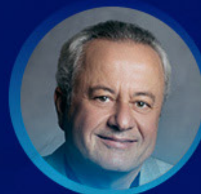
MARCO A. ARRUDA Entrevistador