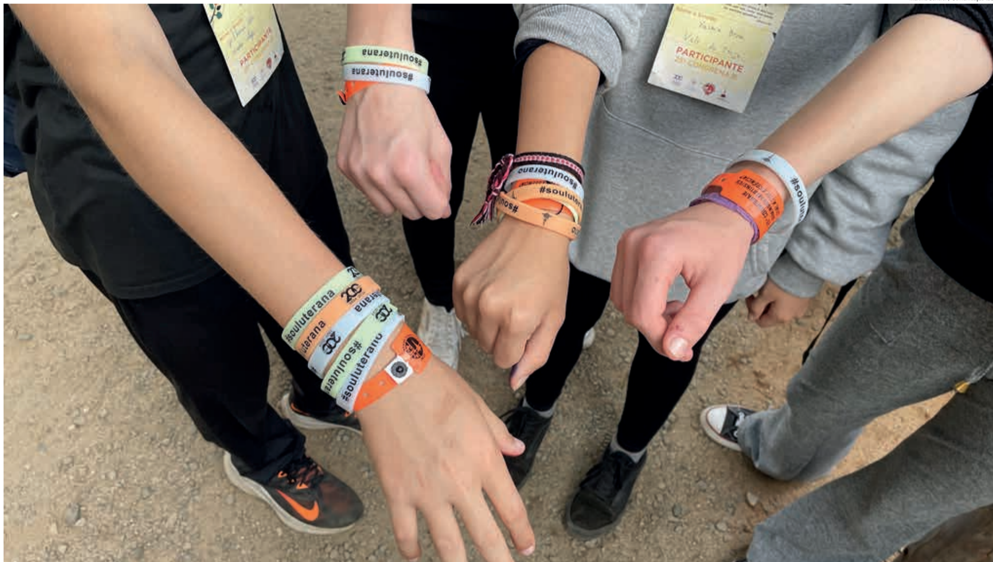
Durante o 25º CONGRENAGE, em Domingos Martins/ES, jovens de toda a IECLB fizeram esta pergunta. Veja a que conclusões chegaram e como pensam.