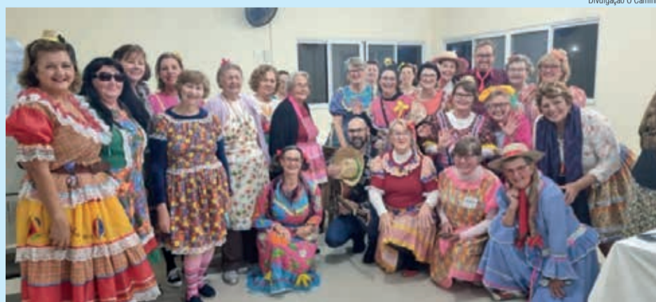
Momento de celebração da Amizade, durante festa junina no Retiro

As participantes do Retiro refletiram sobre “Laços de Amizade sob a perspectiva da Liberdade Cristã”. Foram levadas a pensar a diferença entre laços e nós. Nas relações de amizades, temos as duas situações em nossas vidas. Há amizades tão especiais, que acabam sendo firmadas com um nó bem apertado, que solidificam. Contudo, a partir da perspectiva da liberdade cristã, as amizades deveriam ser construídas a partir de laços, que não prendem e escravizam, mas que são fáceis de abrir, o que proporciona a oportunidade de agregar mais pessoas.