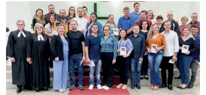
Bodas Casamento Paz