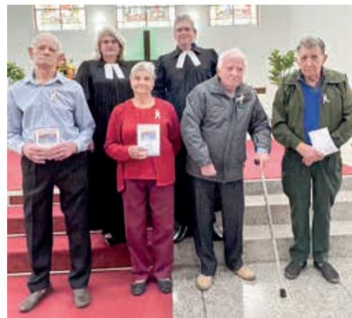
Jubileu 40,50,60 70 anos de confirmação de Fé Comunidade Cristo Salvador