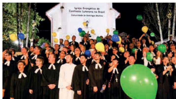
A largada das comemorações foi durante o 25º CONGRENAGE, em Domingos Martins/ES, e vão até 2024