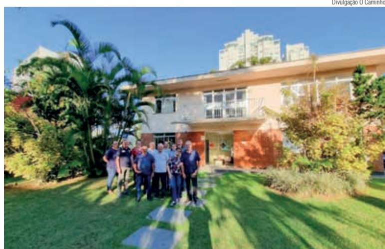
Um grupo de 11 lideranças visitou a sede sinodal em Joinville

Após esse momento, aconteceu uma visita ao Museu dos Bombeiros Voluntários de Joinville, que fica ao lado da Sede Sinodal. Essa corporação de Bombeiros Voluntários é a mais antiga do Brasil. Sua fundação aconteceu em 1892 a partir de iniciativas de imigrantes. Atualmente, é formada por 1.700 pessoas entre bombeiros mirins, voluntários, efetivos, brigadistas e pessoal de apoio.