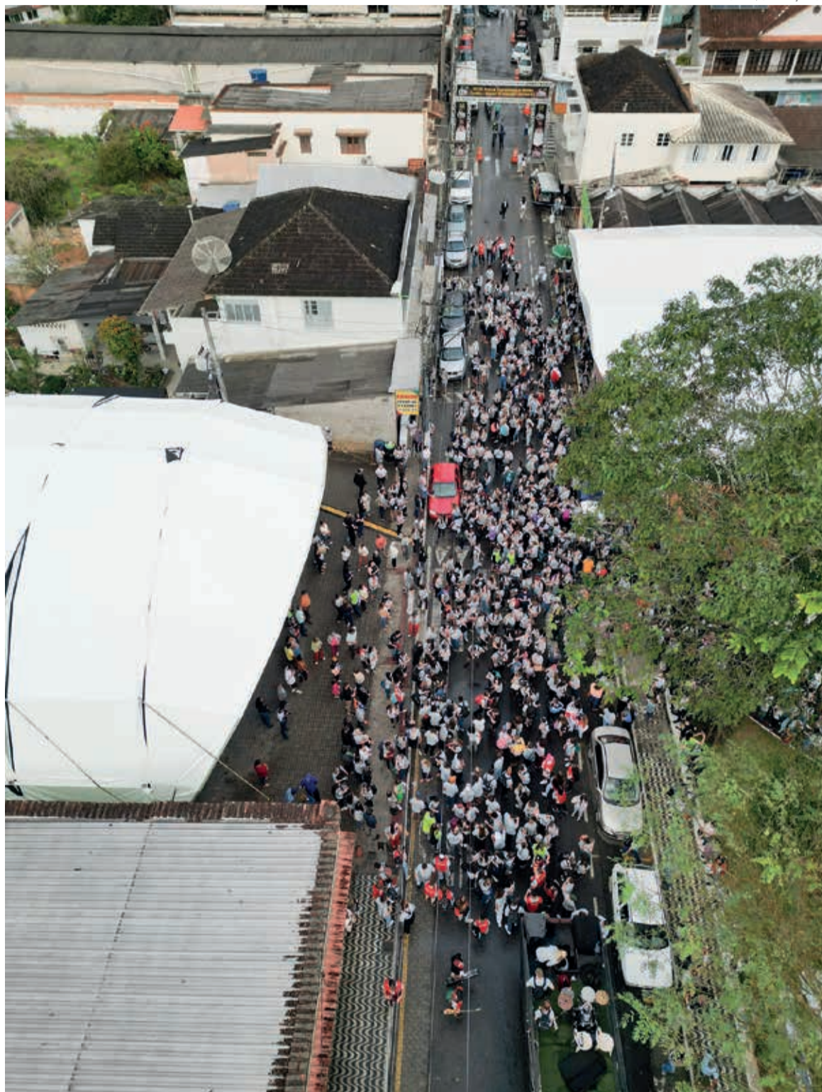
Jovens luteranos de toda a IECLB tomaram as ruas de Domingos Martins/ES durante o 25º CONGRENAGE

A juventude é sustentabilidade, justiça ambiental,