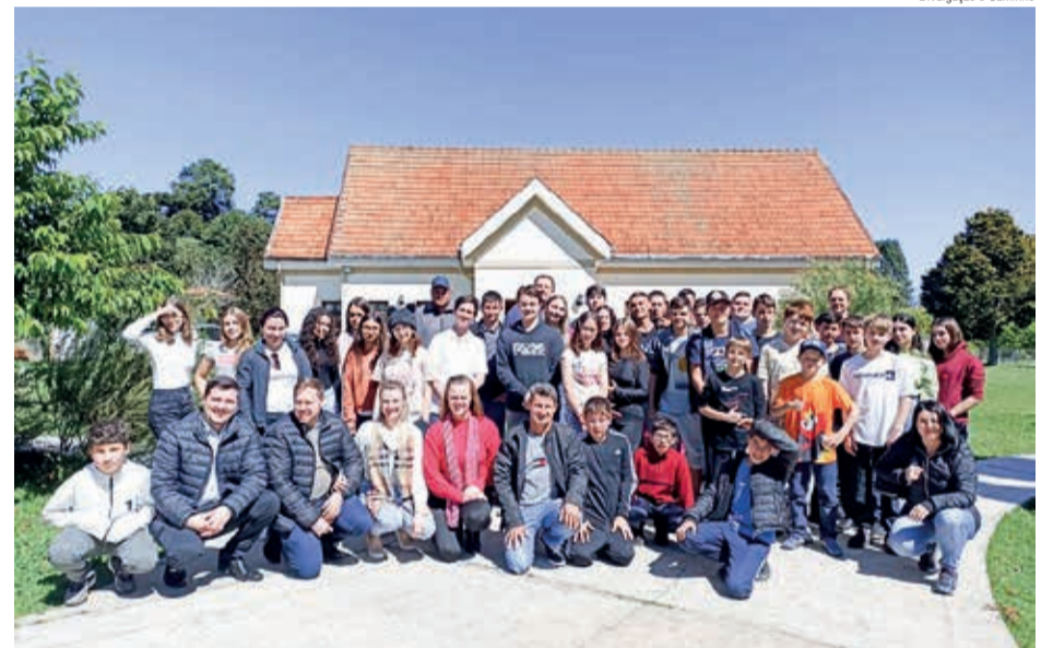
Os grupos de jovens de três paróquias meditaram sobre o tema Mãos à Obra

Momentos de louvor, esporte, gincana, e estudo da Palavra de Deus marcaram este tempo de comunhão. Na noite de sábado, os jovens literalmente colocaram a mão na massa e prepararam o jantar, com um delicioso Stockbrot (pão no espeto).