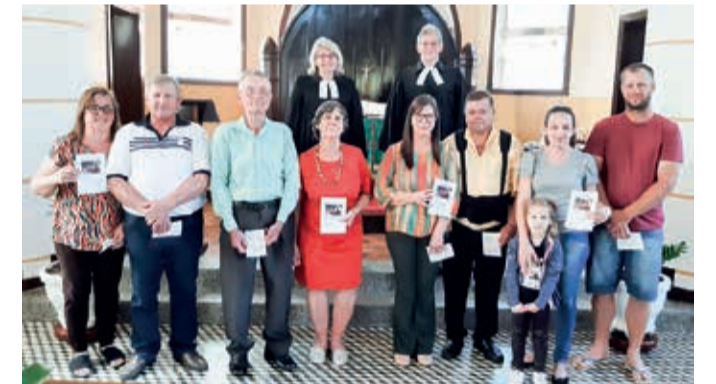
Bodas Casamento Paz