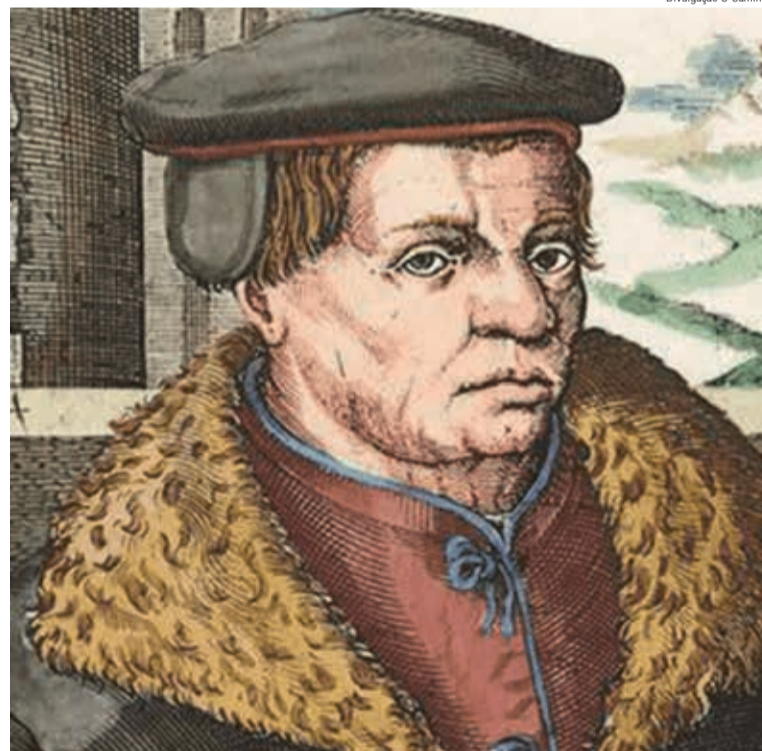
Thomas Müntzer se opôs a Lutero na Guerra dos Camponeses

Lutero o condenou em escritos e em público, postando-se contra os rebeldes camponeses. Pode ter sido o lado errado, mas se tivesse apoiado os rebeldes, talvez a Reforma não teria se mantido por muito tempo.