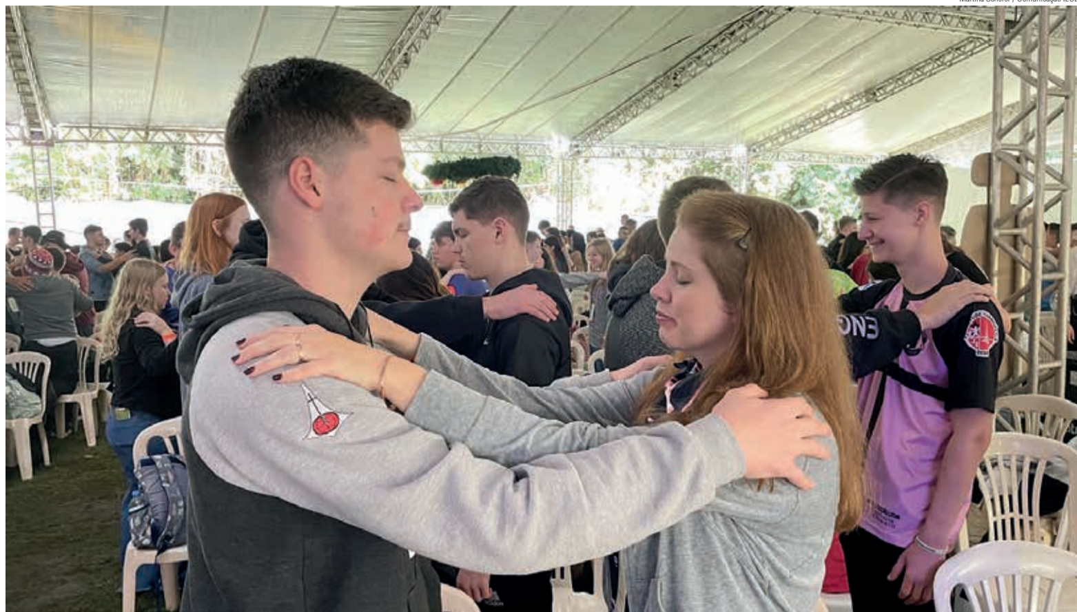
Momento de interação entre as pessoas participantes do CONGRENAGE

"O Congrenaje foi uma experiência marcante, 5 dias que passaram voando da melhor maneira possível! Esperei por esse evento por cinco anos e posso falar que valeu a pena cada segundo. As amizades reencontradas e criadas são únicas e de uma conexão incomparável. Foi uma programação de muito aprendizado com palestrantes e profissionais incríveis. Penso