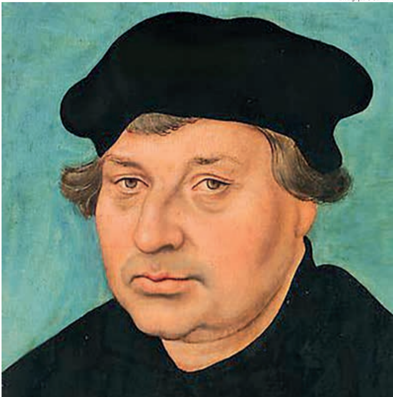
Johannes Bugenhagen foi o pastor de Lutero na igreja de Wittenberg

Johannes Bugenhagen (24 de junho de 1485 - 20 de abril de 1558), também chamado de Doutor Pomeranus por Martin Lutero, foi um teólogo alemão e sacerdote luterano que introduziu a Reforma Protestante no Ducado da Pomerânia e na Dinamarca no século XVI. Entre suas principais realizações estava a organização de igrejas luteranas no norte da Alemanha e na Escandinávia. Ele também foi chamado de "Segundo Apóstolo do Norte".