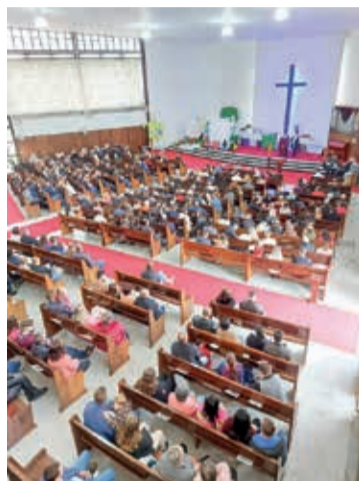
As crianças trabalhando o tema da transformação diante da igreja lotada.