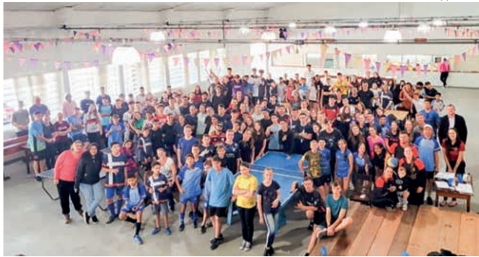
Os jovens atletas dos jogos paroquiais em Rio Bonito

A Paróquia de Rio Bonito-Joinville/SC realizou no fim de semana de 15 e 16 de julho a terceira edição dos jogos paroquiais. A Comunidade São Lucas de Rio Bonito acolheu os jogos. Um verdadeiro mutirão aconteceu na Comunidade para deixar tudo pronto após os fortes ventos que causaram estragos devido ao ciclone que passou pela região na quinta-feira anterior ao evento. Mas tudo deu certo e Deus concedeu dois dias