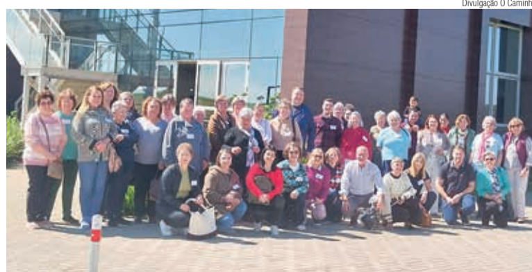
O Seminário Reaprender reuniu lideranças de todo o Sínodo