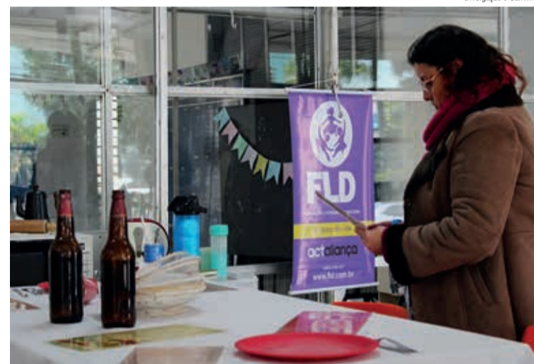
A violência doméstica tratada em encontros pelo Nem Tão Doce Lar