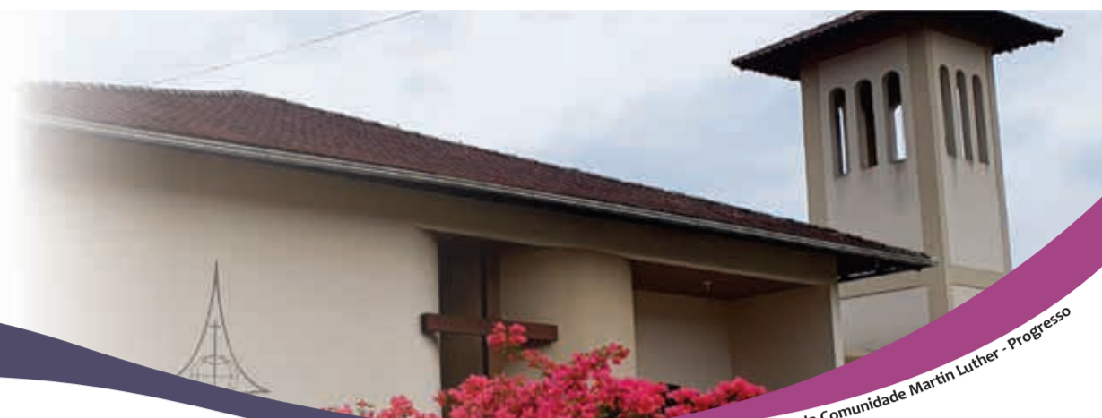
Igreja da Comunidade Martin Luther - Progresso