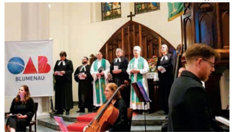
Ministros da IECLB, da IELB e da ICAR celebraram o culto