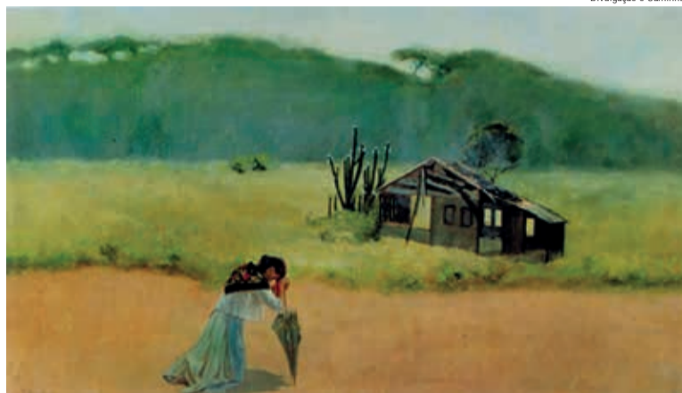
A pinura retrata uma imigrante desolada, o que despertava o desejo de repatriamento.

Muitos, mesmo desejando voltar, não podiam mais fazê-lo. Haviam investido todos os