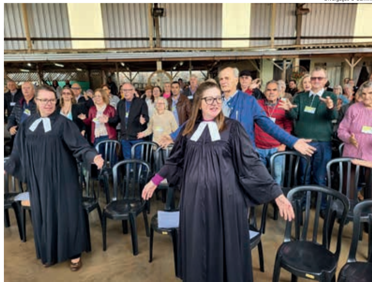
O encontro foi marcado pela celebração e a alegria das pessoas que participaram com entusiasmo, celebrando em torno do tema do ano

Os jovens tiveram um encontro especial, com a palestra