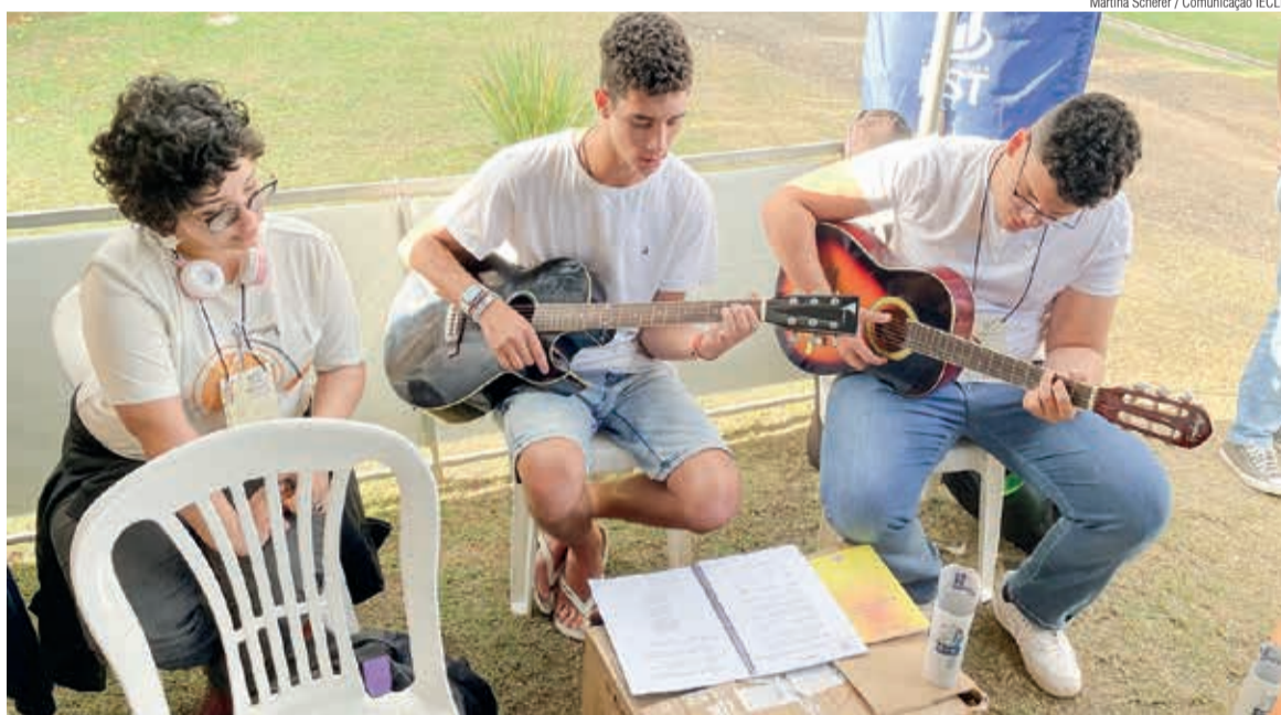
O encontro foi marcado por muitos momentos de comunhão e de despertamentos de vocações