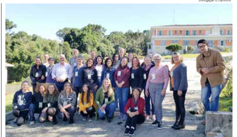
As pessoas participantes do encontro de planejamento da EEC