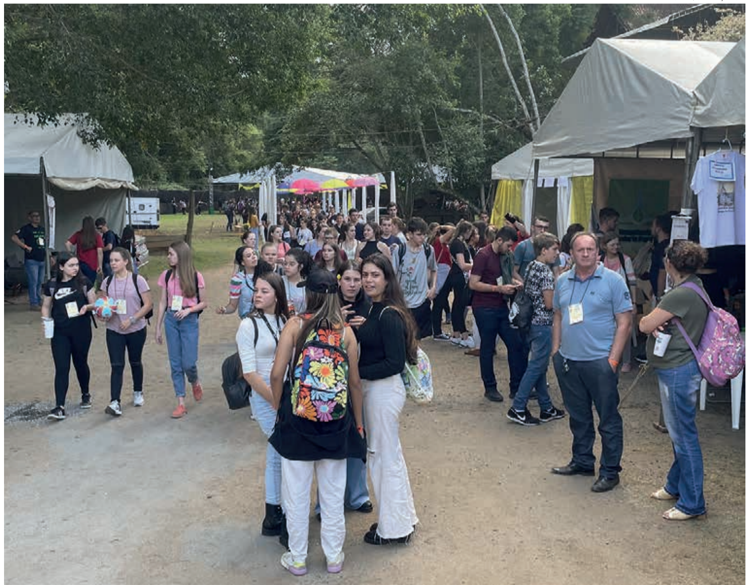
No 25º Congrenaje, em Domingos Martins/ES, as pessoas jovens planejam o futuro de sua caminhada dentro da IECLB

Na assembleia do 25º Congrenaje delegados e delegadas refletiram sobre a caminhada na igreja e destacaram que a juventude é cíclica. “Neste novo ciclo que se inicia, o desejo e convite é para construir, abraçar, ouvir, falar, amar e promover a paz, mantendo o testemunho da juventude vivo, ativo e protagonista em nossa igreja”. Além disso, é importante tornar a comunicação mais efetiva: divulgar e utilizar