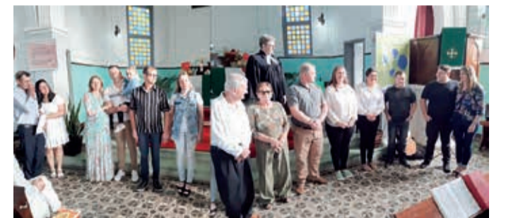
Bodas casamento Comunidade Apóstolo Paulo