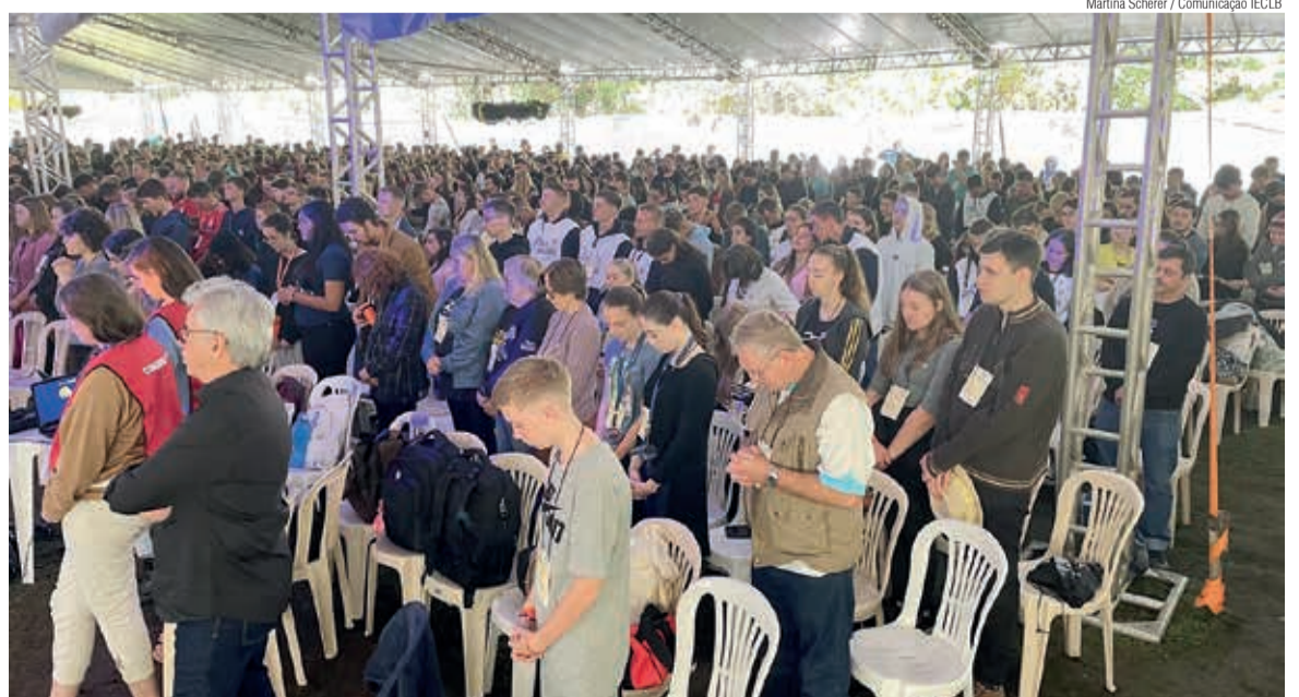
A juventude da IECLB em momento de celebração, em Domingos Martins/ES