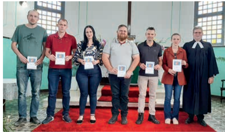
Jubileu 20, 25 e 30 anos de Confirmação Fé Comunidade Apóstolo Paulo