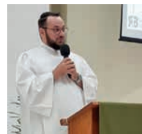
O Candidato ao Ministério Tomas Pagung Lauvers atua em Rio Bonito-Joinville