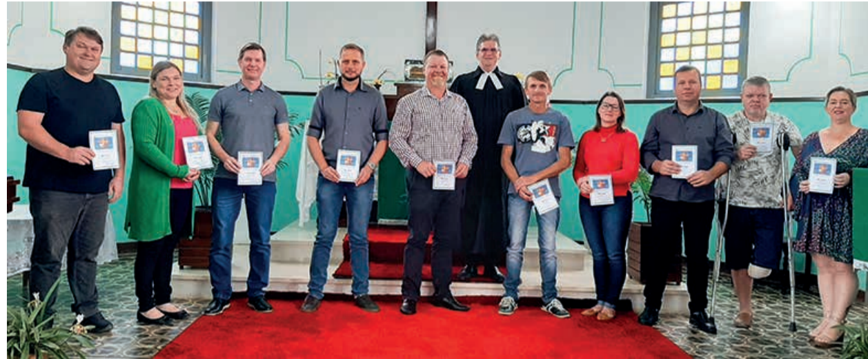
Jubileu 20, 25 e 30 anos de Confirmação Fé Comunidade Apóstolo Paulo