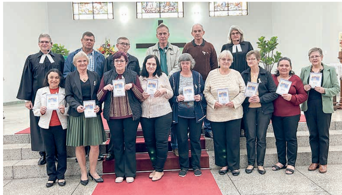
Jubileu 40,50,60 70 anos de confirmação de Fé CCS