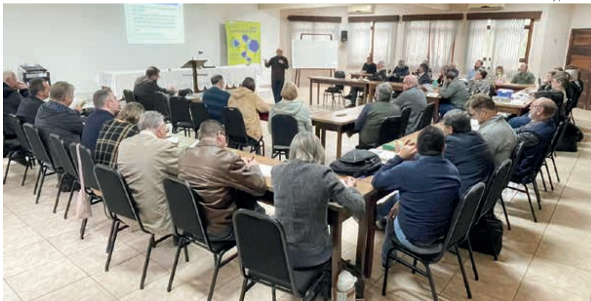
O grupo de ministros e ministras ouviu e interagiu com o palestrante sobre aconselhamento em Logoterapia

A Conferência Ministerial do Sínodo Vale do Itajaí abordou o tema “Aconselhamento Pastoral em Logoterapia - Aspectos