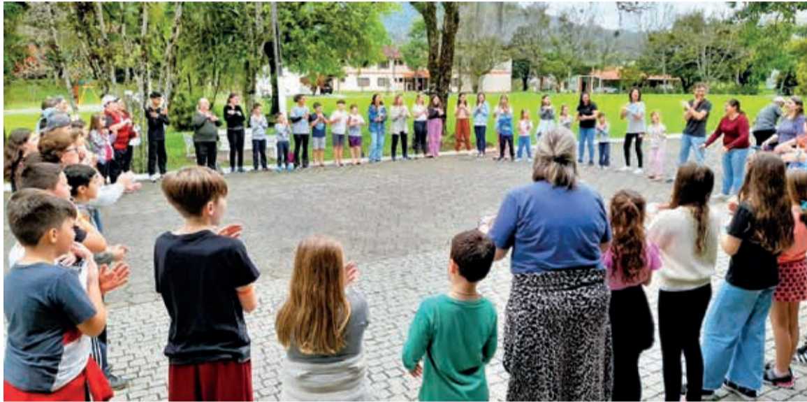
As crianças em um momento de canto com jestos realizado ao ar livre