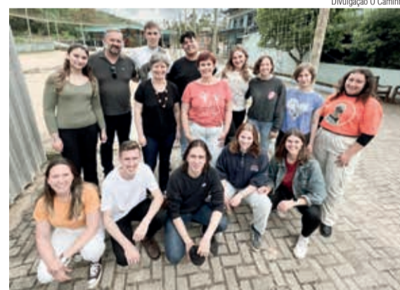
Divulgação O Caminho

O encontro preparou para a viagem e para o tempo de estadia na Alemanha