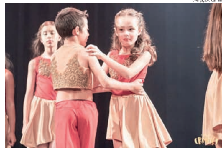
Som do Coração é um projeto diaconal da Comunidade de Itapoá

O Projeto Som do Coração é uma ação missionário-diaconal, voltada para crianças e adolescentes empobrecidos. Tem sido o caminho para trazer novas pessoas e famílias a participarem da Comunidade de Itapoá.