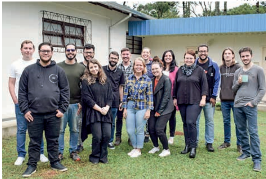
Um grupo de estudantes de teologia da Faculdade Luterana de Teologia-FLT. O Programa Conectar, criado em 2022 pela FLT, permite que mais jovens possam seguir sua vocação e estudar teologia

Em busca alternativas, a Faculdade Luterana de Teologia-FLT criou o Programa Conectar . Trata-se de um Fundo de Apoio à Formação Teológica, que visa conectar pessoas apoiadoras das comunidades que desejam investir em formação de qualidade para estudantes que pretendem atuar