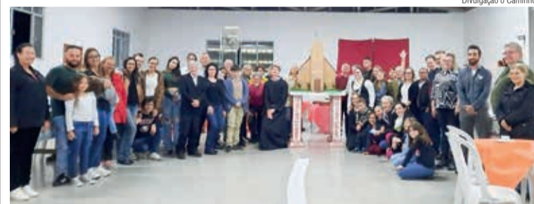
Participantes da noite com os quatro Pilares da Reforma ao centro

A noite se encerrou com um delicioso café, onde membros da paróquia trouxeram um prato de alimento e todas as pessoas compartilharam.