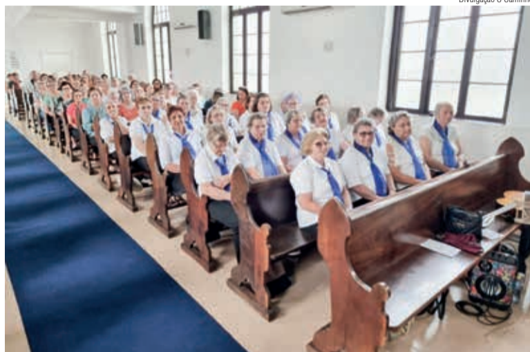
O grupo centenário celebrou com a comunidade e grupos da região

No dia 15 de janeiro de 1922, iniciou a história do Frauenverein Humboldt em Hansa Humboldt, localidade hoje designada por Corupá/SC. Reuniram-se 20 pessoas com o objetivo de fundar o grupo, visando organizar e promover possibilidades para a construção da Schwestern Station , a Casa de Abrigo para as Irmãs, enfermeiras que atuavam na região, buscando socorrer e amparar mulheres doentes e parturientes que enfrentavam complicações no parto e risco de vida.