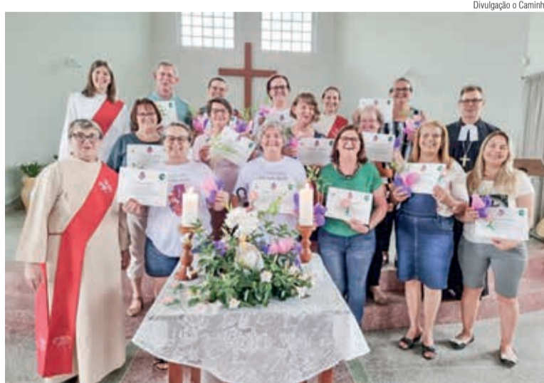
O grupo celebrou a formatura na Comunidade São Lucas

Para selar o momento, foi celebrado um culto, no dia 29 de outubro, com a afirmação do compromisso diaconal do grupo: Eu me comprometo através do evangelho me colocar aos pés de Jesus e ser cuidado e