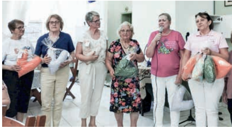
As almofadas ajudam na recuperação pós-cirúrgica da mastectomia

Celebrações aconteceram para agradecer este mutirão. No Culto da Reforma, em 31 de outubro, a União Paroquial de Blumenau tornou a ação pública. A Rede Feminina de Combate ao Câncer de Blumenau participou de um culto especial na Comunidade