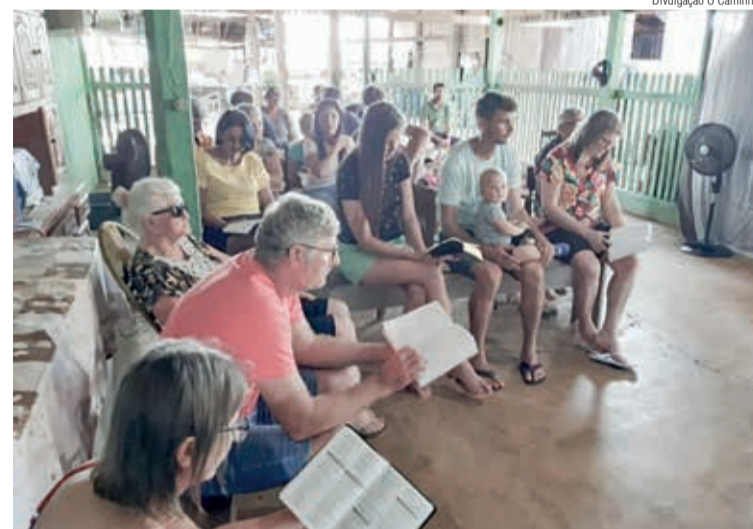
Apoiar comunidades na região amazônica está entre as prioridades

Mais informações sobre a Vai e Vem 2022 no QR-Code ao lado