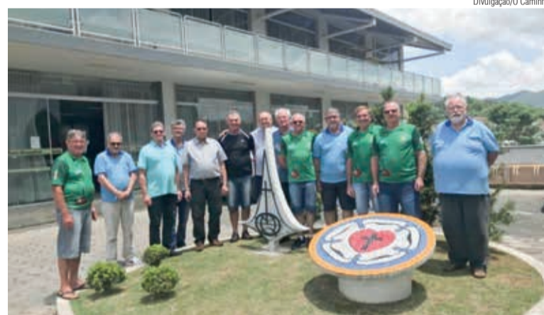
Uma comissão está organizando a Convenção Nacional de 2023

A Legião Evangélica Luterana-LELUT realiza sua Convenção Nacional a cada dois anos. Em 2023, de 23 a 24 de setembro, o encontro será hospedado em Jaraguá do Sul/SC, pelo Núcleo da LELUT da Comunidade Cristo Salvador, Paróquia Barra do Rio Cerro. A Coordenação da LELUT do Sínodo Norte Catarinense abraça junto esse momento. Uma comissão organizadora sinodal foi formada. No dia 19 de novembro uma