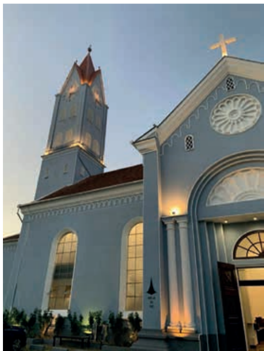
Igreja da Paz, em Joinville, foi restaurada

Desde então, a Igreja da Paz faz parte da vida dos joinvilenses, sendo parte de um conjunto arquitetônico que inclui o tradicional Colégio Bom Jesus (antiga Deutsche Schule), tanto que foi tombada como patrimônio histórico/cultural em 1998. É o único templo luterano de Joinville a receber a honraria.