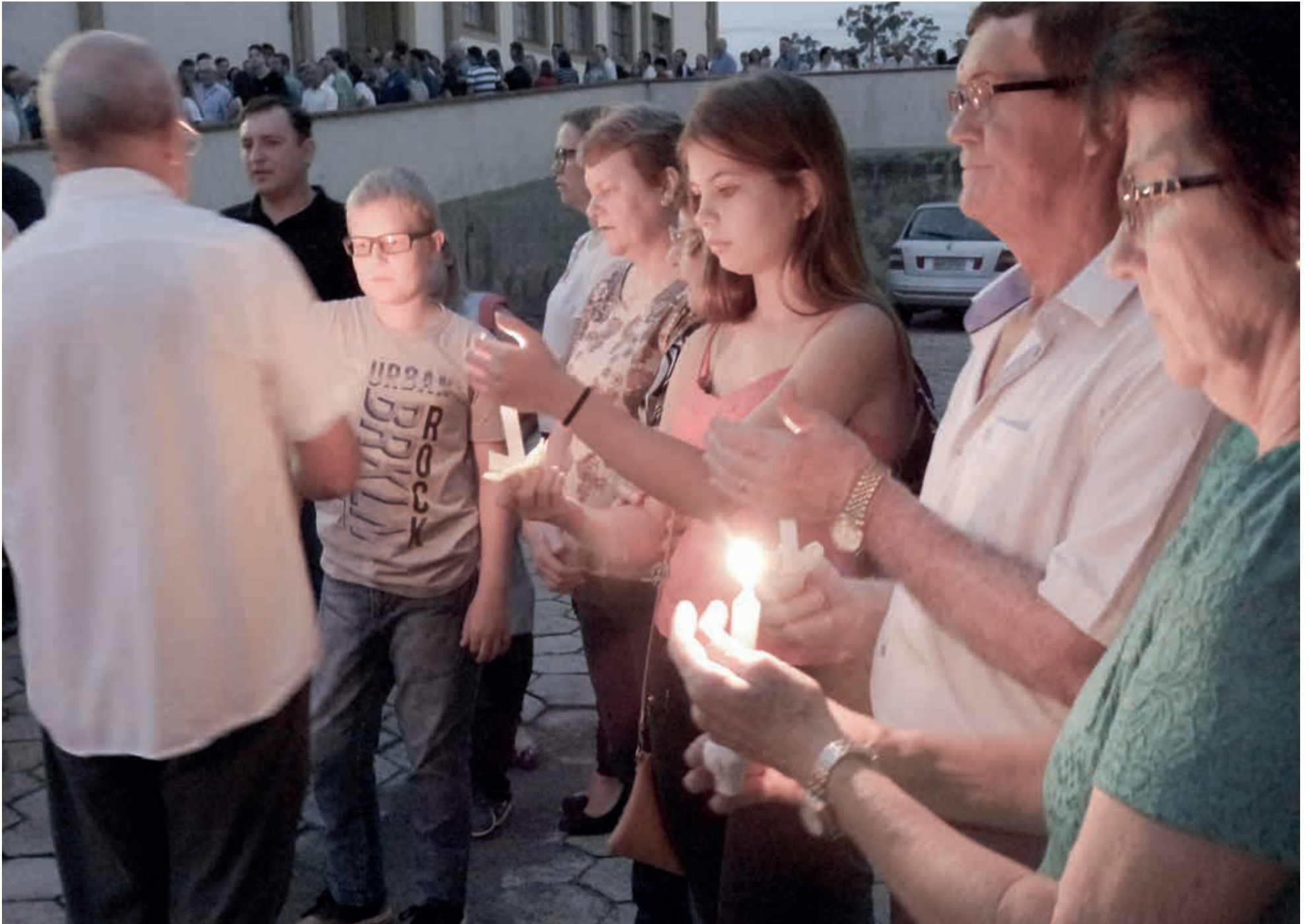
A Comunidade Cristã, no alvorecer da manhã de Páscoa, prepara-se para celebrar o Cristo que vive, acendendo as luzes da esperança

Culto Pascal em Jaraguá do Sul