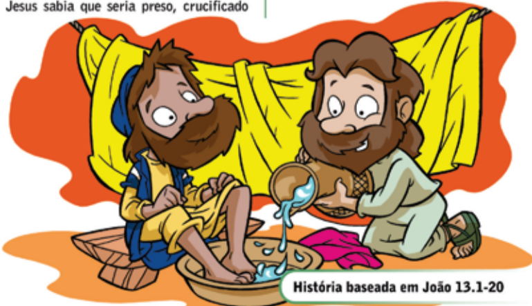
História baseada em João 13.1-20

– Se eu, o Senhor e Mestre, lavei os pés de vocês, então vocês devem fazer o mesmo uns com os outros e com as outras pessoas. Eu dei o exemplo para que vocês façam o que eu fiz.