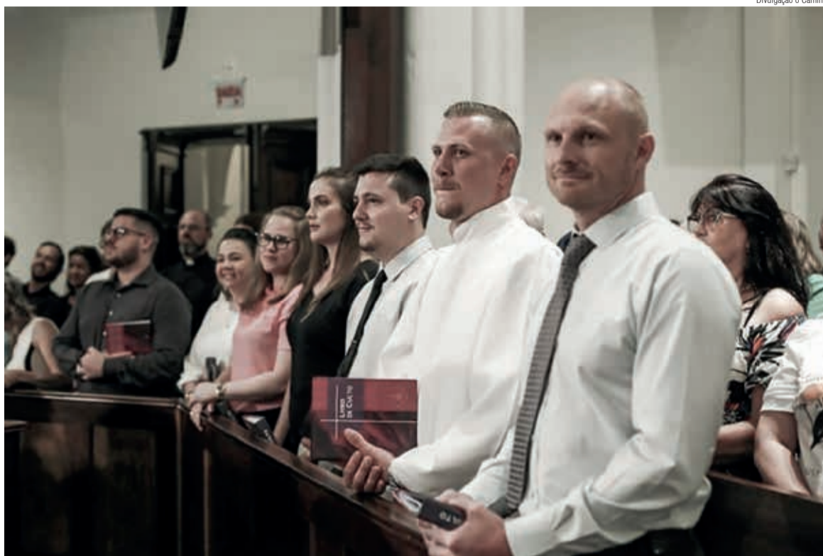
Os ordinandos e as Ordinandas em Blumenau, no primeiro dos três atos de Ordenação oficiados em 2023

O primeiro Ato de Ordenação aconteceu em 27 de janeiro, para oito novas Ministras e Ministros da IECLB