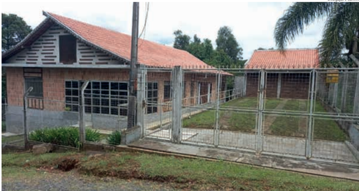
Esta casa e o terreno, em São Bento do Sul, foram doados para as obras do Instituto em Campo Alegre