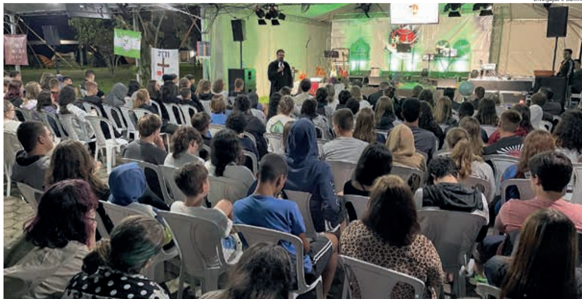
Diversos assuntos foram tratados com os jovens no LUTx, modalidade com painéis de 20 minutos

“Empatia e compaixão em tempos de Covid”, com a