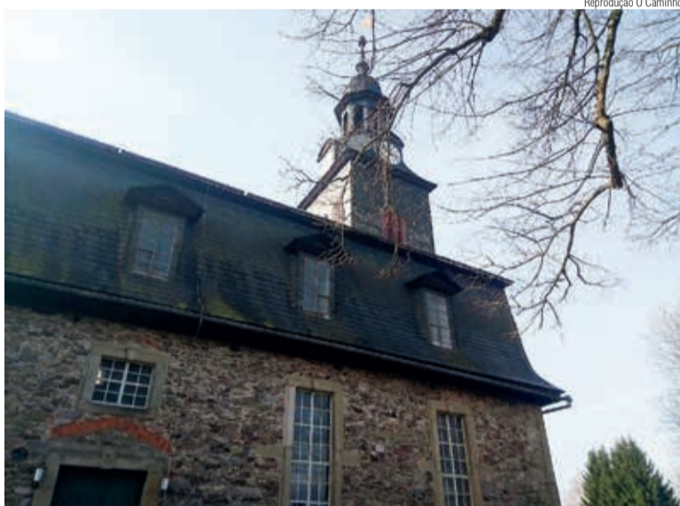
Nesta igreja, em Böhlen, houve um discurso de despedida para o grupo

A história da imigração alemã não é apenas uma história de sucessos e, à medida que nos aproximamos de 2024, é importante que se valorize a história destes que ainda não tiveram espaço e autorização dos donos da memória. E foram esquecidos. Voltaremos ao assunto no próximo número.