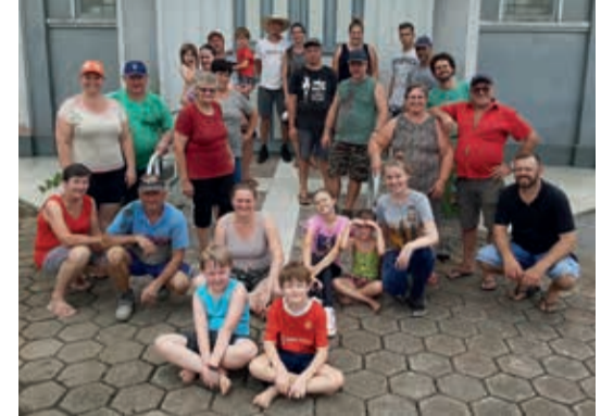
Mutirão de limpeza na Comunidade de Apóstolo Paulo

Dia 12 de fevereiro houve o culto festivo com Jubileu de confirmação de 20, 25, 30, 40, 50, 60, 70 e 80 anos de Confirmação de Fé. Parabéns a todos os jubilaires pelo jubileu e por poderem se fazer presente no culto.