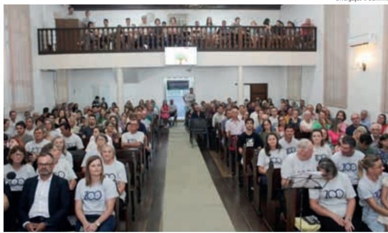
A Comunidade celebra o jubileu renida em culto festivo

Em 20 de junho de 1922, aconteceu o lançamento da