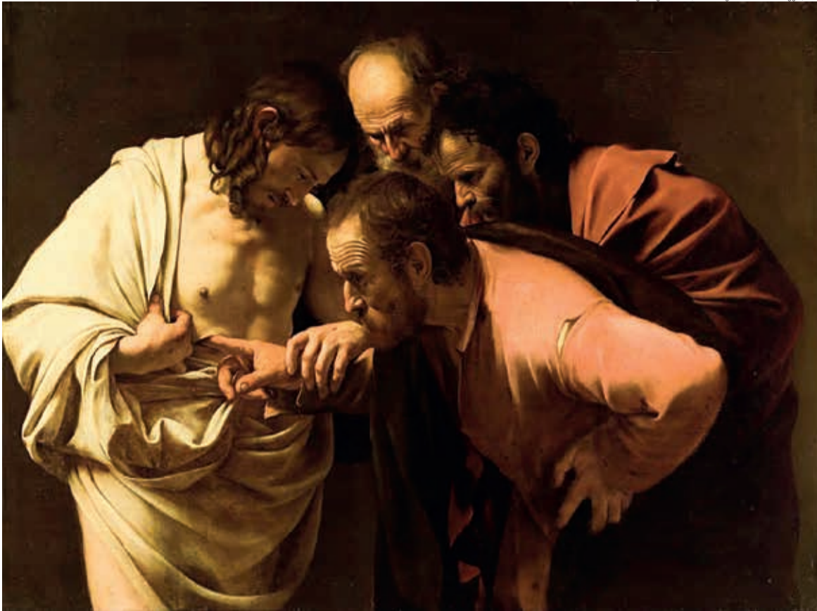
Der ungläubige Thomas/Michelangelo Merisi-Caravaggio/1601