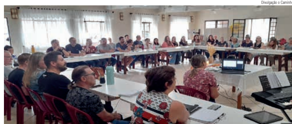
Encontro de lideranças da Paróquia Cristo Salvador em Curitiba

“O PAMI tem ajudado as lideranças a restaurarem a visão, a enxergarem como traçar novos planos, a caminharem