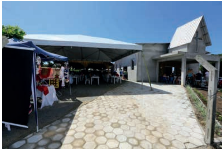
O novo tempo inaugurado na Praia do Ervino, em São Francisco do Sul

A Praia do Ervino é um balneário distante cerca de 25km do centro da cidade e que