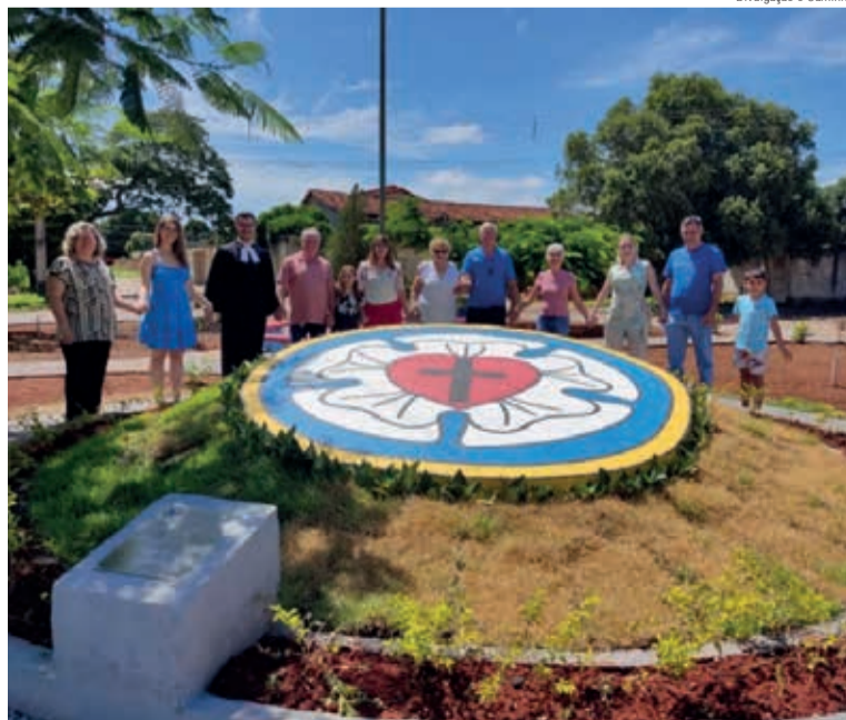
O monumento leva um dos símbolos do luteranismo para a praça

No domingo, 29 de janeiro, a comunidade de Porto Nacional/TO, inaugurou um monumento com a rosa de Lutero na praça da rotatória que dá acesso ao templo. Visando a revitalização da praça e a criação de um espaço de convivência agradável, o que antes estava sendo usado como um depósito de entulhos, vai aos poucos se transformando em um belo lugar. Cores agora dão vida aos bancos, plantas mostram a beleza da Criação. Muito mais do que apenas um belo espaço inaugurado, este visa ser um testemunho da comunidade em sua presença na cidade de Porto Nacional/TO.