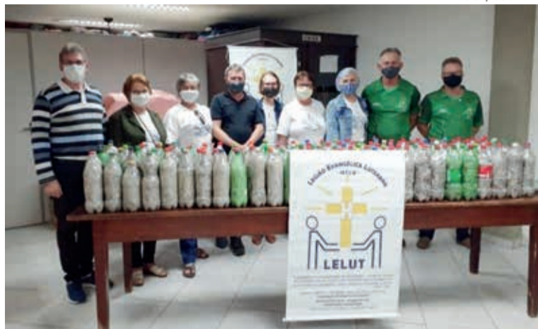
O núcleo trabalhou em parceria com o Grupo de Diaconia da paróquia

O Grupo de Diaconia fará a venda dos lacres e com os recursos obtidos adquirirá cadeiras de rodas, andadores ou outros materiais úteis para pessoas com necessidades especiais para sua locomoção, fraldas geriátricas para pessoas enfermas e outros produtos mais.