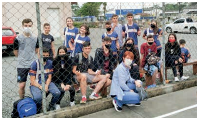
Os grupos da Paróquia Rio Bonito participaram das atividades esportivas

Nos dias 11 e 12 de setembro, cerca de 135 adolescentes e jovens da Paróquia de Rio Bonito, Joinville/SC, reuniram-se para os tradicionais Jogos Paroquiais. Jovens das comunidades de São Lucas de Rio Bonito e Estrada do Oeste, que formam a Paróquia, disputaram as modalidades de xadrez, truco, dominó, tênis de mesa, carpetebol, PES (futebol no Playstation), vôlei misto e futsal masculino e feminino.