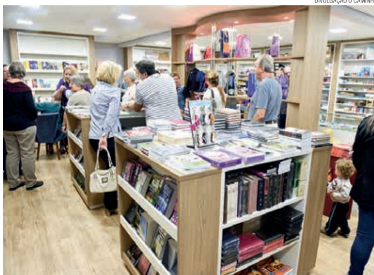
A loja passou por modernização do espaço recentemente

No dia 30 de novembro de 1991, a Comunhão Martin Lutero inaugurou a Livraria Martin Luther, em acréscimo ao Centro de Missão com Folhetos Evangelísticos da IECLB, em Blumenau/SC, visando melhor atender as comunidades e paróquias luteranas e a comunidade local com materiais confessionais, de papelaria e prestação de serviços. Com esta estrutura, ela apoia com mais força as ações missionárias da IECLB, facilitando produção, acesso e distribuição de materiais da