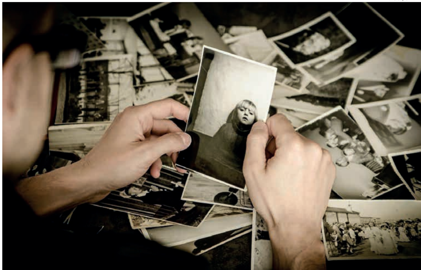
Nesse tempo de memória de quem amamos e partiu, as lembranças podem provocar riso e choro, que revelam a emoção que sentimos

Rir e chorar possuem muitas funções. A risada expressa entre outras coisas familiaridade e sociabilidade. Ela mostra que estamos vinculados e em relação com outras pessoas. Já em outros momentos, demonstra a tentativa de diminuir uma situação de agressividade ou a vontade de apaziguar outros. O choro também é uma reação ao meio circundante. Ele também tem uma função comunicativa que tem sido pesquisada por neurocientistas. Quando ouvimos outras pessoas chorando, nossa amígdala é ativada. Surge na pessoa que ouve um afeto, um sentimento de comoção que é