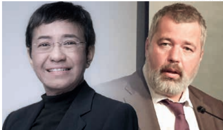
Maria Ressa (Filipinas) e Dmitri Muratov (Rússia) no Nobel da Paz 2021

Os dois foram homenageados em nome de todos os trabalhadores da mídia que defendem o ideal de liberdade de expressão em um mundo no qual a democracia