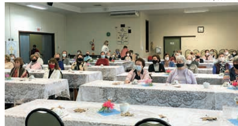
O aniversário do grupo OASIS foi celebrado com um café