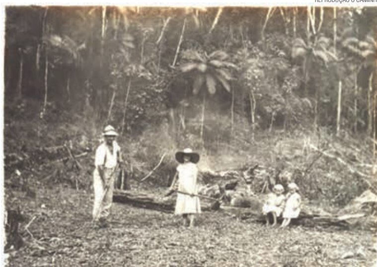
No bioma da Mata Atlântica havia muito a ser aprendido

É importante salientar que no período, ao mesmo tempo em que ocorria grande afluxo de imigrantes, verificava-se considerável progresso técnico