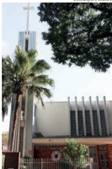
Templo Luterano de Maringá

A ferramenta metodológica utilizada para o planejamento foi a matriz SWOT, que permite boas análises e projeções para o futuro. A sigla SWOT é acrônimo para as palavras inglesas Strengths, Weaknesses, Opportunities e Threats , que em tradução literal significam Forças, Fraquezas, Oportunidades e Ameaças