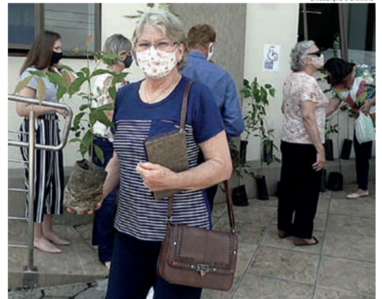
Os membros da comunidade trocaram mudas de árvores entre si