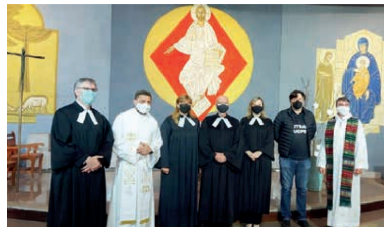
Ato ecumênico pelas vítimas da Covid-19 na PUC/PR

comunidade passou a integrar a Paróquia Evangélica de Confissão Luterana em Gaspar.