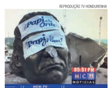
O busto de Lutero decapitado

UM ATO DE VANDALISMO no último dia 31 de outubro causou indignação aos luteranos hondurenhos, da Igreja Cristã Luterana de Honduras. O busto do Dr. Martim Lutero, colocado numa praça no centro da capital, Tegucigalpa, pelos 500 anos da Reforma, foi destruído. Segundo lideranças da igreja, ainda não está claro se o ato foi motivado por ódio ou por puro vandalismo. A cabeça de Lutero decapitada apareceu com olhos e boca vendados por propaganda política. A polícia hondurenha está investigando o caso.