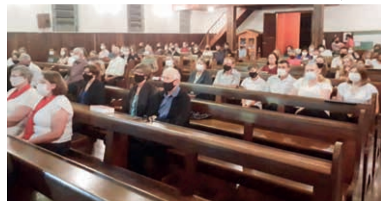
A comunidade reunida celebra o seu jubileu em culto