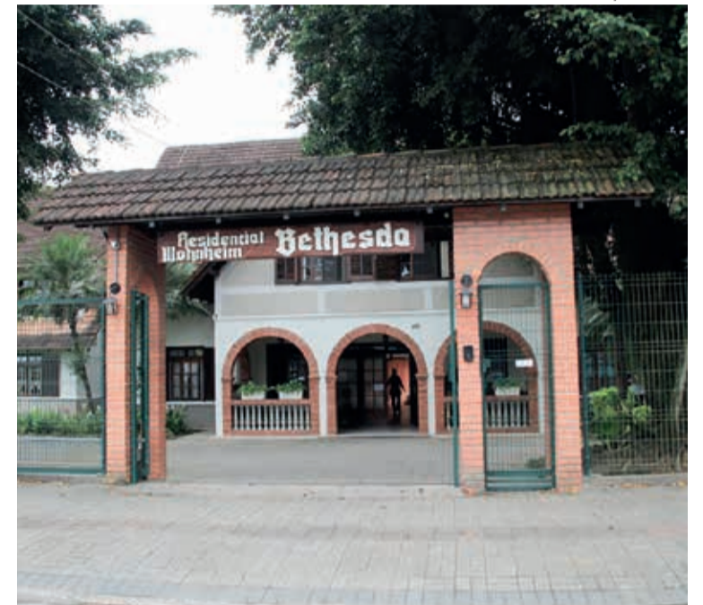
Portal de entrada da Instituição, em Pirabeiraba

Como uma das entidades filantrópicas e de utilidade pública mais antigas do Estado de Santa Catarina, a Instituição Bethesda comemora, em dezembro, quase nove décadas de atividade ininterrupta, com força, foco e fé. Fundada em 16 de dezembro de 1934, a Instituição Bethesda nasceu como fruto de obstinado esforço conjunto da comunidade luterana de Pirabeiraba, distrito de Joinville/SC.