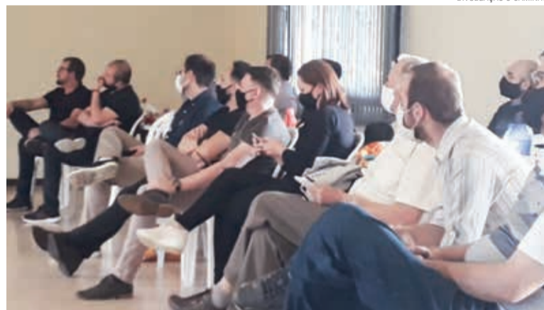
Ministras e ministros participaram com entusiasmo do encontro