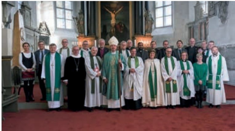
Ministros/as das diferentes igrejas ligadas à Comunhão de Porvoo

Tais conversações aconteceram entre 1989 e 1992 e estabeleceram comunhão plena entre as igrejas signatárias do acordo. Até o ano de 2014, seis igrejas anglicanas e nove igrejas luteranas haviam assinado o acordo como membros. Apenas uma igreja, desde 1994, está sob o status de “Igreja Observadora”, não sendo uma signatária formal do acordo.