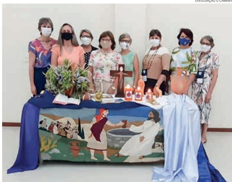
A Diretoria Nacional da OASE coordenou o encontro nacional