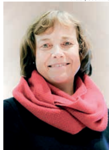
Pa. Anette Kurschus

O pastor Dr. Heinrich Bedford-Strohm, bispo luterano da Baviera, na Alemanha, não concorreu à reeleição a que tinha direito, para presidir por mais uma temporada o Conselho da Igreja Evangélica na Alemanha. No Sínodo da Igreja, em Dresden, Anette