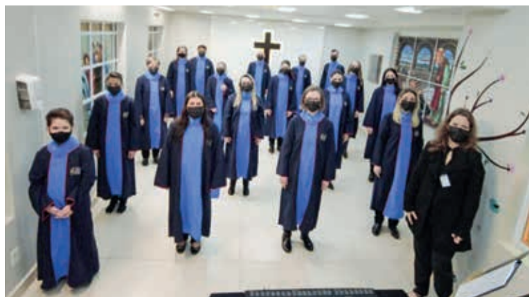
O coral é integrado por funcionários do Hospital Dona Helena