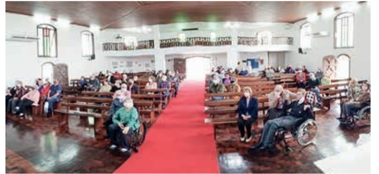
Cerca de 20 PCD com suas famílias participaram do culto