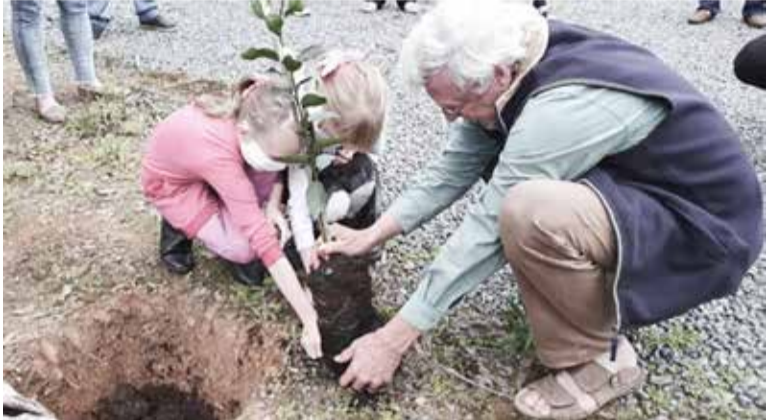
Para o Galo Verde, ação diaconal também significa cuidar da Criação