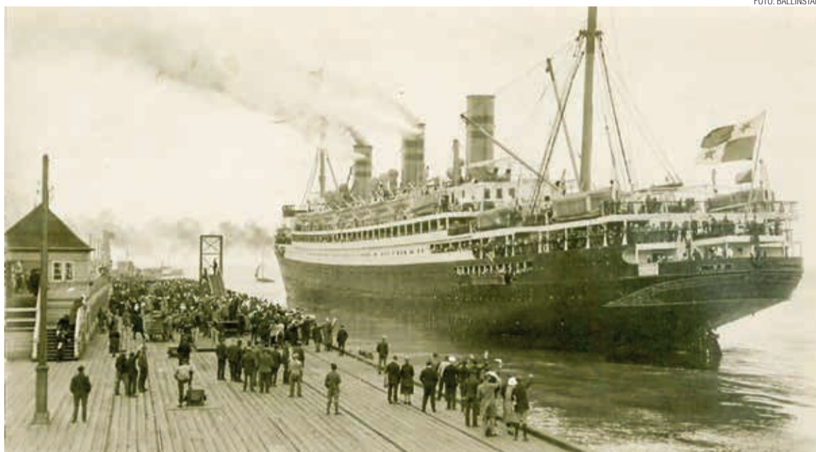
Vapor Resolute parte da Alemanha, em 1924. Muitos outros partiram de Hamburgo, antes e depois dele

A pesquisa recente sobre a história da imigração tem revelado detalhes interessantes. Um dado até então pouco pesquisado mostra que nem todos os imigrantes chegaram ao destino por eles contratado na hora da compra de suas passagens. Também não há registros em portos e listas de passageiros revelando a mudança de rota de alguns navios. No entanto, a lista de emigrantes que embarcaram em portos europeus nem sempre confere com os dados de entrada no país de destino. Da mesma forma, o número de imigrantes que de fato aportaram no Brasil não confere com o número de emigrantes oficialmente registrados pelas autoridades portuárias na Europa. Sabe-se que muitos imigrantes viajaram de forma clandestina, ou seja, sem a carta de saída do país, exigida, por exemplo, pelo governo prussia-