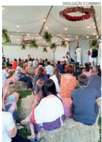
Apresentação de peça de Natal

A Vila Natalina tornou-se o principal evento natalino do município de Campo Alegre e contou com o apoio da Lei Aldir Blanc, Lei nº 14.017 de 29 de junho de 2020, de apoio à cultura, especialmente em razão da pandemia de COVID-19.