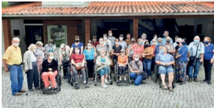
As pessoas do encontro diante da sede administrativa de Rodeio 12

A Pastoral da Pessoa com Deficiência-PD é uma atividade diaconal que promove o acolhimento, o bem-estar, a reflexão cristã, a inclusão e a integração de familiares, amigos e pessoas com deficiência. A partir desta proposta, a coordenação promoveu um encontro, no dia 20 de novembro, no Centro de Eventos Rodeio 12, que envolveu 40 pessoas vindas de diversas comunidades do Sínodo.