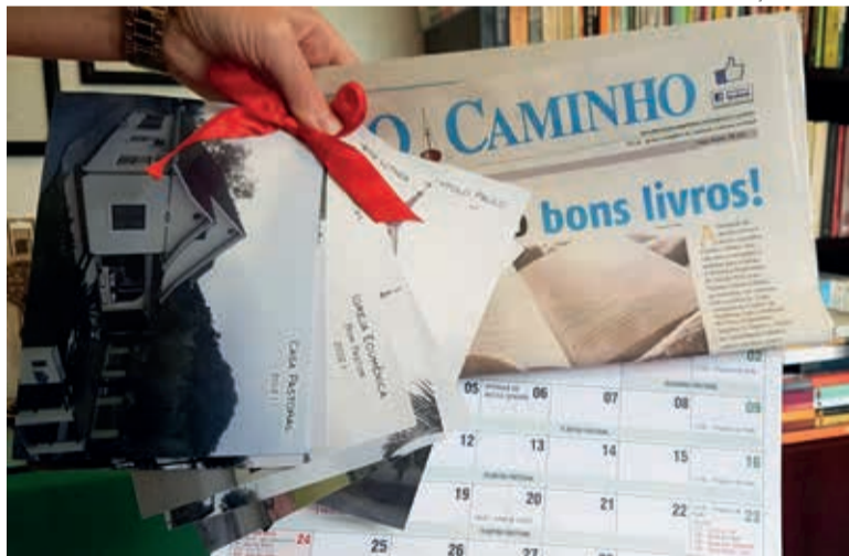
Uma edição do jornal no memorial a ser aberto em 40 anos

Em 19 de novembro de 2021, em frente à Prefeitura Municipal de Massaranduba/SC, foi depositada uma cápsula do tempo, para ser aberta daqui há 40 anos. A Paróquia Evangélica