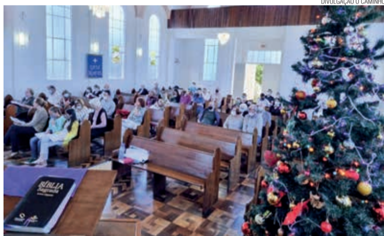
A Paróquia do Planalto Central Catarinense é a menor do sínodo

Em um culto especial, com participação de pessoas de diversas comunidades, aconteceu o lançamento do Tema da Igreja para 2022 no Sínodo Norte Catarinense. Foi no 1º Domingo de Advento, 28 de novembro, na Comunidade de Curitiba/SC, Paróquia Planalto Central Catarinense.