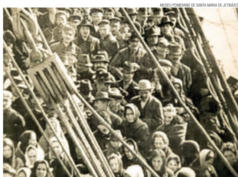
MUSEU POMERANO DE SANTA MARIA DE JETIBAVES

Desta forma, alguns imigrantes acabaram desembarcando acidentalmente no Brasil, quando sua intenção, na verdade, era começar uma nova vida em outro país. Certamente nenhum imigrante foi indenizado pela passagem comprada que prometia a chegada em outro destino. O jeito foi se adaptar e iniciar a jornada em solo brasileiro.