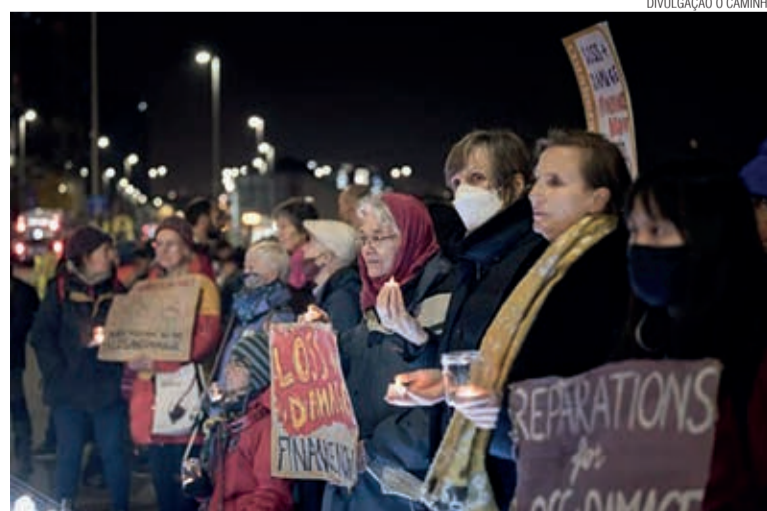
Protesto a favor de impostos justos no mundo

O manual de ferramentas inclui capítulos sobre a história de Zaqueu e a teologia da tributação, bem como sugestões práticas para o envolvimento das igrejas e uma seção para crianças refletindo sobre o conceito do bem comum. Seus objetivos ecoam o apelo urgente feito por líderes religiosos aos chefes das nações do G20 antes da Cúpula em Roma no final de outubro, pedindo uma reinicialização do atual modelo de desenvolvimento mundial baseado no crescimento econômico movido a combustíveis fósseis.