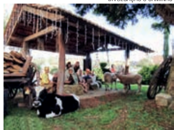
Presépio vivo na praça

Uma iniciativa inédita, a Comunidade de Campo Alegre/SC, no Sínodo Norte Catarinense, organizou uma Vila Natalina no final de 2021. A abertura celebrativa aconteceu no dia 26 de novembro. A cada final de semana ocorreram programações especiais voltadas para o Advento e o Natal.