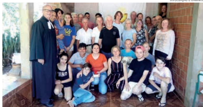
Um encontro no Assentamento, na casa de uma das famílias luteranas