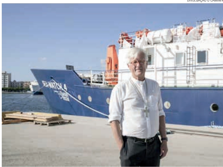
Bedford-Strohm, diante do navio de resgate Sea Watch 4 , em Palermo

A visita do líder eclesiástico alemão fortaleceu as ações de resgate de refugiados no Mediterrâneo. “Não vamos nos calar”, assegurou Bedford-Strohm. “Enquanto houver pessoas desesperadas, em risco de vida e mor-