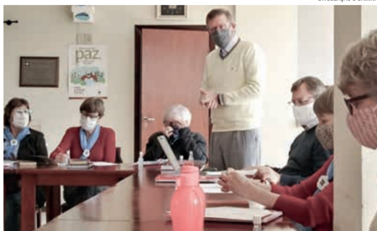
Primeiro encontro presencial em dois anos alegrou a coordenação