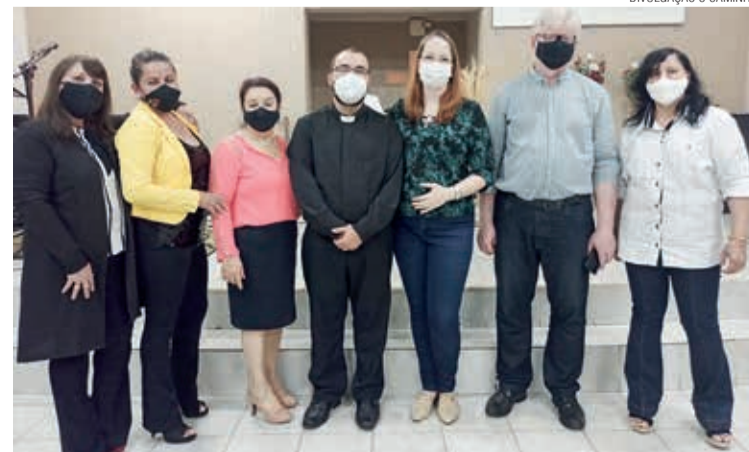
Miss. Paulo (Centro) com a esposa ao lado de convidados

A Comunidade Luterana de Andradina está passando por um processo de revitalização e conta com o auxílio financeiro de mantenedores, dentre eles pessoas físicas, jurídicas, comunidades e sínodos da IECLB.