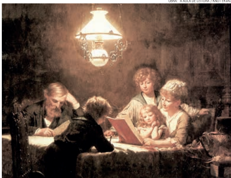
Com livros da biblioteca itinerante, as famílias podiam ler regularmente

Nesse sentido, a Associação Escolar de Santa Catarina ( Deutscher Schulverein für Santa Catharina ), criada em 1904, entre outras funções, entendeu ser importante a criação de uma biblioteca como um forte estímulo para que as pessoas lessem. Mais uma vez, verifica-se aí o