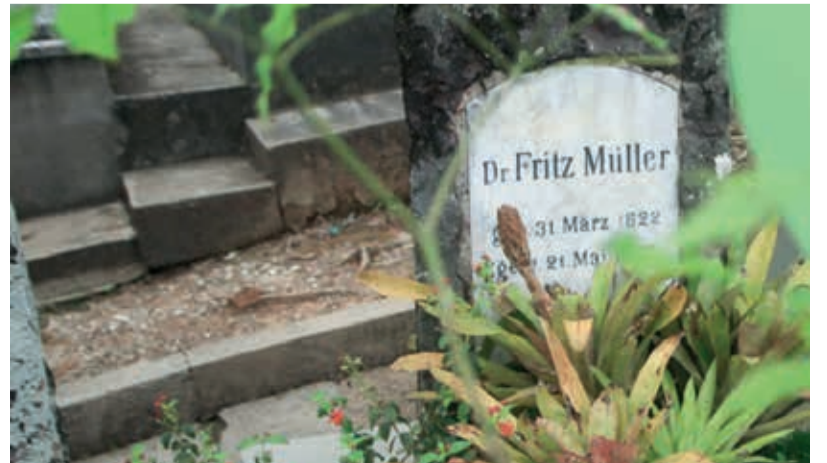
Túmulo de Fritz Müller está no roteiro de "Um Bosque de Memórias" em Blumenau