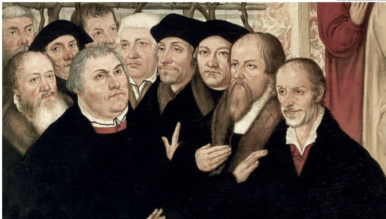
Epitáfio do prefeito de Meienburg mostrando o grupo dos reformadores com Martinho Lutero

Juntamente com seus colegas reformadores – pois a Reforma não foi obra de uma única pessoa, como as comemorações do Dia da Reforma deixam transparecer –, Lutero desenvolvia seus conhecimentos teológicos e bíblicos inicialmente na academia. Somente mais tarde seus escritos e preleções alcançariam um público mais amplo a partir de