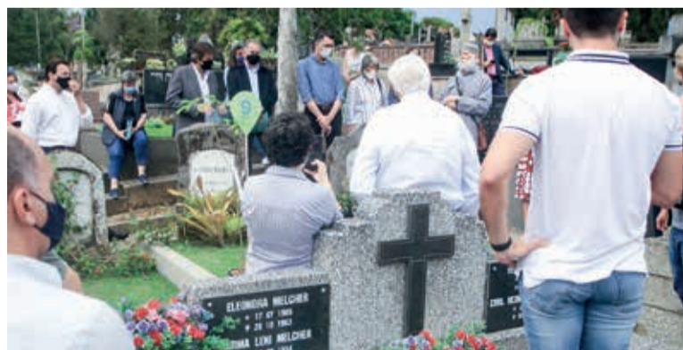
Um Bosque de Memórias foi lançado no dia 21 de setembro

A proposta contempla passeios ao longo dos túmulos a partir de histórias da vida de