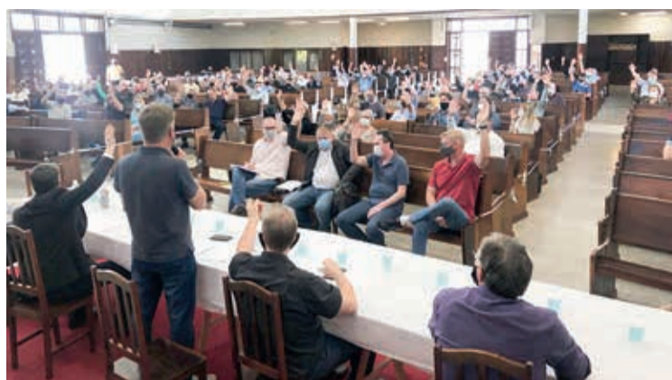
Assembleia extraordinária foi presencial na Igreja da Ressurreição