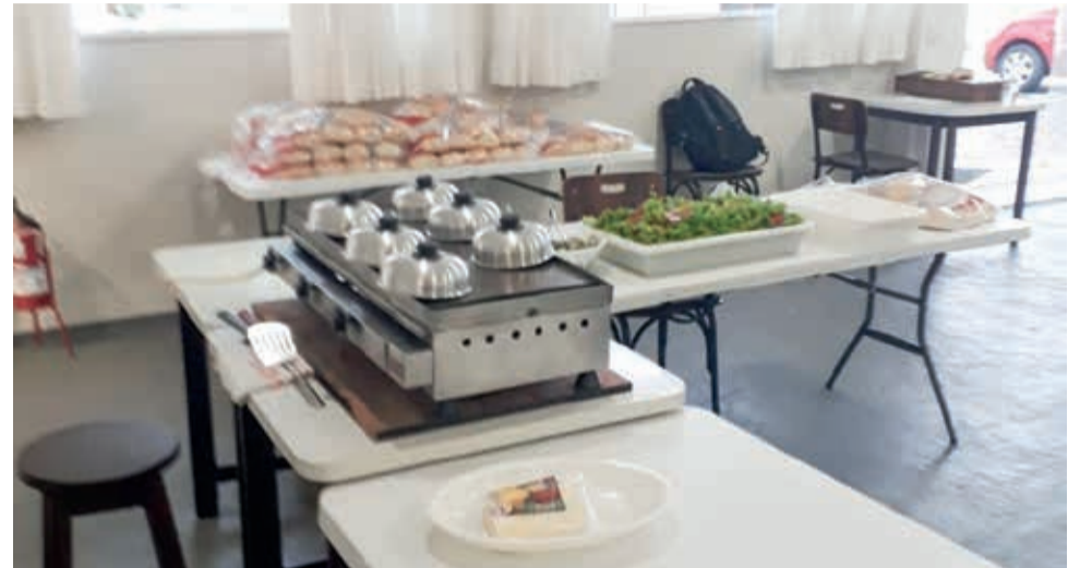
O Drive Thru de Hambúrguer foi organizado pelos confirmandos para ajudar a OGA

lidade junto à Ação Confirmandos, os meninos e menina da comunidade aprendem desde cedo valor do servir ao próximo, bem como a importância que a igreja tem em auxiliar grupos e