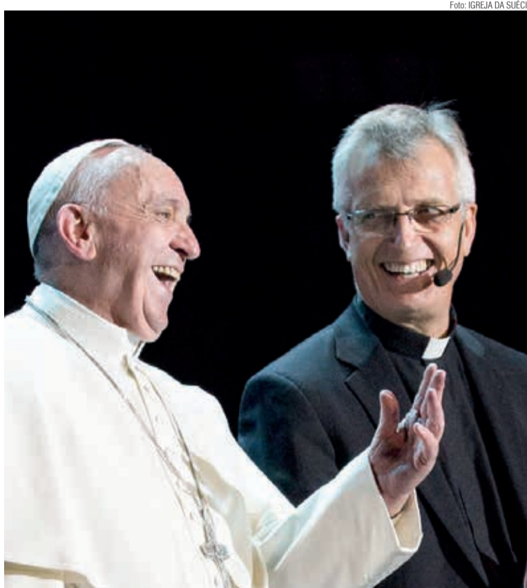
Papa Francisco e Martin Junge, na comemoração dos 500 Anos da Reforma, na Suécia.

O secretário-geral Junge relata marcos significativos do diálogo luterano-católico, especialmente a assinatura da Declaração Conjunta sobre a Doutrina da Justificação em 1999 e a Comemoração Conjunta Católico-Luterana