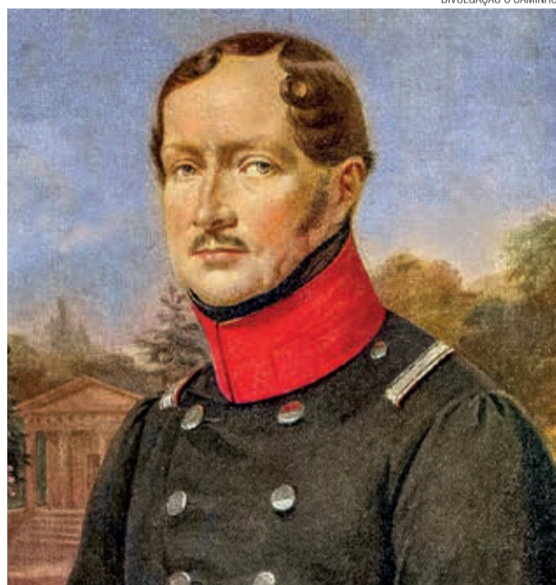
O rei Friedrich Wilhelm III da Prússia, em pintura de Franz Krüger

A autora é pastora da IECLB em Pomerode Fundos e professora visitante na FATEV em Curitiba, reside em Pomerode/SC