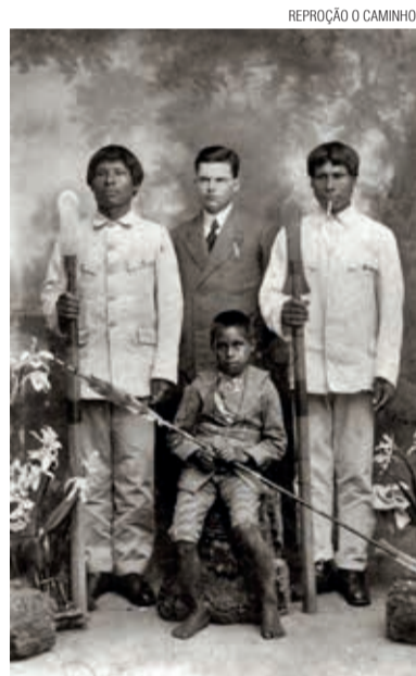
REPROÇÃO O CAMINHO

O autor é professor no Programa de Pós-Graduação em Ciências da Religião, da Universidade Metodista de São Paulo.