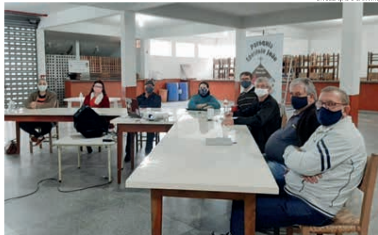
Delegados/as e ministros acompanharam em suas paróquias.