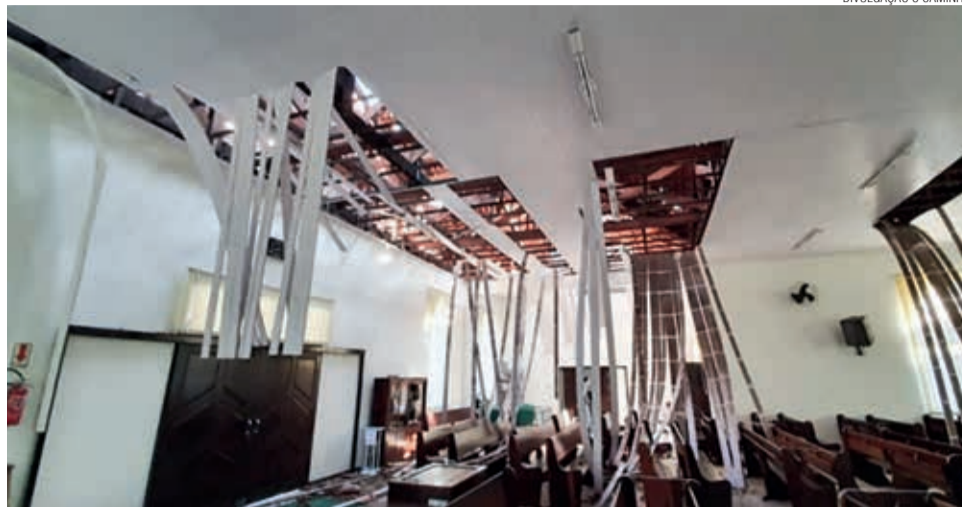
Em Garuva, uma das comunidades mais atingidas, os ventos arrancaram o telhado e destruíram a forração interna das instalações comunitárias.