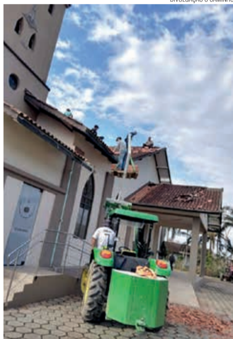
Mutirões consertaram os estragos

túmulos, alguns históricos. O cemitério abriga os restos mortais de Fritz Müller, por exemplo.