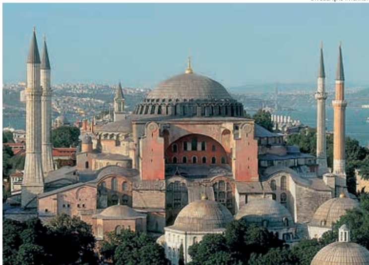
A Hágia Sofia foi igreja cristã por 900 anos, mesquita islâmica por 500 anos e museu por 90 anos; agora volta a ser uma mesquita