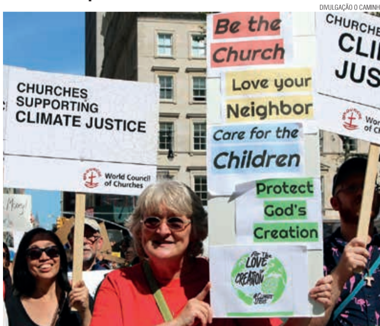
Temas como justiça climática e minorias estão entre os desafios do CMI

Entre os principais legados do CMI, nessa caminhada de 72 anos, está seu compromisso com a paz mundial e com a justiça, além da luta pela integridade da Criação e por justiça climática. A dramá-