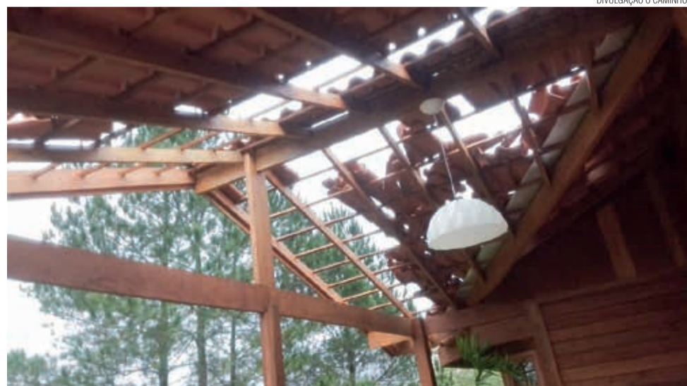
Muitas casas também foram atingidas, como a nova residência do pastor Valdim Utech

Outras casas pastorais também foram atingidas, além de templos e instalações comunitárias em Brusque, Blumenau, Indaial, Timbó e Benedito Novo. No Centro de Eventos Rodeio 12 diversos beirais foram atingidos com reposição de cerca de 800 telhas.