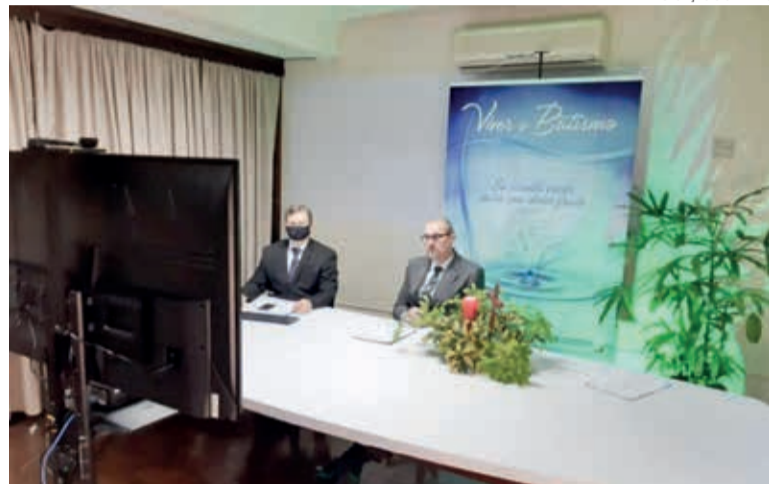
O pastor sinodal e o presidente conduziram a partir da sede sinodal.

O dia 27 de junho foi especial para a história do Sínodo Norte Catarinense, com a realização da 23ª Assembleia Sinodal on-line . Em torno de 240 representantes das comunidades e dos setores de trabalho do sínodo participaram. Houve intenso preparo técnico anterior, orientações acerca de procedimentos e muita expectativa.