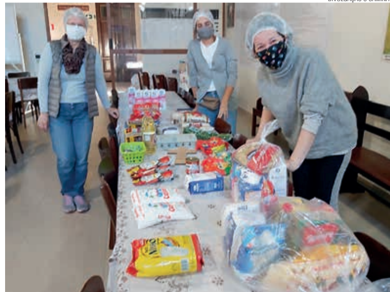
Voluntárias da Igreja de Cristo preparam as cestas básicas