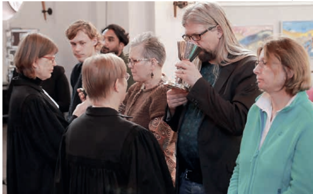
A Santa Ceia pressupõe presença física da comunidade e somente um Concílio pode mudar isso

Em conjunto com pastoras e pastores sinodais, a Presidência da IECLB emitiu orientações sobre o assunto. “A Confissão de Augsburgo entende que o Evangelho