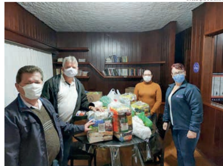
Presbíteros montaram postos de coleta de donativos nas comunidades