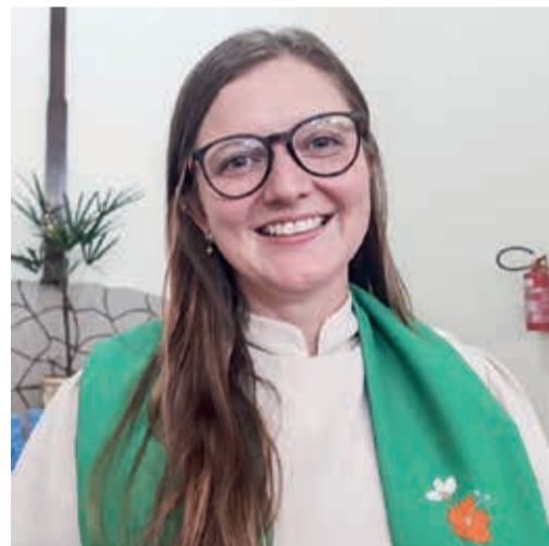
A Pa. Paula foi instalada em Assis.