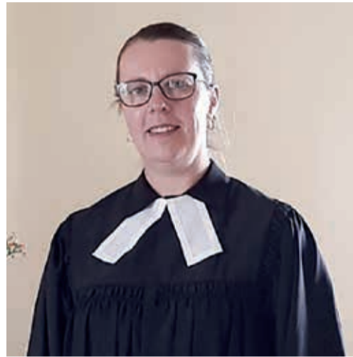
A Pa. Ramona foi instalada em Rolândia.