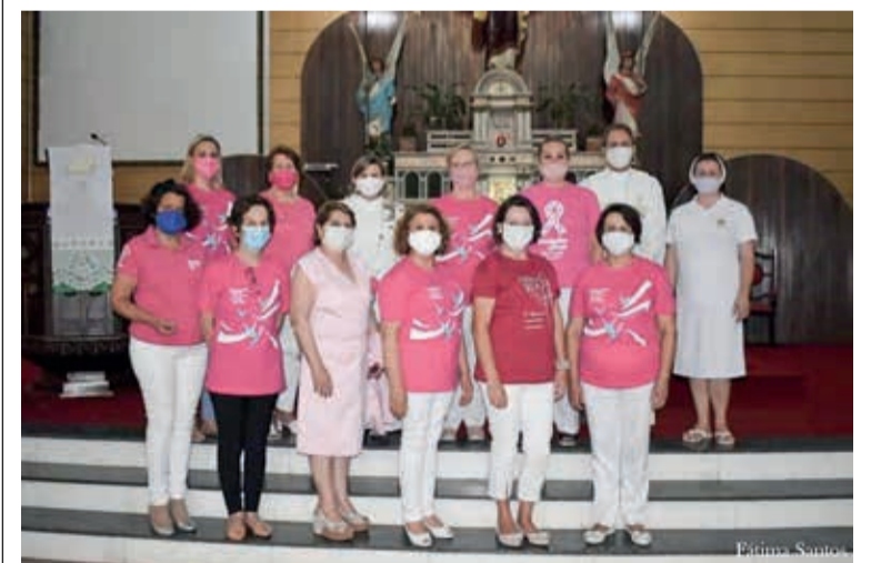
As voluntárias da Rede Feminina de Combate ao Câncer