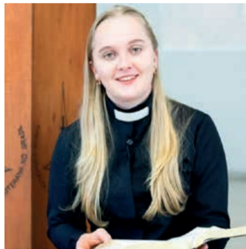
A Mis. Daline foi instalada em Três Lagoas.