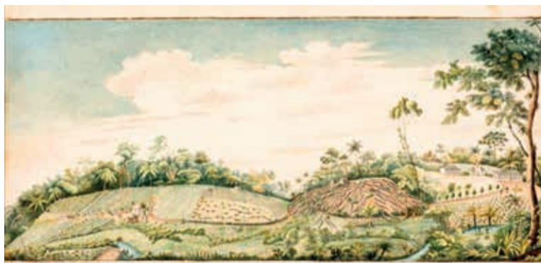
Aquarela de Bosset de Luze retrata a Fazenda Pombal, na colônia Leopoldina, no sul da Bahia por volta de 1816

Desde 1729, quando o Conselho Ultramarino emitira parecer favorável à necessidade de instalação de colonos não lusos no Brasil, nenhuma iniciativa fora tentada até a chegada do rei d. João VI (1767-1826), em 1808. Pelo Tratado de Aliança e Amizade, assinado com a Inglaterra em 1810, o monarca havia se comprometido com a extinção gradual do tráfico negreiro até que ele tivesse fim. A possibilidade de uma grande revolta de escravizados, como a