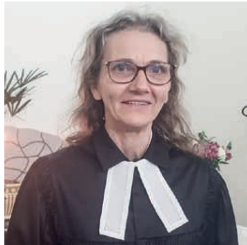
A Pa. Maria foi instalada em Marília.