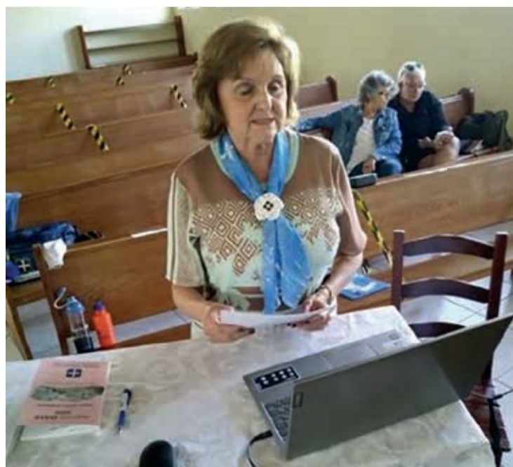
Em torno de 90% das lideranças participaram da assembleia virtual

Inicialmente, essa Assembleia estava prevista para abril de 2020. Foi suspensa, cancelada e reconvoçada para um novo formato. E, nesse formato, mais de 90% das lideranças convocadas participaram. Diversas ministras e ministros também se fizeram presentes, auxiliando as mulheres a fazerem o acesso à plataforma da Assembleia.