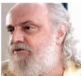
Aldir Blanc foi um letrista, compositor e cronista brasileiro que faleceu no dia 4 de maio vítima de Covid-19.

O auxílio destina-se a pessoas físicas e jurídicas. Artistas, contadores de histórias, produtores, técnicos, curadores, professores de arte e outros. Para receber o auxílio é preciso comprovar a realização de atividades culturais nos últimos dois anos. Documentos, registros, fotos servem como comprovantes. Pessoas jurídicas são espaços culturais, escolas de capoeira, museus e bibliotecas comunitários entre outros.