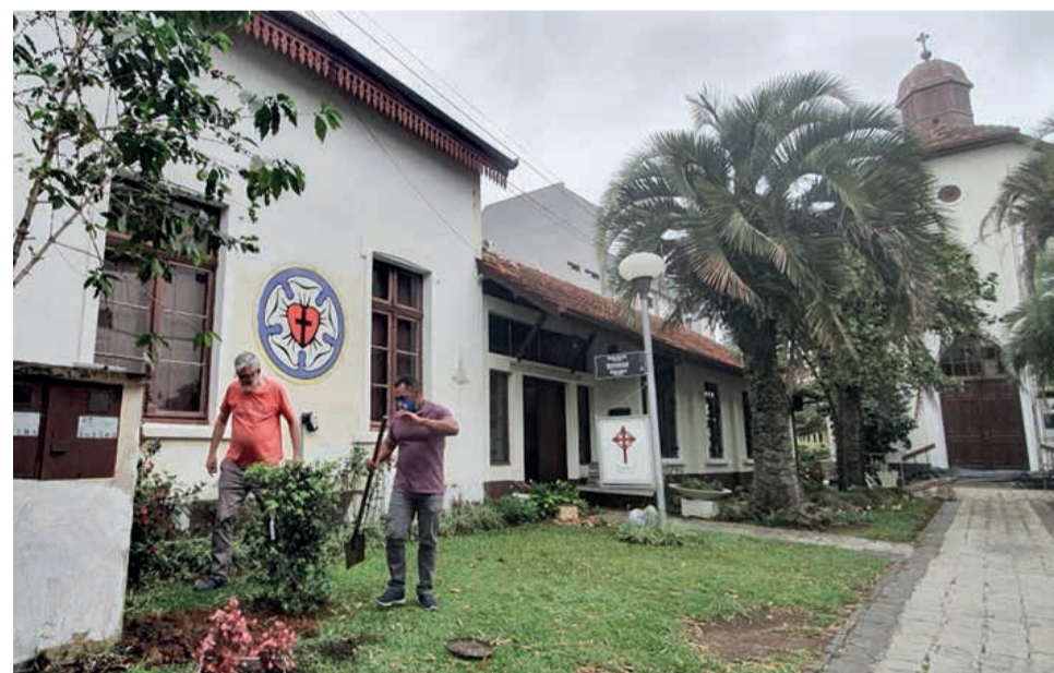
As árvores plantadas no Tempo da Criação são adotadas por crianças