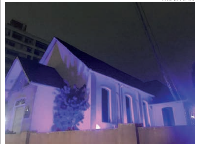
A igreja dos Apóstolos ficou iluminada de rosa em Joinville

A Paróquia dos Apóstolos, ligada à Comunidade Evangélica de Joinville/SC, demonstrou seu apoio ao Outubro Rosa de maneira peculiar. Ao redor do templo foram instaladas luminárias de cor rosa. À noite ocorre uma transformação que chama a atenção de quem passa em frente ao templo.