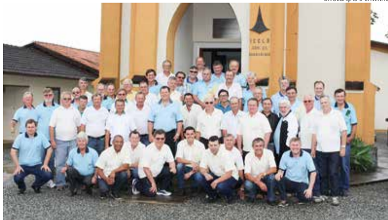
Homens que participaram da assembleia e seminário da Lelut.

Em 10 de novembro aconteceu, na Comunidade Guarani-Açu, da Paróquia de Massaranduba/SC, o seminário e assembleia da Legião Evangélica Luterana-Lelut do Sínodo Norte Catarinense, quando foi eleita a nova coordenação para o biênio 2019-2020.