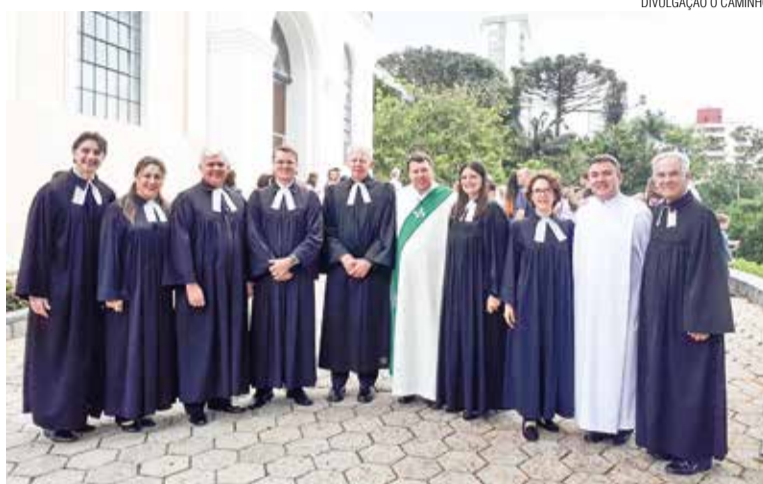
Ministros atuantes e residentes em Brusque concelebraram no dia 31.

Foi um culto alegre e festivo. As diversas participações na liturgia demonstraram a riqueza e a diversidade da vida nas comunidades, por parte de ministros e ministras, bem como dos grupos de canto e corais. Cada apresentação musical trouxe uma bela mensagem e um pouco da história de cada grupo.