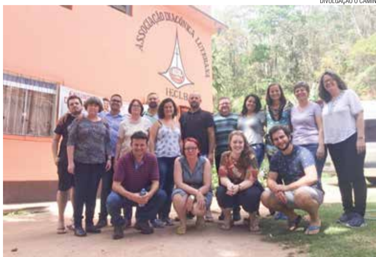
Participantes do grupo gestor da Rede diante do prédio da ADL.

O grupo deu continuidade à elaboração do Projeto Político Pedagógico da Rede de Diaconia, a ser aprovado no Encontro Nacional