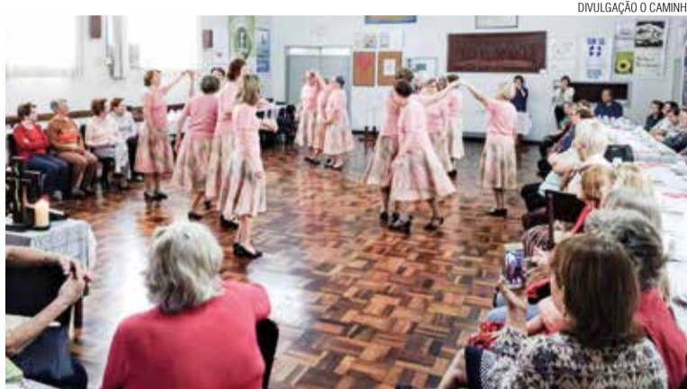
Apresentação de Dança Sênior esteve na programação do encontro.