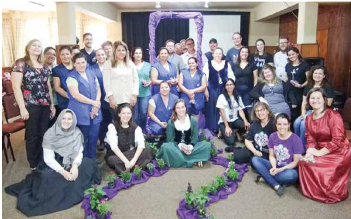
Ao contarem suas histórias, as mulheres da Reforma destacaram as portas que foram abertas em suas vidas.

Na parede do auditório H estava projetada a Rosa Luterana. No centro desse símbolo está a cruz de Cristo, que nos lembra de que toda autoridade, mesmo que tenha recebido a bênção para o exercício de sua vocação, deve defender a vida. Desde a época da Reforma do século XVI, denuncia-se, por exemplo, a violência sofrida pelas mulheres, conforme podemos ver na tese 75 escrita por Lutero. A salvação trazida por Jesus na cruz vivifica o coração humano para que tenha força para denunciar as injustiças e promover a vida, a justiça e a paz, valores representados no símbolo pela rosa branca. O azul que envolve a rosa branca nos lembra de que, pela fé, terra e céus estão unidos e esse vínculo é eterno, conforme simbolizado pelo