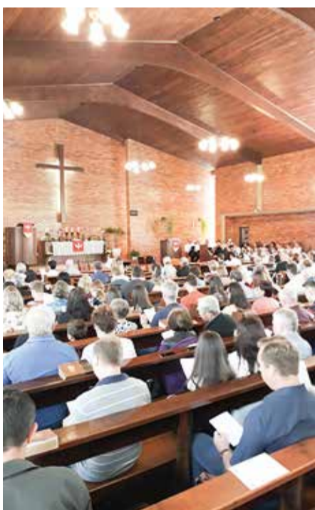
A igreja local ficou lotada para o culto.

Foram lidos os textos bíblicos de Romanos 3.19-28 e Salmo 46 e entoados hinos clássicos da Reforma. A pregação partiu da explicação de Lutero sobre o Credo Apostólico na perspectiva de “o que Deus faz em nós” para atualizarmos no “o que fazer” com base no Tema do Ano: “Igreja, Economia e Política”.