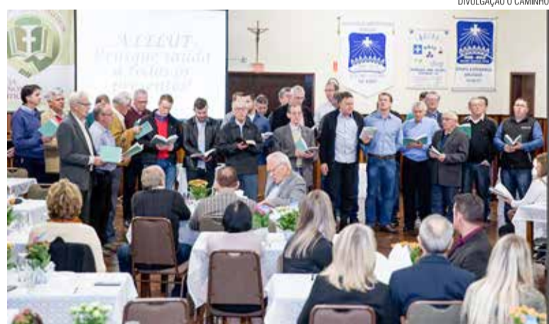
Uma noite especial marcou o jubileu de prata do núcleo brusquense.