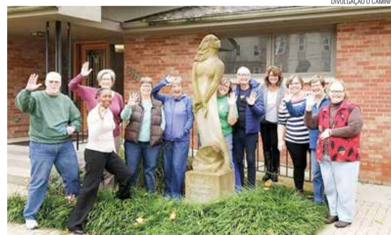
O grupo em Valparaíso compartilhou e planejou ações diaconais.

De 4 a 11 de novembro aconteceu em Valparaíso, estado de Indiana-EUA, a reunião anual do comitê central de DOTAC ( Diakonia of the Americas and Caribbean ). DOTAC é um grupo ecumênico de comunhões/comunidades diaconais cristãs da América do Norte, Caribe, América Central e América do Sul. A IECLB faz parte desse grupo através de suas duas comunhões diaconais, a COD-Comunhão de Obreiros Diaconais e a Casa Matriz de Diaconias.