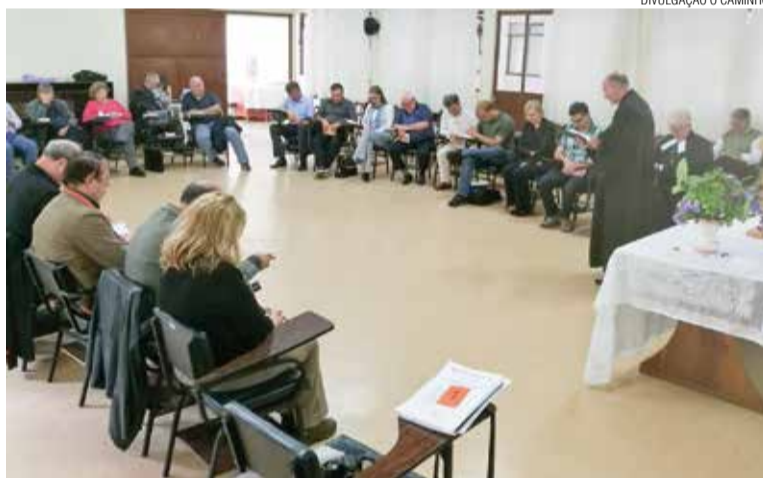
O Conselho elegeu sua nova diretoria, instalada em culto ao final.

O pastor sinodal, ao compartilhar seu relatório, destacou pontos importantes não só deste ano mas da gestão como um todo. Ao final, fez breve síntese dos desafios que o sínodo tem pela frente, incluindo a sua nova função de pastor 1º