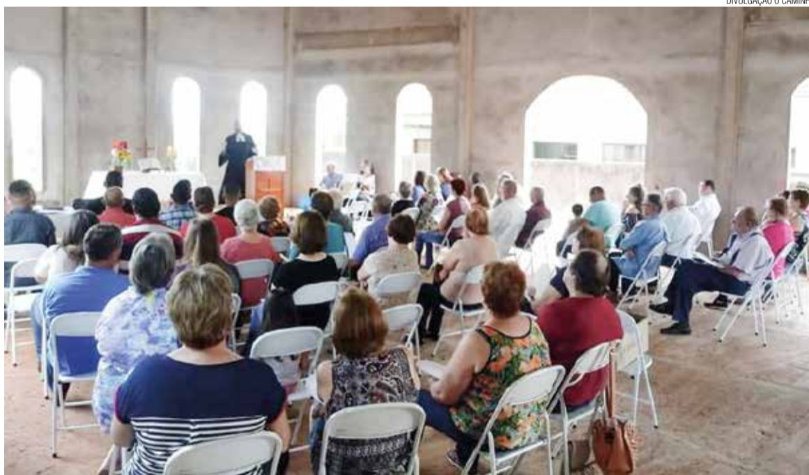
A comunidade participou do primeiro culto, celebrado no templo ainda sem janelas e portas.

No dia 14 de outubro de 2018 foi realizado o primeiro culto, tal como o templo está. Sem as portas e janelas e sem o piso. Mas, foi um