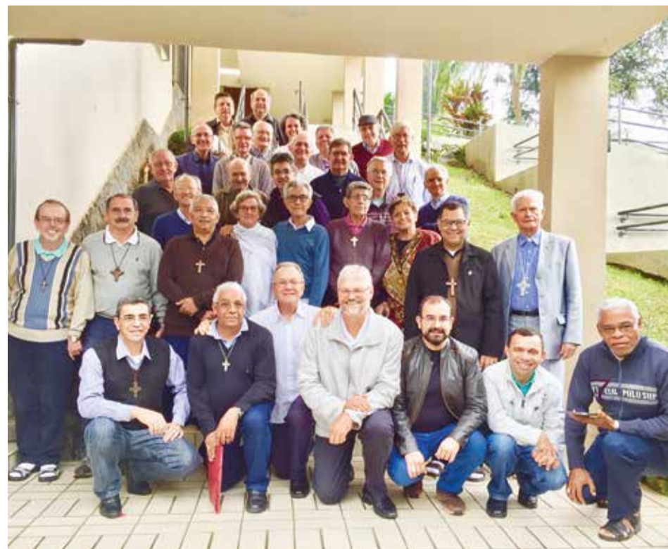
Participantes do Curso Latinoamericano de Estudos para Bispos da ICAR.

Queira Deus inspirar nosso canto e compromisso, como nas palavras do HPD 413: “Senhor, se tu me chamas, eu quero te ouvir. Se queres que eu te siga, respondo, - Eis-me aqui!” (um dos hinos cantado numa Meditação e Oração durante o Curso de Estudos para Bispos).