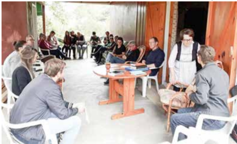
As lideranças da comunidade passaram o dia em diálogo.