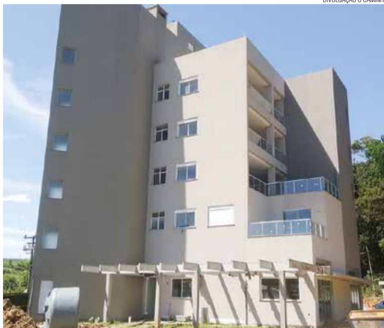
Estágio atual da obra da nova sede sinodal e apartamentos anexos, em Blumenau. Além da sede administrativa, o local será moradia do pastor sinodal, do assessor de Formação e do pastor da paróquia luterana do bairro Fortaleza, que doou o terreno para o prédio em troca de um apartamento.

As lideranças do Sínodo Vale do Itajaí expressaram gratidão ao chef de cozinha, que presenteou com 100% dos custos toda a refeição servida, dando uma demonstração de carinho e desprendimento pela