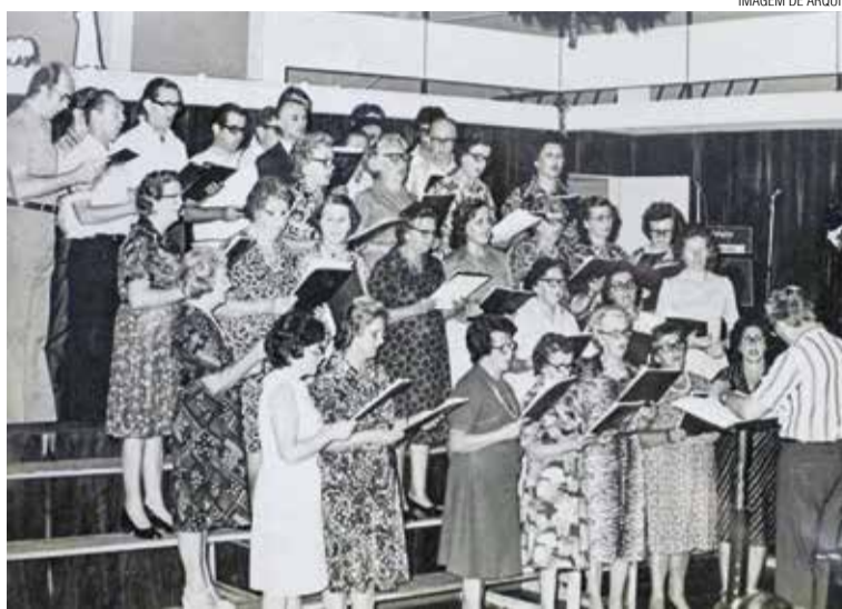
Apresentação do coral no passado, em foto sem datação.