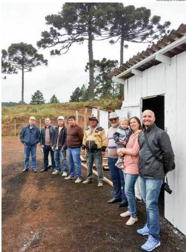
Equipe que inicia a obra com um grupo de apoiadores.

Eu estive junto. Sou testemunha ocular. Pessoas como tu e eu, com olhos brilhantes de esperança, chegaram, às 7h e 30min do dia 4 de junho de 2018, ao local doado onde será levantada a construção. De um porta-malas brotou uma mesa