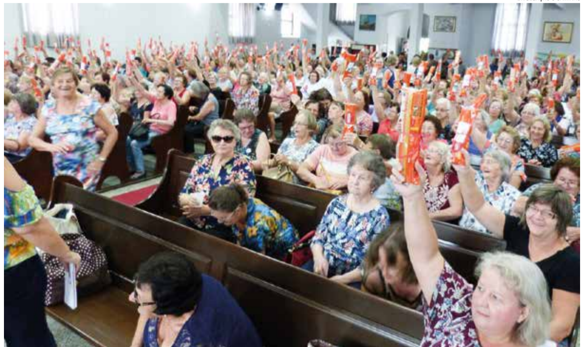
Testemunho, Comunhão e Serviço é o lema vivenciado nos 1.200 grupos de toda a IECLB.

“Muitas foram as pessoas chamadas a se incluir nesta caminhada. Muitas contribuíram com seus testemunhos, dons, talentos e capacidades, além de encontrar alento e coragem para novos desafios diante da vida. Muitas foram as pessoas auxiliadas em suas necessidades e dores, e tantas outras, encontraram seu espaço para se envolver e servir com amor, alegria e gratidão” escreve