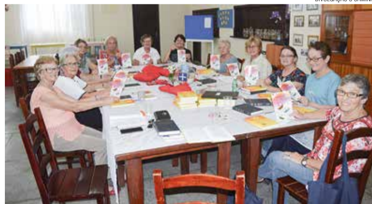
O CAMINHO