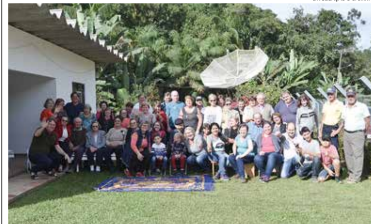
Famílias que participaram do encontro em Treze de Maio.