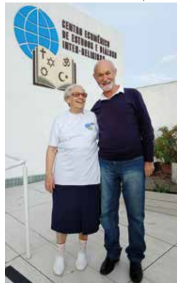
DIVULGAÇÃO O CAMINHO

O evento foi muito significativo e marcado por um elevado