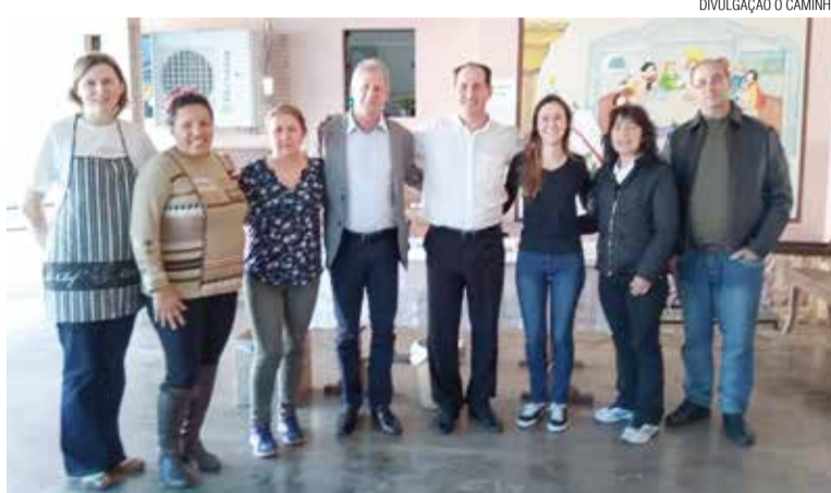
Lideranças de Apóstolos-Joinville e Araucária na Festa de Pentecostes.

Nos últimos três anos, a paróquia tem promovido eventos para angariar recursos em prol da Campanha Vai e Vem, proporcionando comunhão, participação e comprometimento com os projetos missionários da IECLB. Em setembro de 2016 e 2017 foram realizadas noites do hambúrguer e, neste ano, uma deliciosa galinhada com