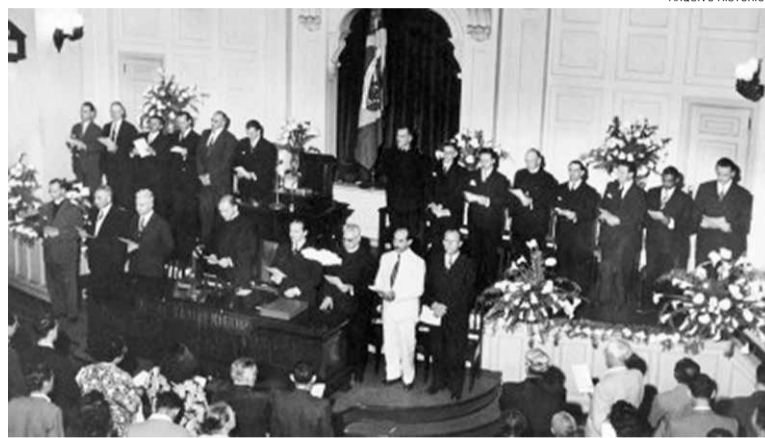
Foto histórica do culto inaugural da Sociedade Bíblica do Brasil em 1948.