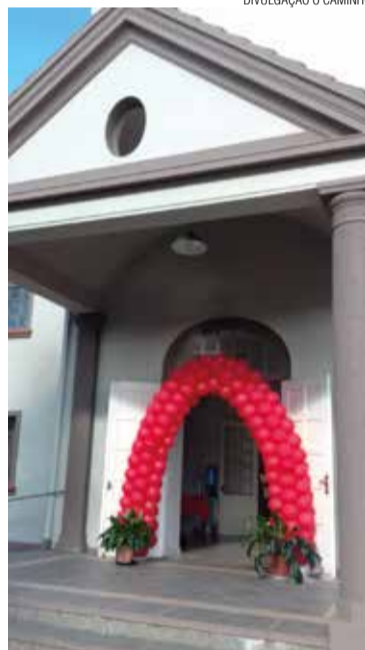
A entrada do templo enfeitada.

A Comunidade Evangélica de Confissão Luterana de Porto União e União da Vitória faz parte do Sínodo Norte Catarinense e foi fundada em 11 de maio de 1913, um domingo de Pentecostes, data considerada pelos cristãos como o início da Igreja