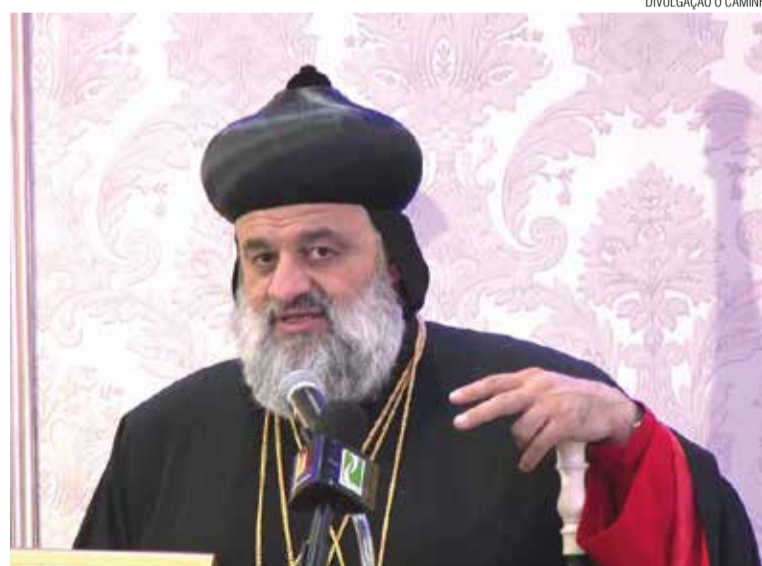
Patriarca ortodoxo Mor Ignatius Aphrem II cobra acordo feito no CMI.

Pois não é que justo os ortodoxos continuam sendo vítimas do proselitismo alheio? Quem faz a denúncia é o Patriarca Mor Ignatius Aphrem II, da Igreja Ortodoxa Síria. Ele acusa grupos de cristãos ocidentais de tentar converter fiéis da sua igreja e outros fiéis no Oriente Médio. Especialmente no