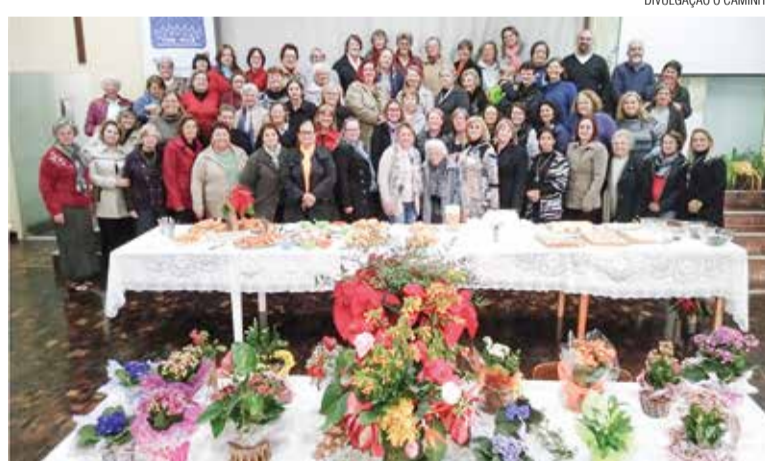
Participantes do seminário em Rio Negro, no dia 6 de junho.

Uma dinâmica inicial comprou as mulheres a flores. No início da vida são como botões desabrochando e se abrindo para a vida. O botão floresce e muda de fase, mas estamos sempre firmes na