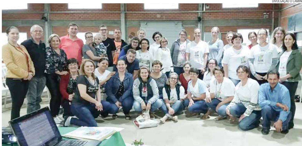
Participantes do seminário organizado pela Pastoral do Batismo.

O Conselho de Pastoral do Batismo quer dar apoio para as famílias e para a comunidade para cumprir com esse compromisso de educar na fé cristã. Para isso, realizam visitas, preparam o culto de aniversário de Batismo e promovem outras