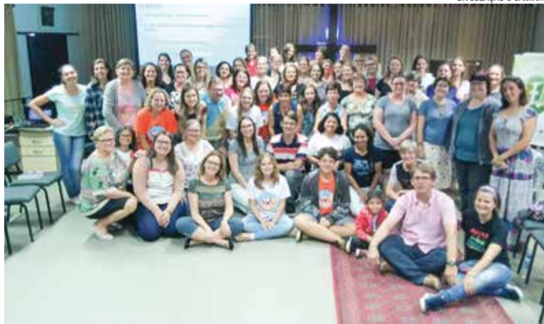
A capacitação ajudou lideranças em seu trabalho educacional.

Percebendo esta necessidade aconteceu no dia 14 de abril a Capacitação em Psicopedagogia para Educação Cristã na Comunidade dos Apóstolos da Paróquia Apóstolo João, em Jaraguá do Sul/SC. No encontro participaram 56 pessoas, entre orientadoras e orientadores de Culto Infantil, de grupos de adolescentes, líderes de JE, de grupos de OASE, de grupos