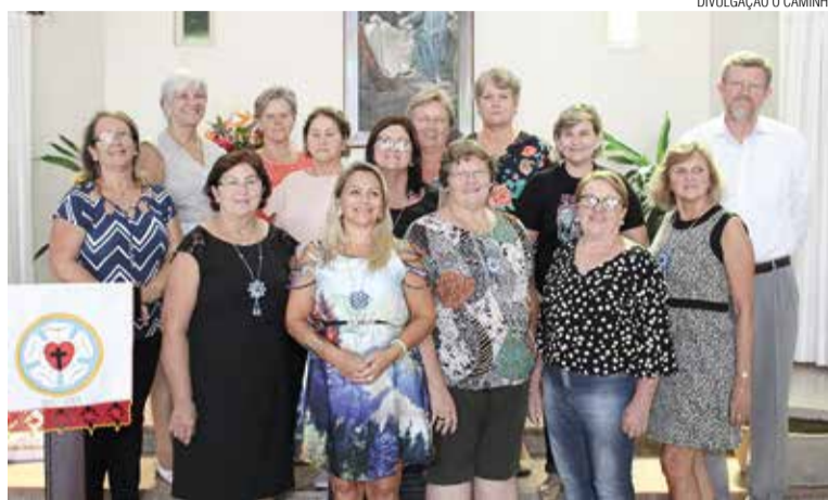
A nova diretoria eleita durante a assembleia na paróquia Bom Jesus.

Momento muito importante foi a eleição da nova diretoria da Associação Sinodal da OASE, que