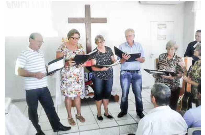
Grupo Cantate de Estrada d'Oeste abrilhantou o louvor no culto.

É raro acontecer, mas foi assim... Templo lotado com gente sentada na varanda para assistir o culto. Também, não era sem motivo, pois a Comunidade de Guaratuba completava Jubileu de Ouro naquele dia 8 de Abril. O pequeno grupo de membros desdobrou-se para atender bem os visitantes de Joinville, Itapoá, Garuva, além de outros. Das poucas pessoas que estiveram presentes no lançamento da pedra fundamental do templo, duas faziam parte do Grupo Cantate de Estrada d'Oeste (Joinville) que ajudou no louvor, com hinos em português e alemão.