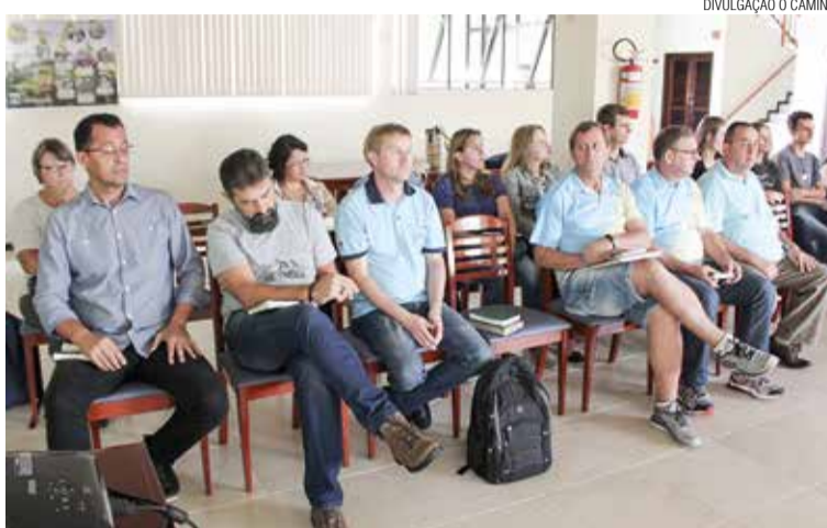
Participantes do seminário de diaconia no Norte Catarinense.

Na parte da tarde os três coordenadores dos projetos que