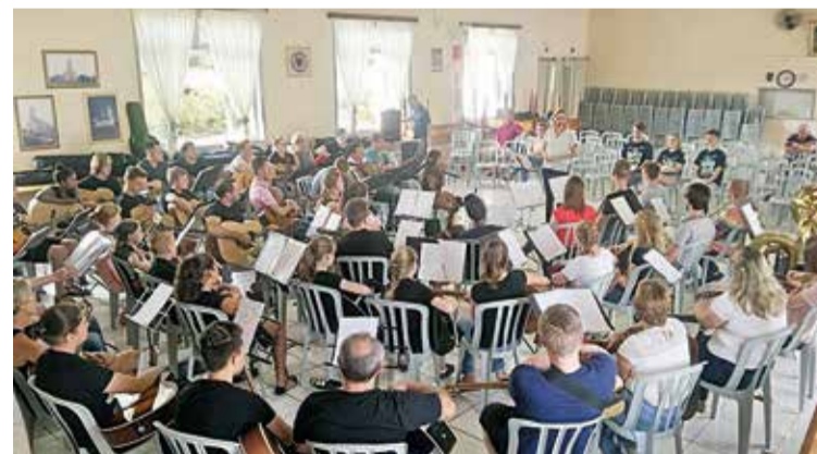
A variedade de instrumentos no encontro impressionou.

Através do Conselho Sinodal de Música do Sínodo Norte Catarinense nos é dada esta bela oportunidade de formação, onde também fortalecemos a nossa fé, aprendemos a ter cooperação mútua, trocamos experiências e somos incentivados a aplicar em nossas comunidades o que aprendemos.