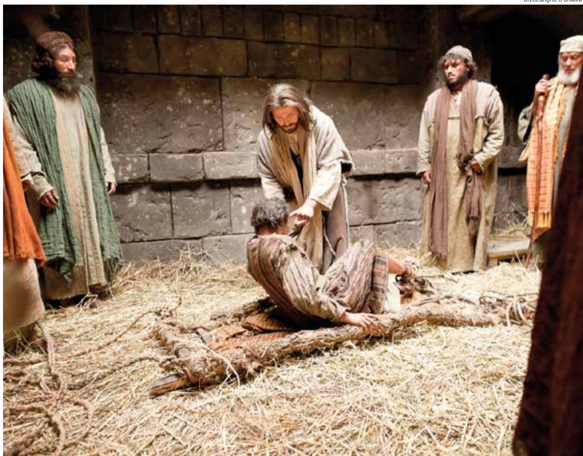
O serviço a Deus não promete o estrelismo, mas espera amor sem segundas intenções – é incondicional.

Jesus se encontra com a pessoa marginalizada e anuncia a reconciliação por meio do perdão que inclui na sociedade e no seu reino. Ela não fica à margem. Essa conversa parece irritar alguém! Os fariseus, que pensavam defender uma fé pura e autêntica com uma leitura fundamentalista das escrituras, não admitem o anúncio de perdão ali proclamado. Jesus não pode anunciar o perdão, ele é como gente de “má fama”. Ele anda com os “pecadores” e não tem nenhuma qualidade para se auto-intitular Filho de Deus. Assim pensavam aqueles que se diziam detentores da fé autêntica que se manifestava em leis e regras vazias. Não havia espaço para a misericórdia e o