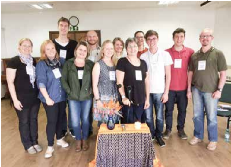
Jovens estudantes que participaram dos seminários em Curitiba.