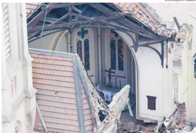
Com 80% destruída, o altar e a torre da igreja permaneceram de pé.

“Tive acesso ao interior da igreja no dia seguinte. O quadro é desolador. Mas é significativo ver o altar intacto. A cruz sobre o altar é simbólica, como se nos dissesse: podem derrubar tudo, mas ainda assim ficarei de pé olhando por vocês”. Também a torre permaneceu de pé, com o órgão centenário que escapou com alguns arranhões.