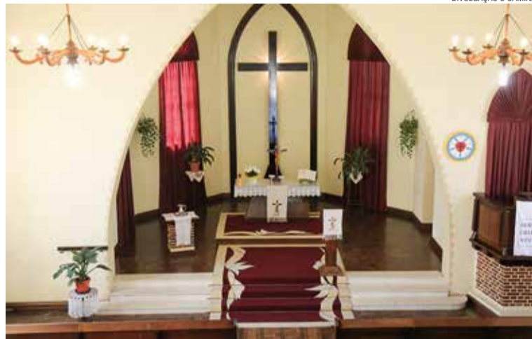
Espaço do altar e do púlpito do templo de Rio Negrinho.

pequeno, a comunidade comprou um terreno e, no dia 10 de fevereiro de 1952 aconteceu o lançamento da pedra fundamental do atual templo.