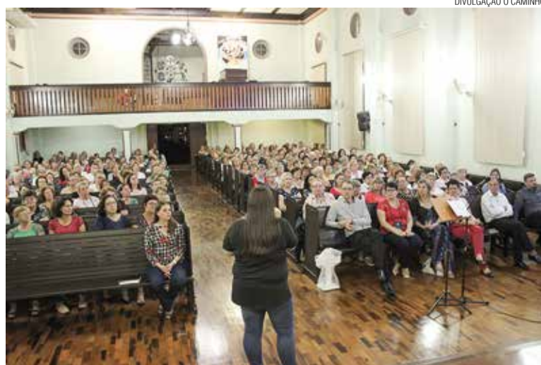
Os grupos de OASE noturnos estiveram em Blumenau-Velha.