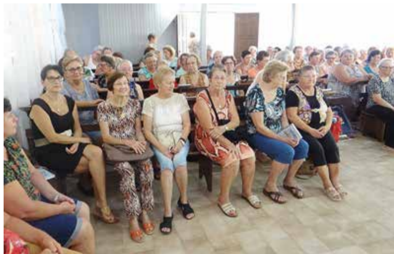
O grupo reuniu os grupos visitantes na pequena igreja da Mulde Alta.