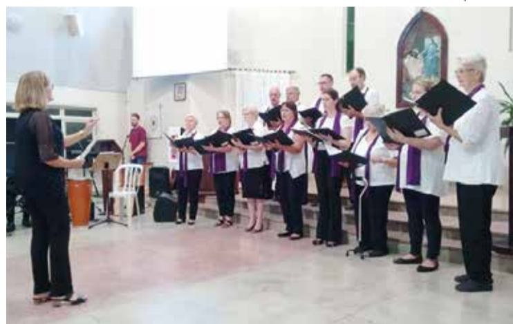
Um dos grupos de canto durante sua apresentação na Vila Nova.