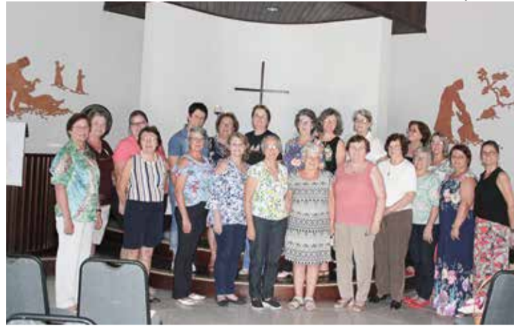
Escritoras e coordenadoras do programa em reunião em Rodeio 12.

Conversando com você, programa radiofônico criado e mantido pelas OASEs dos sinodos Vale do Itajaí e Centro-Sul Catarinense, completa 30 anos. Este é talvez o programa de comunicação mais longo na IECLB, é escrito por mulheres da OASE e transmitido por mais de uma dezena de emissoras pelo estado de Santa Catarina. “Ele chega aonde