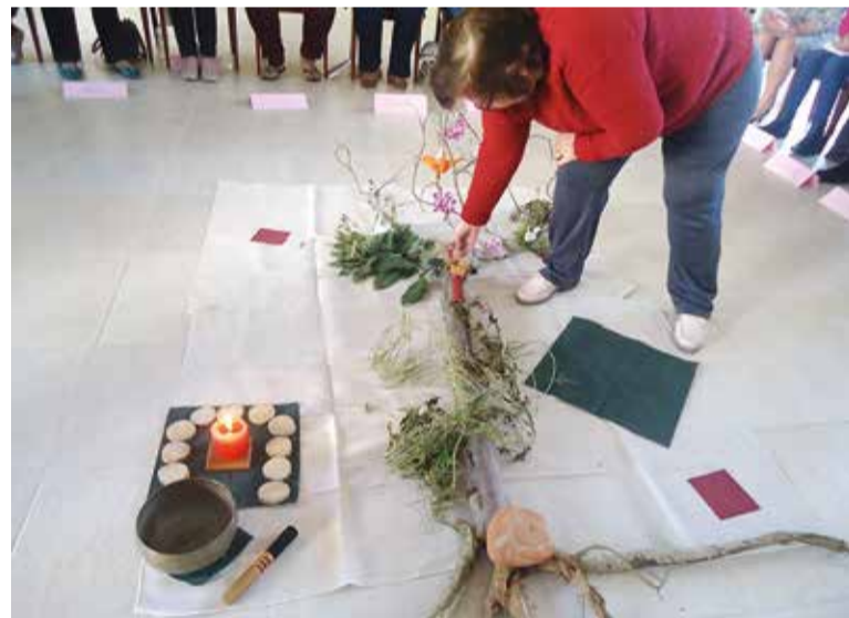
Momento de reflexão durante o curso em São Bento do Sul.