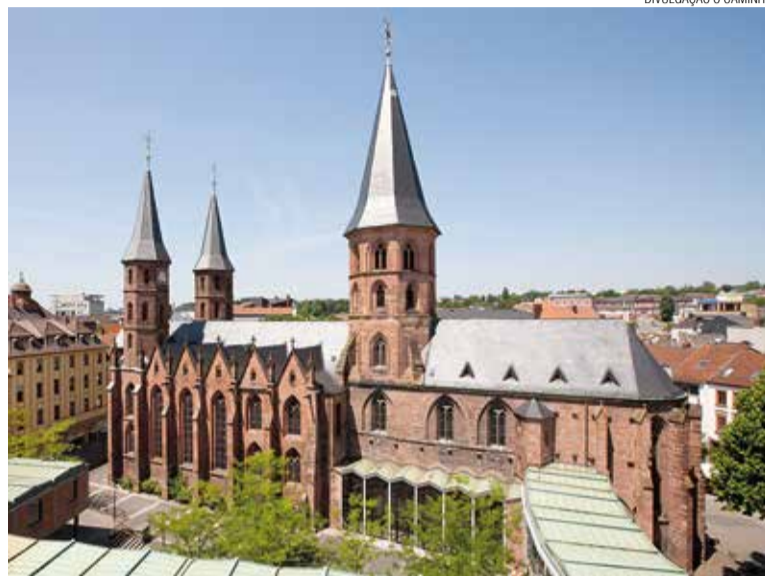
Na Stiftkirche em Kaiserslautern os pastores mais velhos das igrejas luterana e reformada celebraram a Eucaristia em conjunto para sinalizar a união.

As celebrações dos 300 anos da Reforma em 1817 ajudaram na decisão. Os festejos comuns do jubileu fizeram com que, de outubro de 1817 a março de 1818, metade das comunidades luteranas e reformadas da região se fundissem em cerca de 80 uniões paroquiais informais. Outro motivo eram os muitos casamentos mistos. Era comum que a mãe ia ao culto com as meninas numa denominação e o pai com os meninos em outra.