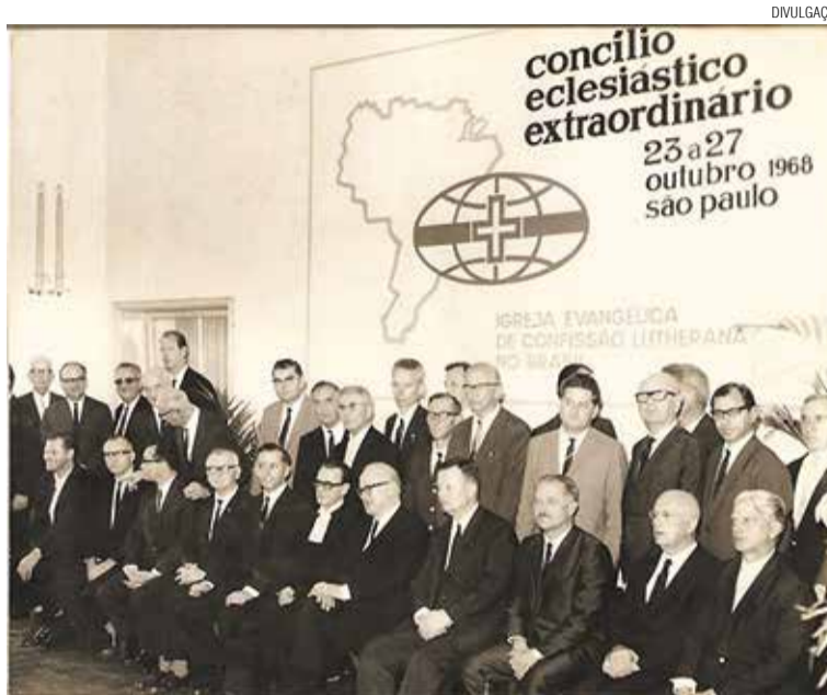
Foto histórica dos conciliares de 1968 em Santo Amaro/SP.

Ações conjuntas por parte de comunidades e sínodos já haviam sido implementadas previamente. Cabe chamar atenção para o trabalho intenso de formação na área da Juventude Evangélica (Escolas de Líderes) e com estudantes universitários, apoio à Ordem Auxiliadora de Senhoras Evangélicas (OASE), Música Sacra e Educação (Escolas Evangélicas), implementação