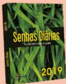
SENHAS DIÁRIAS 2019 Textos bíblicos e orações

O Castelo Forte 2019 traz 365 mensagens para alegrar e motivar seus dias em 2019! Usufrua da "fonte de água que dará vida eterna" e seja uma bênção para muitas pessoas!