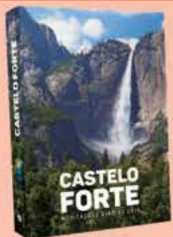
CASTELO FORTE 2019 MEDITAÇÕES DIÁRIAS

O Castelo Forte 2019 traz 365 mensagens para alegrar e motivar seus dias em 2019! Usufrua da "fonte de água que dará vida eterna" e seja uma bênção para muitas pessoas!