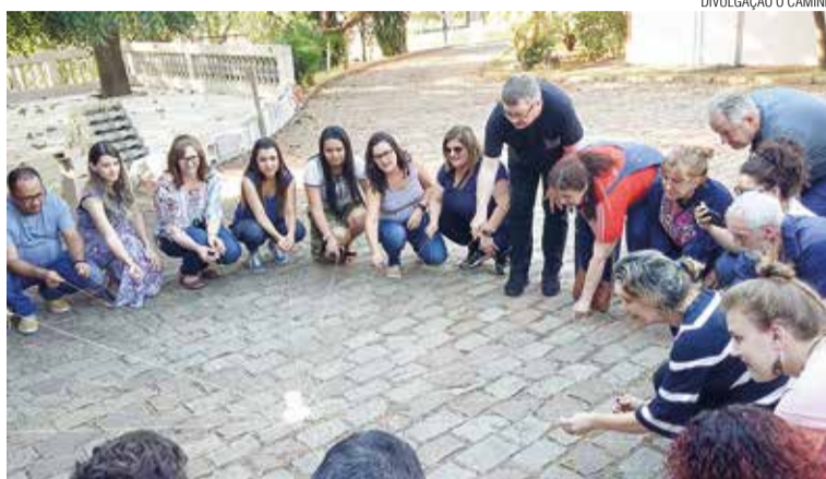
Clima celebrativo diário marcou o curso sobre Diaconia em Campinas.