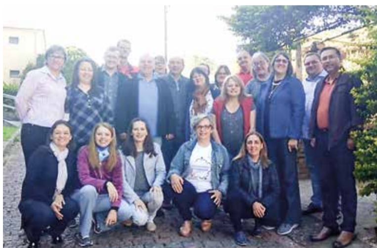
O Conselho Nacional de Educação Cristã Contínua da IECLB é integrado por representantes dos 18 sínodos e pela equipe da ECC na Secretaria de Ação Comunitária.

Atendendo a um pedido de tempo para a formação vindo do próprio Conecc, ainda no período da manhã,