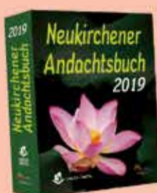
NEUKIRCHENER ANDACHTSBUCH 2019

Com um versículo do Antigo Testamento e um do Novo Testamento, as Senhas Diárias trazem também uma estrofe de um hino ou uma oração, provenientes da rica tradição da igreja cristã.