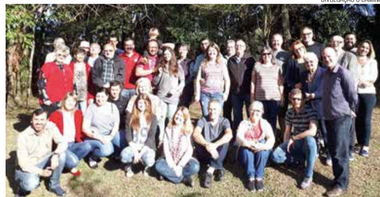
Lideranças da Cristo Salvador de Curitiba que estiveram no encontro.

As lideranças se dividiram em grupos de trabalho desafiados a encontrar-se e realizar as ações, direcionando o trabalho para a missão da igreja, que é propagar o Evangelho de Jesus Cristo.