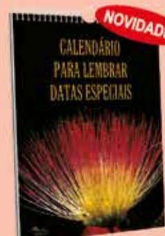
CALENDÁRIO PARA LEMBRAR DATAS ESPECIAIS

O Roteiro da OASE traz meditações com novas temáticas a cada mês, estudos bíblicos, reflexões e dinâmicas de grupo.