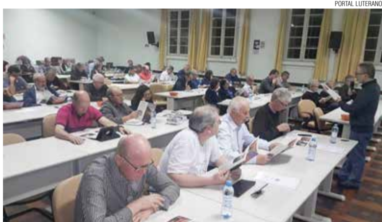
A reunião foi de avaliação da gestão e de preparação do Concílio.