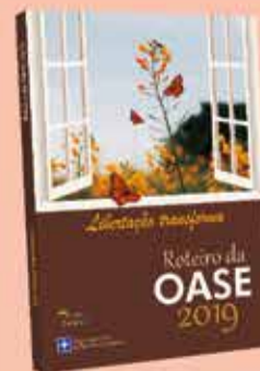
ROTEIRO DA OASE 2019 - Libertação transforma

Este devocionário em língua alemã apresenta uma palavra bíblica para cada dia do ano e uma meditação sobre esta passagem, com reflexões que animam, confortam e orientam.