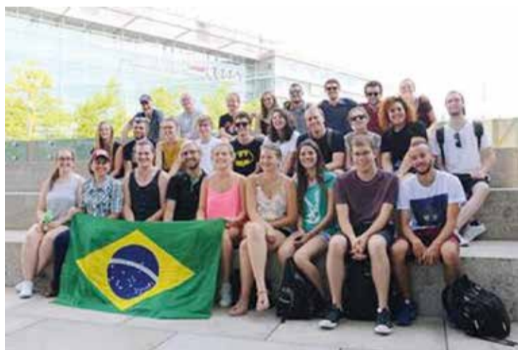
O grupo de jovens brasileiros esteve na Alemanha por três semanas e teve intensa troca de experiências com um grupo de jovens da Baviera.

Por meio da intensa convivência, seja na casa de retiros onde os jovens ficaram hospedados nos primeiros dias, na viagem a Berlim e Wittenberg, ou no tempo hospedado na casa dos jovens alemães, amizades foram formadas. Agora ficamos na saudade dos amigos que ficaram do outro lado do Atlântico, na expectativa do reencontro, em 2019, dessa vez com o grupo alemão viajando ao Brasil.