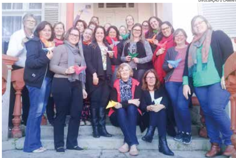
As secretárias conviveram, refletiram e discutiram temas do dia a dia.

Outro tema abordado foi “cuidar ou ser cuidada”, que refletiu sobre o