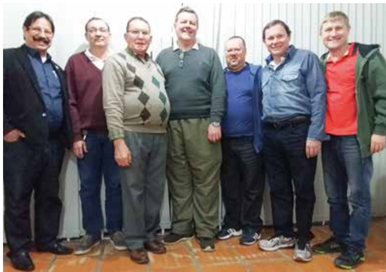
Integrantes da coordenação nacional da Lelut.

Cada coordenador trouxe uma análise SWOT (Pontos Fortes, Pontos Fracos, Oportunidades e Ameaças) da sua coordenação. O compartilhamento de experiências por toda a IECLB mostrou uma riqueza de trabalhos e ações sendo realizados pelos núcleos.