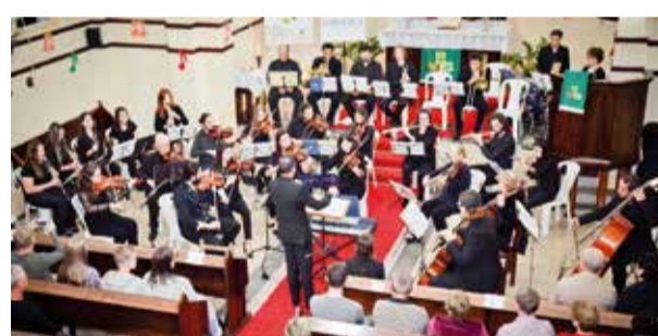
Orquestra da FURB apresentou Concertos Itinerantes.