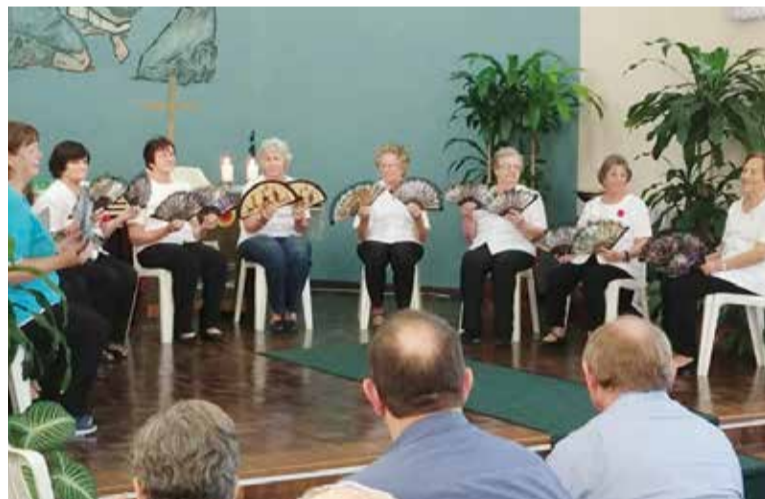
O grupo de Dança Sênior apresentou-se durante o encontro de Pastoral do Idoso do Núcleo Joinville, na Cristo Redentor.

A palmeira é uma árvore altamente resistente ao solo seco e árido. É uma árvore que resiste de modo bastante interessante às fortes rajadas de vento, tão frequentes nas regiões do Oriente. Ela curva-se de