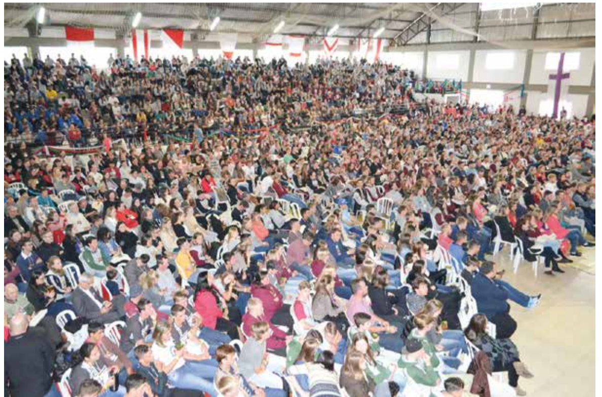
A beleza da diversidade jovem da IECLB reunida na quadra coberta da Cooperativa Languiru (acima) e durante a marcha da juventude na cidade.