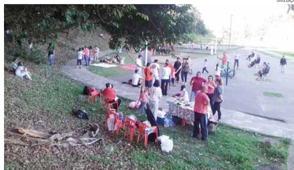
Associação Criança em Primeiro Lugar fez um dia na praça, na Itoupava Central-Blumenau.

No dia 11 de agosto, véspera do dia dos pais, a Associação Criança em Primeiro Lugar - ACPL reuniu mais de 100 pessoas na Praça Nº 1, no coração do bairro Itoupava Central - Blumenau. Esta iniciativa visou divulgar os trabalhos da instituição, bem como promover uma tarde de integração entre as crianças, adolescentes, suas famílias e a comunidade. Cada família foi convidada a trazer algum alimento para uma partilha, e inclusive aqueles que não trouxeram, além de outros visitantes da praça, foram todos integrados na partilha, nas brincadeiras e vivências. Teve roda de capoeira, pintura facial, contação de histórias, música, várias