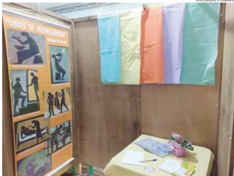
Em vários ambientes, a tenda vai discorrendo sobre misericórdia.

A Tenda da Misericórdia é um projeto da Diaconia do Sínodo Nordeste Gaúcho e marcou presença no 24º CONGRENAGE, em Teutônia/RS. A tenda tinha tudo a ver com o tema Vida Digna , baseado em Mateus 25.35-36 que fala das obras de misericórdia de Jesus. A tenda ficou aberta à visitação durante toda semana. Já nos dois primeiros dias