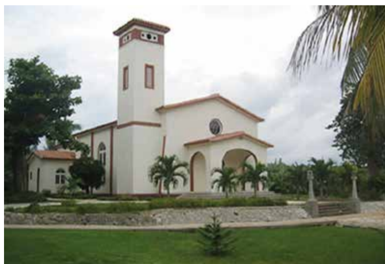
Capela do Seminário Evangélico de Matanzas, onde foi o encontro.

"Comprometemo-nos a promover uma diaconia fundamentada nos pilares bíblico-teológicos libertadores e contextuais, que também compartilhas os