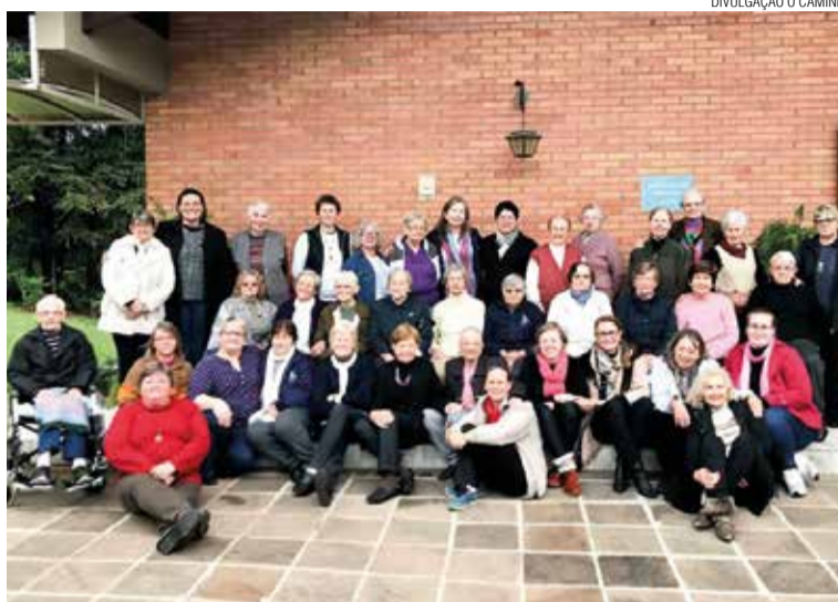
As participantes da convenção da Irmandade na Casa Matriz.