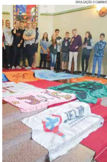
As bandeiras dos grupos tremularam.