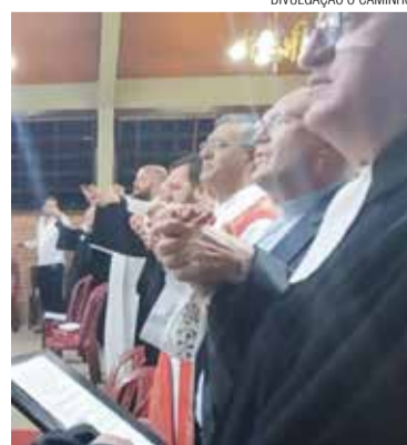
Luteranos e católicos concelebraram

Para um encontro em que a teologia cristã e o amor do Pai foram colocados acima das diferenças de religiões ou igrejas, os presentes confessaram a sua fé em uma única voz. Em seguida, e em consonância ao compromisso expresso na DCDJ, todos cantaram “Somos gente da esperança!”. ●