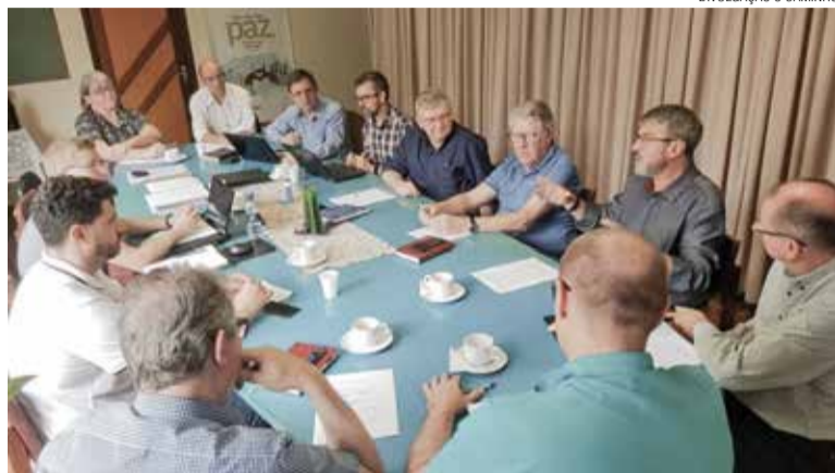
As diretorias e os pastores sinodais participaram do encontro.

Dentre os assuntos dialogados esteve a reflexão acerca da conjuntura atual da igreja, especialmente a estrutura organizacional e sua funcionalidade. A atual estrutura organizacional engloba ampla representação sinodal nos inúmeros conselhos, além de inúmeros grupos de trabalho existentes, o que tem grande custo financeiro e nem sempre significa partici-