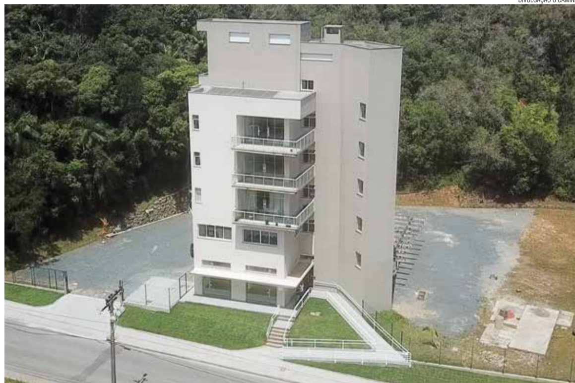
O edifício abriga a sede sinodal e três apartamentos, para sinodal, assessor e pastor da paróquia Fortaleza.