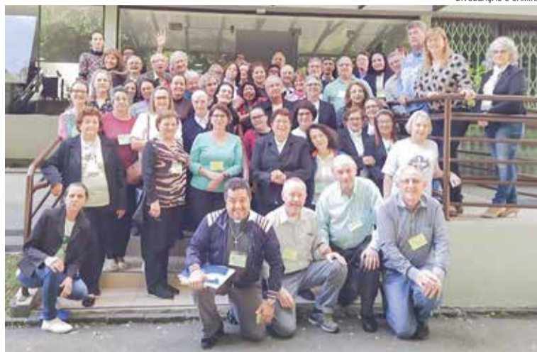
Participantes ecumênicos do congresso de capelania hospitalar.

Através das palestras e oficinas refletiu-se que a principal