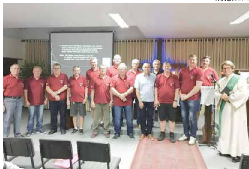
A reflexão sobre o cuidado com a saúde masculina partiu da Bíblia.

O grupo de homens (LELUT) da Paróquia Apóstolo João em Jaraguá do Sul reuniu-se em culto no dia 2 de novembro para celebrar a campanha Novembro Azul – O cuidado com o corpo do homem . O grupo e a comunidade reunida refletiram que cada pessoa é uma bela criação de Deus, feita com zelo, amor e sonhos. Da mesma forma que um pai ou uma mãe se preocupam com seu filho ou filha, Deus também se preocupa conosco. Esta preocupação está também no cuidar de nossos corpos, porque nosso corpo é santuário do Espírito Santo (1 Co 6.19s). Por isso, cuidar do corpo é um testemunho de fé em Deus; é dizer sim para o amor de Deus. Sabe-se que nem sempre os homens estão dispostos a cuidar de forma contínua