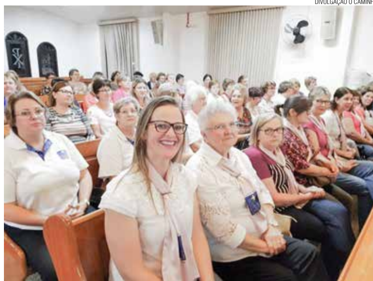
Por questões profissionais e familiares, os horários normais das reuniões da OASE tornam-se um impedimento para essas mulheres.