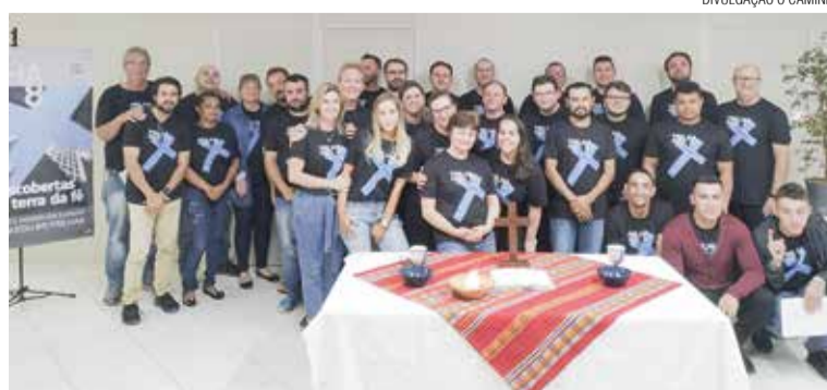
Um grupode 35 funcionários participou do curso Trilha8 na HAR Têxtil.

lhor motivação que um ser humano pode ter é saber que Deus nos ama e, através de Jesus, ele