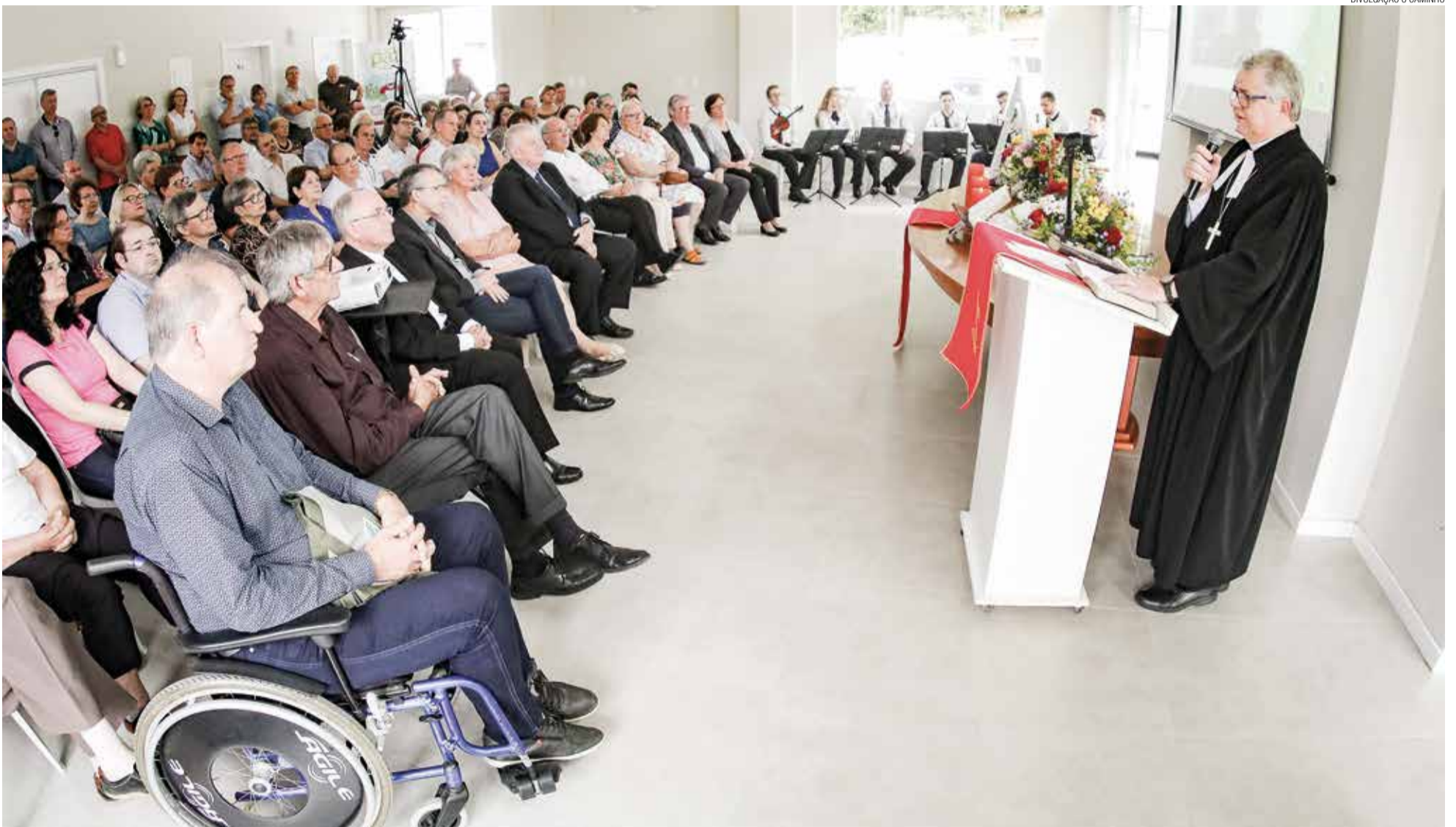
Autoridades ecumênicas e lideranças municipais estiveram na inauguração do novo espaço que abrigará a sede sinodal do Sínodo Vale do Itajaí, em Blumenau. Página 3