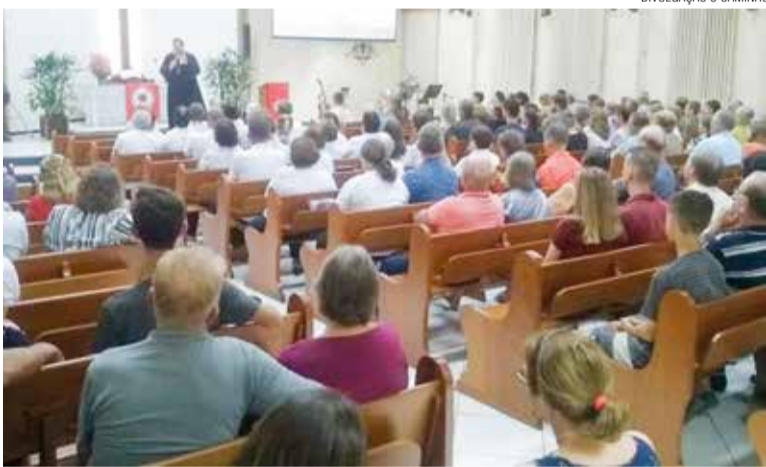
DIVULGAÇÃO O CAMINHO

As comunidades que compõem a União Paroquial Dona Francisca reuniram-se no dia 31 de outubro para celebrar os 502 anos da Reforma. Dessa vez, o evento aconteceu na comunidade Estrada do Oeste, na paróquia Rio Bonito, em Joinville/SC.