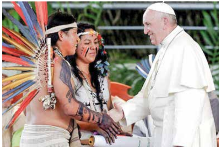
O sínodo propõe uma igreja missionária, voltada para a Amazônia.

O terceiro aspecto é a exagerada polêmica ambien-