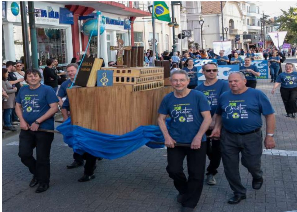
140 pessoas participaram da festividade, quando apresentaram a IECLB para a sociedade

Por volta das 9h30min diversos grupos percorreram a rua 15 de Novembro, via central da cidade, sob aplausos, música e um sol que amenizou o frio nessa reta final do inverno. Entre os