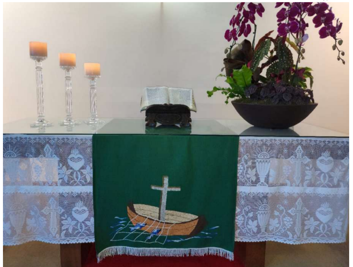
Comunidade luterana é espaço de restauração na presença cuidadora do Cristo crucificado e ressurreto

de Deus” num determinado lugar, tempo e espaço. Por isto, a interpretação da palavra é a tarefa primordial da comunidade luterana. Carregamos a palavra criadora e salvadora, que necessita contextualizar-se de forma adequada e responsável. Esta é uma tarefa comunitária, também e especialmente, daqueles e daquelas que assumiram funções de liderança, seja pessoa ordenada ou não.