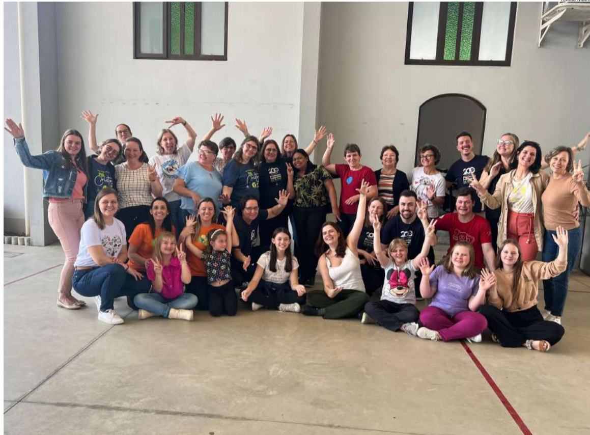
O programa oferece uma série de músicas inéditas e formas lúdicas para trabalhar com crianças na IECLB

O livro didático apresentado está dividido em três partes: a primeira parte contém reflexões sobre a importância da educação cristã e a música no trabalho com as crianças na Igreja. A segunda parte traz propostas metodológicas para trabalhar as canções com as crianças. Por fim, na terceira