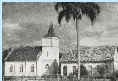
Comunidade Evangélica Luterana da Ressurreição na Estrada da Ilha