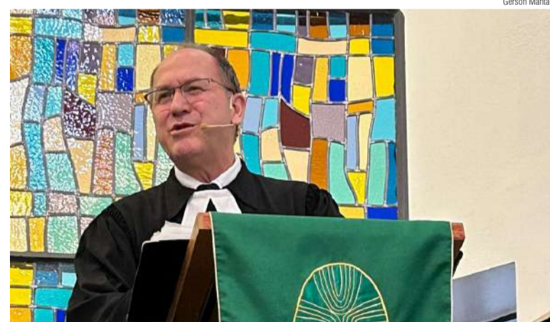
O culto aconteceu na Comunidade Gustavo Adolfo em Blumenau

A Paróquia da Itoupava Central é formada pelas comunidades da Itoupava Central, Rio Bonito e Tatutiba I. Está localizada na região norte da cidade de Blumenau/SC.