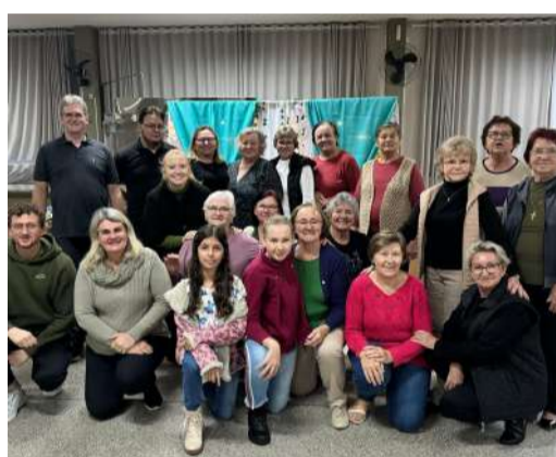
Grupo de Canto Alegria em Cristo completa 15 anos