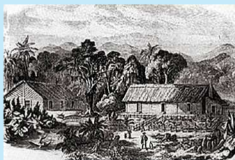
Primeira vista de Joinville (Desenho de 1850)

A colonização da região de Joinville foi iniciada pelo projeto de colonização liderado pelo senador alemão Christian Matthias Schroeder, dono da Sociedade Colonizadora Hamburguesa. As terras eram de Dona Francisca, irmã de Dom Pedro II, que recebera como dote em seu casamento com Francisco de Orleans, Príncipe de Joinville, filho do rei francês Luís Filipe I. Em 09/03/1851 chegaram 75 suíços e 43 alemães, que se estabeleceram na região de Joinville. Logo no início havia médico, parteira e farmacêutico.