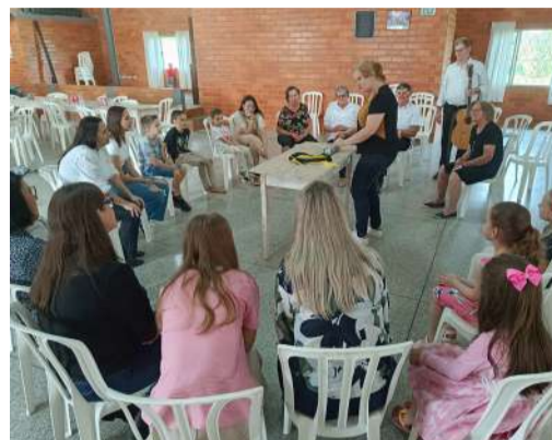
Comunidade da Paz celebra 200 anos de Presença Luterana com atividades para todas as idades