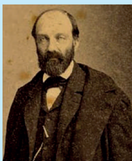
Príncipe de Joinville