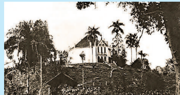
Igreja do Espírito Santo, inaugurada em 1877

Em 1864 foi construída a primeira igreja no Vale do Itajaí, na localidade de Badenfurt, feita com troncos e coberta de folhas de palmeiro. No local improvisado, o Pastor Hesse celebrava cultos e casamentos. Em 1868 iniciou a construção da Igreja do Espírito Santo, inaugurada por Hesse em 1877. A obra foi doação do Imperador Dom Pedro II.