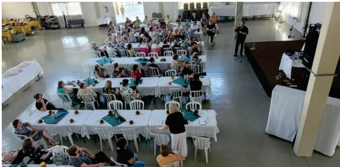
200 anos de fé, esperança e amor foi tema de encontro regional de mulheres na cidade de Curitiba/PR

Abordando o livro de Atos dos Apóstolos, P. Pedro enfatizou o sopro do Espírito Santo sobre as pessoas. Movidas pelo Espírito Santo pessoas se encheram de coragem, confiança e ousadia para testemunhar em palavras e ações a vontade de