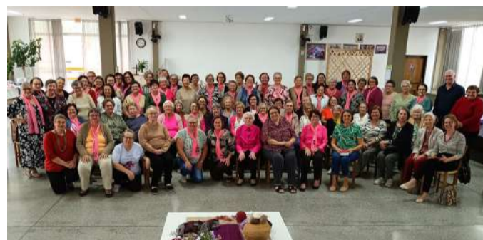
Grupos OASE Orquídea e OASE de Garcia Blumenau promovem encontro de integração