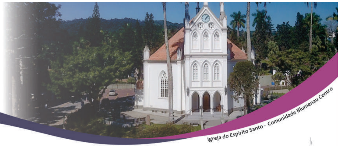
Igreja do Espírito Santo - Comunidade Blumenau Centro