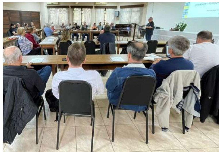
A formação de ministros e ministras são prioridade no Vale do Itajaí

várias equipes de pessoas. Muitos homens e mulheres foram envolvidos, de pessoas simples a pessoas poderosas, também os próprios sacerdotes. É o sacerdócio geral como método da vitalidade e crescimento.