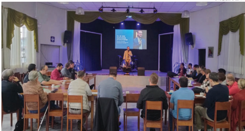
Divulgação O Caminho

De forma dialogal, foram apontadas virtudes e falhas no uso das mídias sociais. Dentre as falhas, o professor apontou a ideia de que é “só postar