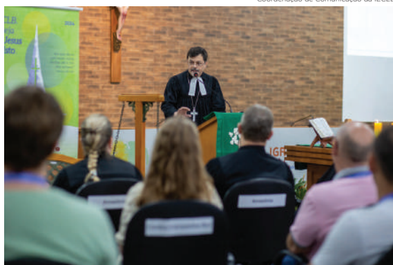
Todos os dias aconteceram cultos que abriram ou encerraram a agenda

A plenária do Concílio da Igreja foi palco de reflexões desafiadoras e encorajadoras na manhã do dia 18. Um grupo de seis pessoas formou um painel para refletir sobre o tema: Que Igreja Deus nos chama a ser? Cada painelistra trouxe considerações e impulsos para a missão a partir da sua respectiva área de atuação na IECLB.