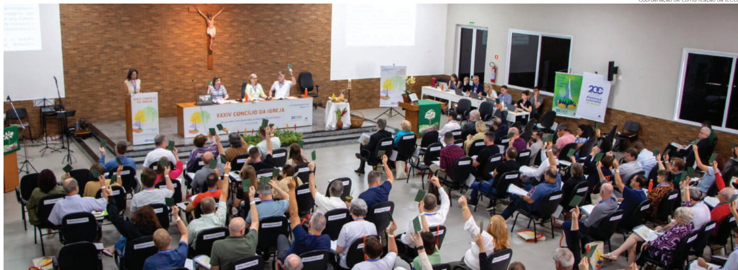
O Concílio da Igreja é um espaço de reflexão, debates e decisões. Representantes dos 18 sínodos, de ministros e ministras e setores e centros de formação se reúnem a cada dois anos