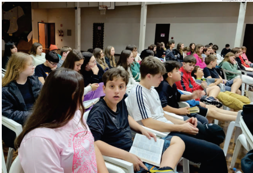
Atividades com confirmandos e confirmandas são destaque entre as programações do Sínodo Paranapanema