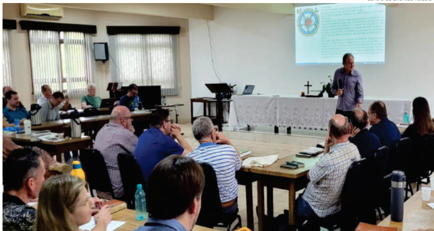
A temática já aconteceu no primeiro semestre com outros temas. A conferência encerrou as atividades do ano

“A nossa vida hoje é diferente da vida da época de Lutero; os desafios são outros, o contexto é outro; sofremos