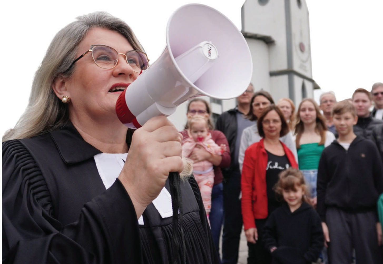
Coordenação de Comunicação da IECLB