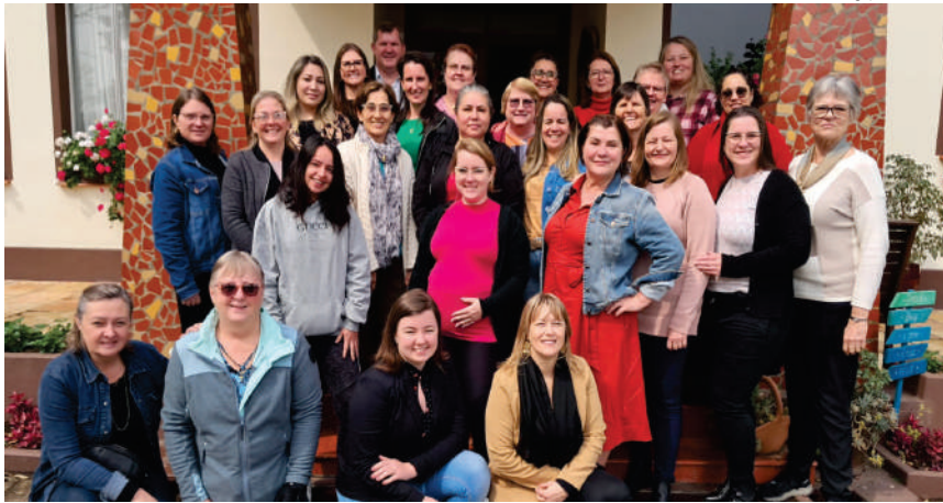
Divulgação O Caminho

O fortalecimento e as conexões entre as pessoas que atuam nas secretarias foi o objetivo do programa