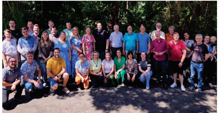
Ministros e ministras discutem temas importantes para o dia a dia das comunidades e paróquias