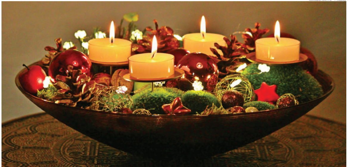
Cocoparisienne - Pixabay

Hino - LC 402 – Vem à luz, alegremen- te! (lido e/ou cantado)