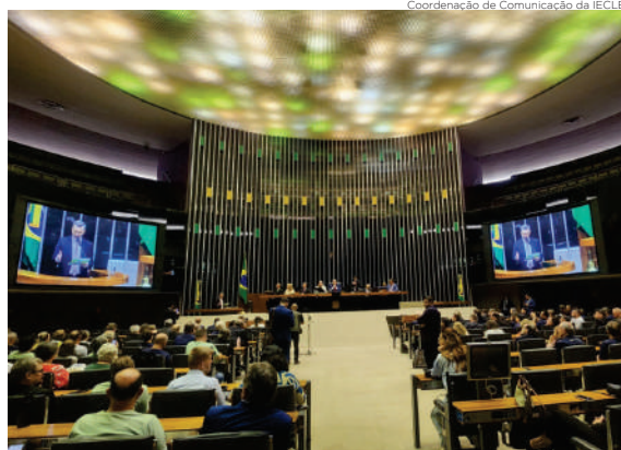
Coordenação de Comunicação da IECLB

A fé na perspectiva luterana é promotora da paz, da justiça, da solidariedade e do amor. Estes princípios, vivenciados ao longo de dois séculos no Brasil, também foram enfatizados nos discursos.