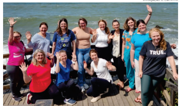
Ministras têm programas de fortalecimento do Ministério Feminino

A intenção é fortalecer a integração entre ministras e, assim, continuar a fortalecer o Ministério Feminino no âmbito da Igreja. “Precisamos de momentos onde podemos estar juntas, saindo da solidão que o ministério tantas vezes nos impõe”, afirmou uma participante.