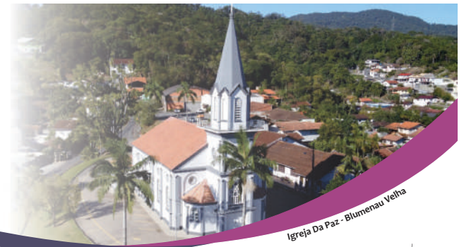
Igreja Da Paz - Blumenau Velha