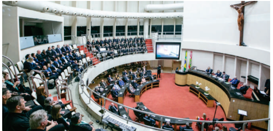
A noite de homenagens fechou o calendário oficial dos 200 anos de Presença Luterna no Brasil