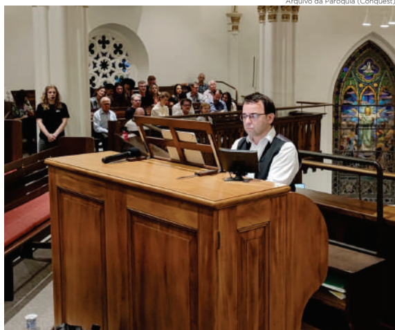
A programação semanal pode ser vista em https://www.luteranosblumenau.com.br/#concertos

A igreja, desde 2023, tem o projeto da Igreja aberta com concertos semanais. Todo sábado uma equipe acolhe e proporciona visita guiada na igreja, na qual a história, detalhes arquitetônicos e artísticos são mostrados e explicados. Em cada sábado há também meia hora de concerto, com boa música sacra e ou profana.