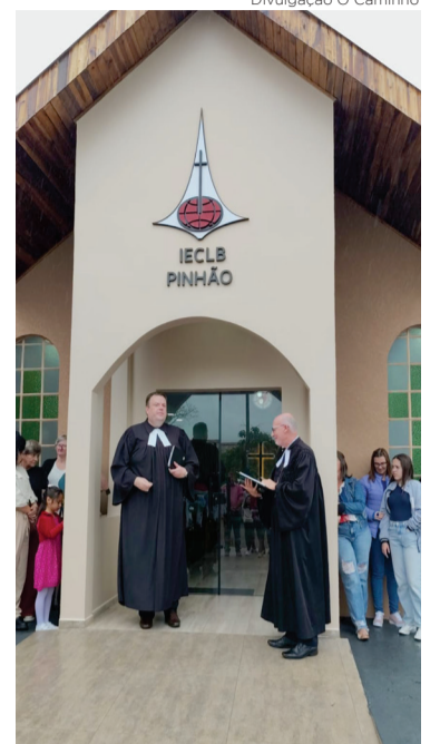
Divulgação O Caminho