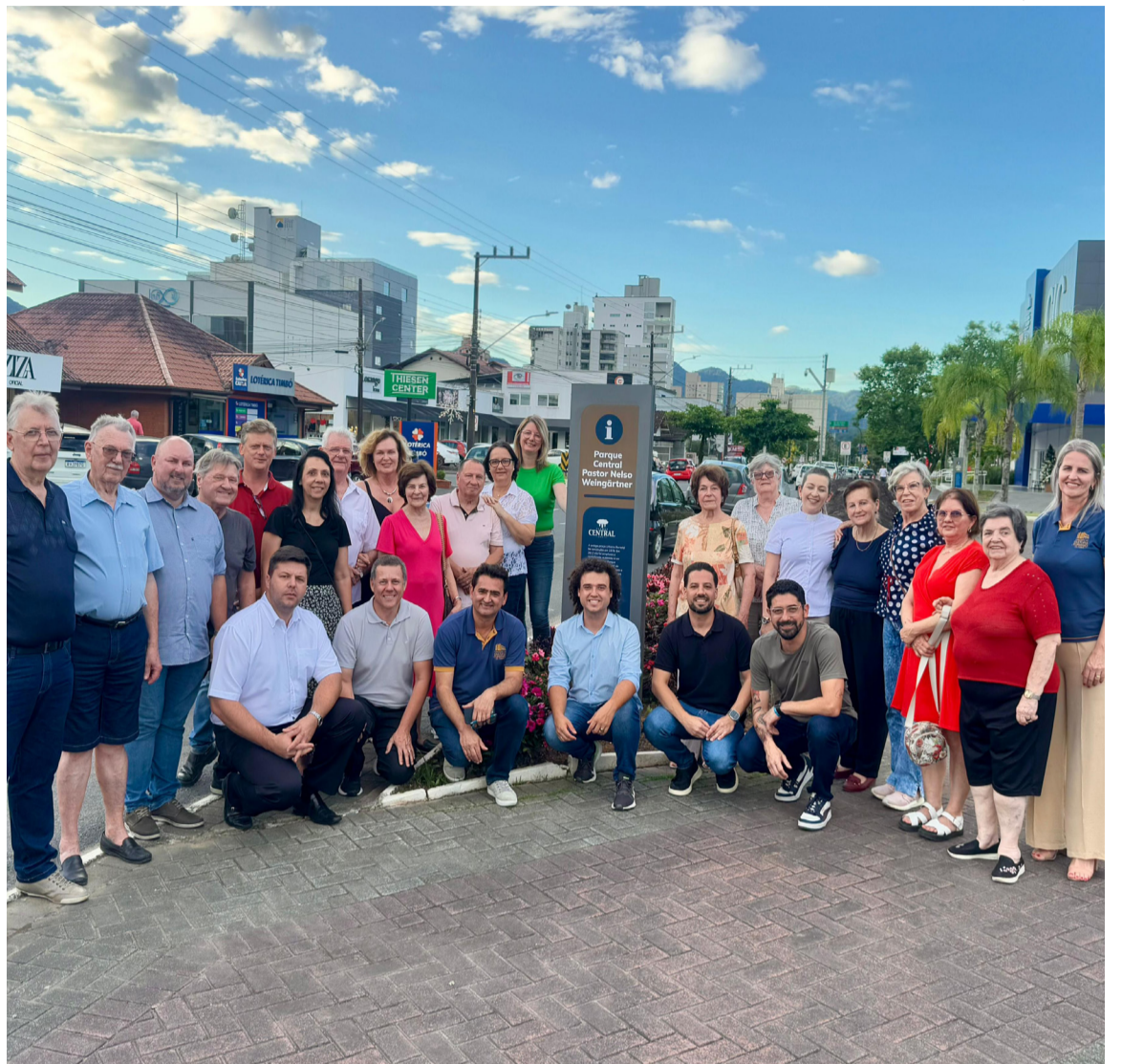
O Parque Central é um dos principais pontos de encontro para práticas de lazer e manifestações culturais

do padre Martinho Stein, na consumação dos primeiros casamentos ecumênicos de Santa Catarina, primeiro culto ecumênico do Estado feito na inauguração do Pavilhão Municipal. Ainda foi um dos protagonistas no lançamento da pedra fundamental para construção da atual Igreja da Ressurreição, Comunidade Cristo Redentor.