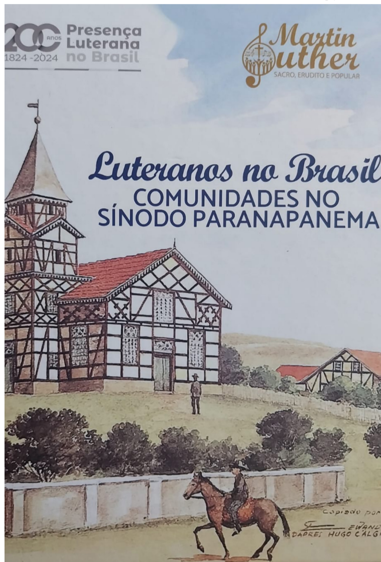
Comunidades, paróquias e instituições receberam o material para leitura

Em 2024 foram comemorados os 200 anos de Presença Luterana no Brasil, isto é, desde o surgimento das primeiras comunidades fundadas em Nova Friburgo, no Rio de Janeiro, e São Leopoldo, no Rio Grande do Sul. No Sínodo Paranapanema ainda não existem comunidades com 200 anos, a mais antiga completa 159 neste ano, mas o motivo da celebração e gratidão é como Igreja. “Uma Igreja com comunidades bicentenárias, e muitas mais que centenárias não se mantém por forças próprias, é sem dúvida a presença divina, através de pessoas, que possibilita tamanha graça”.