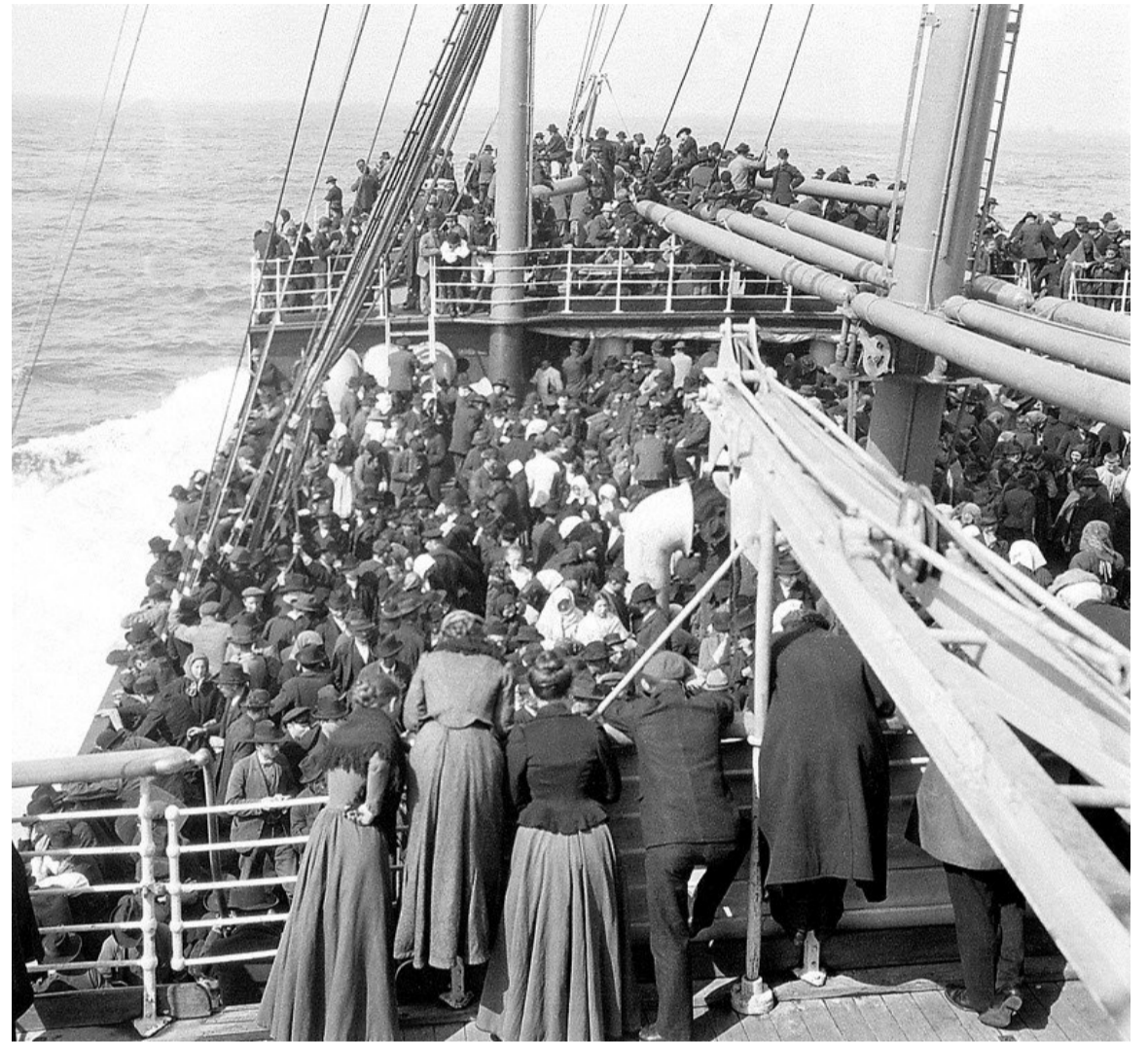
Historicamente, o Brasil é um país que recebe imigrantes de todos os continentes, impactando social e culturalmente na sociedade

O modelo de civilização era a Europa - França, Inglaterra, Alemanha, Bélgica (os países ibéricos não eram vistos na mesma ótica). Lá reinava a civilização, aqui, a barbárie. Era necessário colocar os estados latinoamericanos na rota da civilização, portanto, trazer “gente civilizada”. O que havia aqui? Índigenas, negros, caboclos, caipiras (matutos, mocorongos) e com este “tipo de gente” não se construiria um estado moderno e civilizado. Dito de forma bem resumida: o desprezo foi a marca.