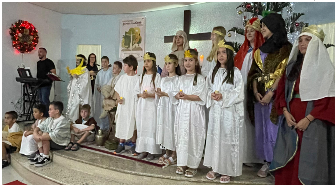
Crianças e adolescentes também demonstraram gratidão e celebraram o Advento no culto festivo de dedicação do sino

“Estamos dedicando um sino para que ele nos lembre, em alto e bom som, do nosso compromisso com Deus e com as pessoas da comunidade. Este sonho se realiza hoje, graças a generosidade e abnegação de alguém muito especial e abençoado. Além de nos