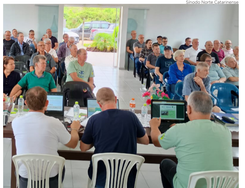
O Conselho Sinodal é o órgão deliberativo do Sínodo para discutir Missão

O propósito é alcançar o efetivo comprometimento de comunidades, paróquias, ministras, ministros e lideranças com as Metas estabelecidas em Concílio. A partir desse planejamento, o Sínodo estará como suporte para que a missão de Deus seja cada vez mais eficaz. Tem-se em vista o crescimento integral, com um testemunho de qualidade com o alcance quantitativo de mais pessoas.