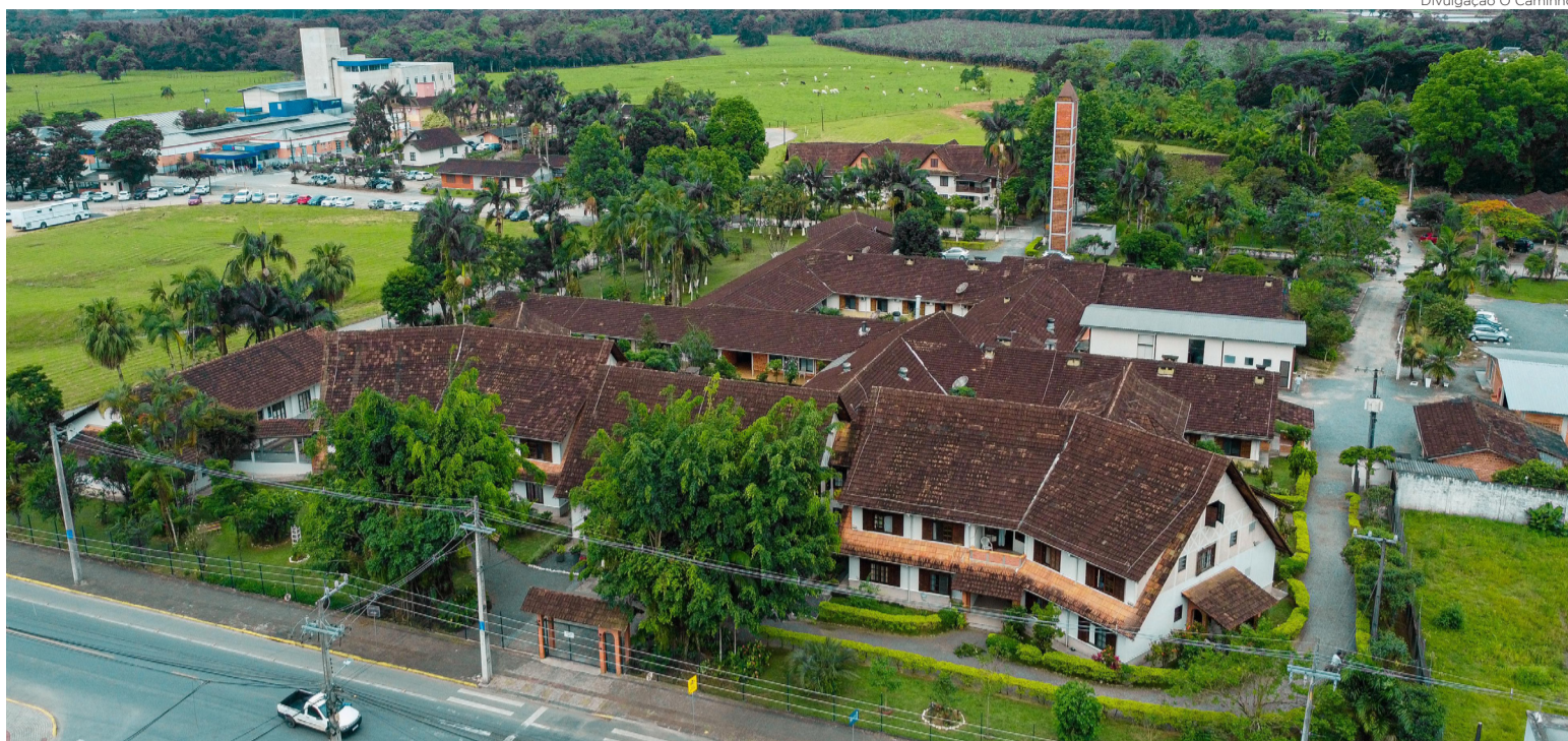
Em Joinville, no Distrito de Pirabeiraba, uma estrutura foi erguida por muitas mãos com foco no cuidado e na dignidade da vida humana