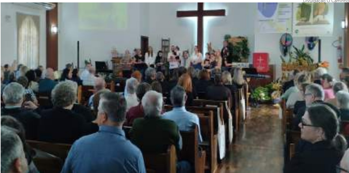
Mais de 300 pessoas louvaram a Deus por todo o seu cuidado, sustento e direção nesses 130 anos