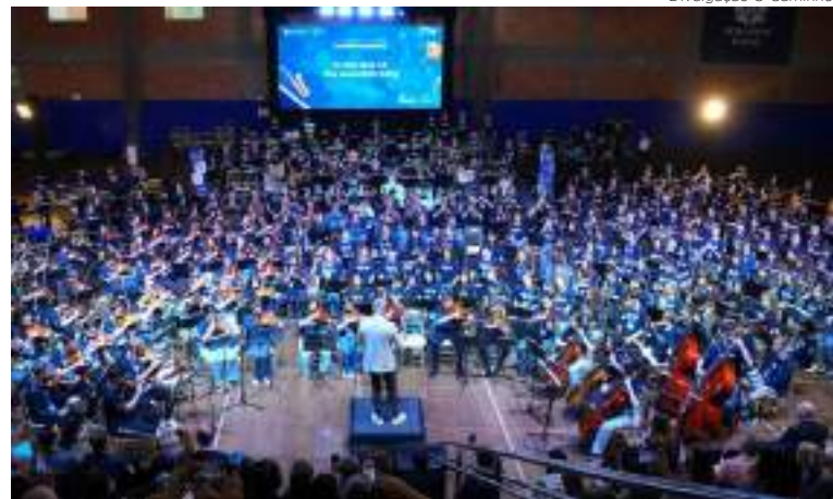
Divulgação O Caminho

O 43º ENCORE reafirmou sua essência como elo entre escolas, corações e histórias traduzindo na música a identidade da Rede Sinodal