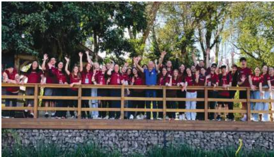
O movimento jovem na IECLB propõe uma série de pautas de engajamento social e protagonismo da juventude

Uma das participantes definiu assim a sua experiência: “Minha primeira vez no CONGRENAGE foi como um abraço direto de Deus no meu coração.