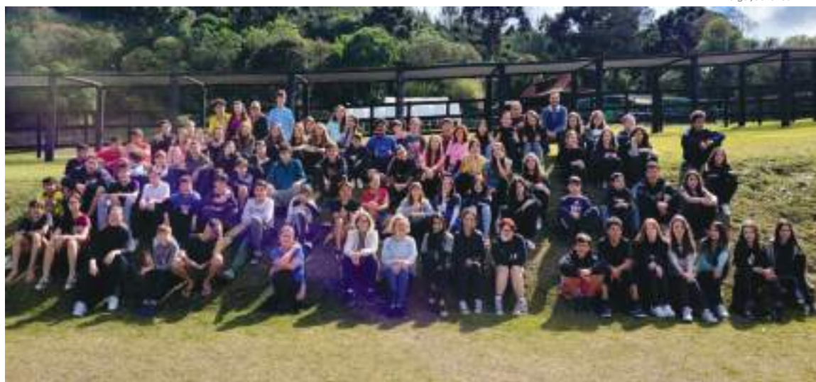
Os meses de julho e agosto foram intensos no Paranapanema com atividades para adolescentes e jovens