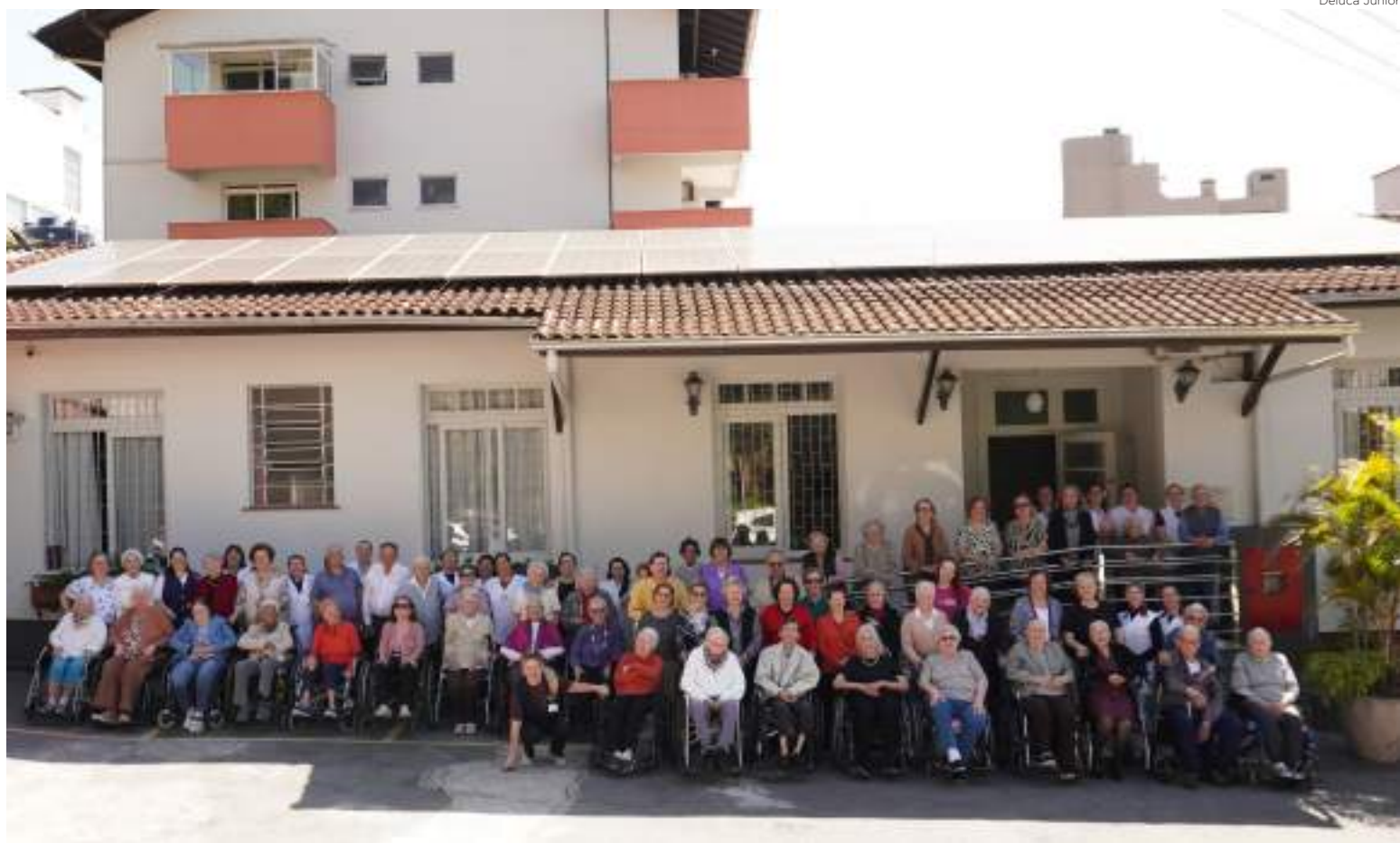
A Sociedade Evangélica de Senhoras de Blumenau tem uma bonita história de amor e engajamento pela vida digna das pessoas