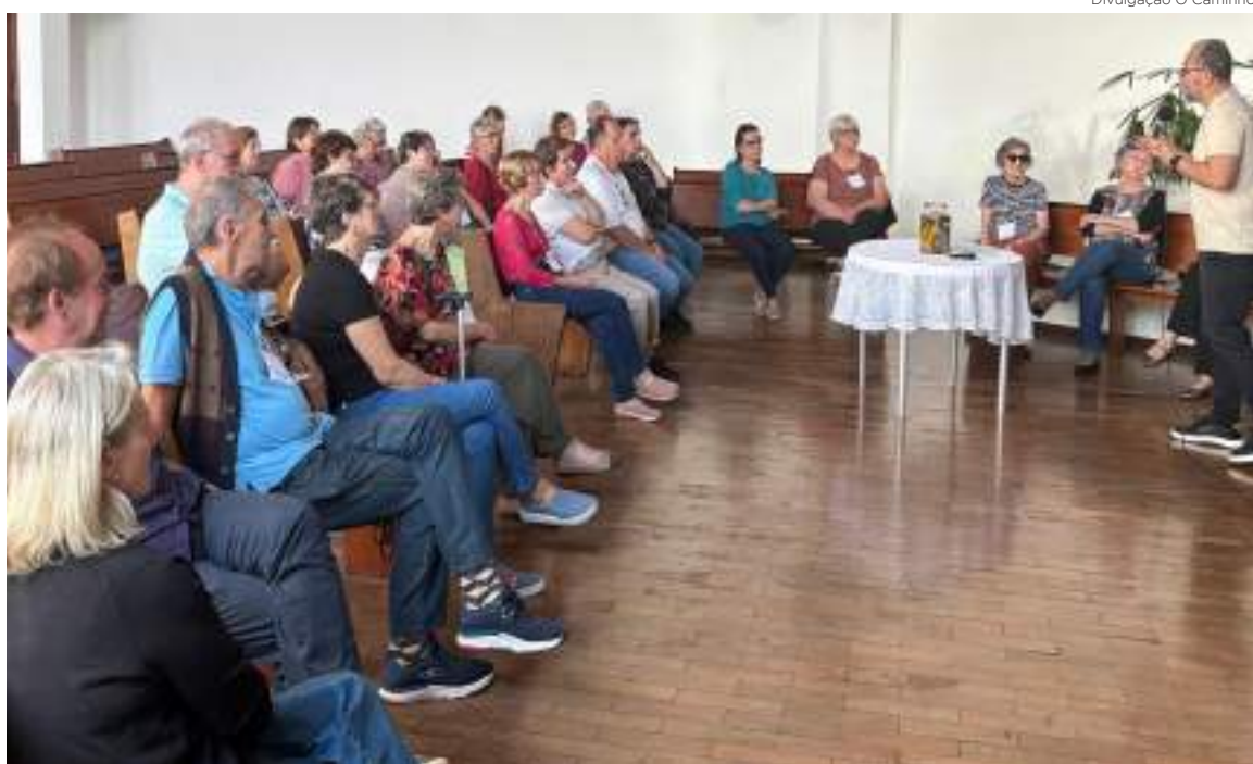
Pessoa idosa ativa na missão: encontros, desencontros e perspectivas foi tema de encontro

Dentre os desafios destacou-se: a pouca interação das famílias e da sociedade com a pessoa idosa; os riscos de golpes financeiros, especialmente, por meios eletrônicos; o desrespeito e a violência no trânsito; o aumento das enfermidades neurológicas.