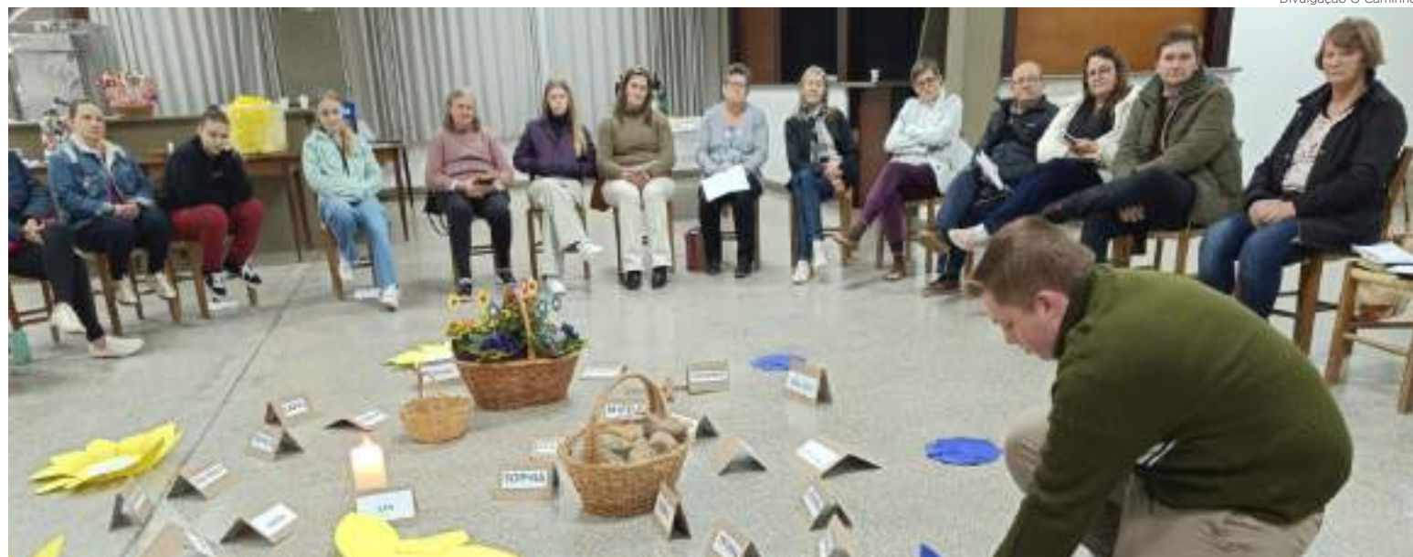
Divulgação: O Caminho

O curso de Fé Cenários da Vida se propõe a ser um espaço de alegria, acolhimento e crescimento espiritual onde cada pessoa aprende a viver melhor