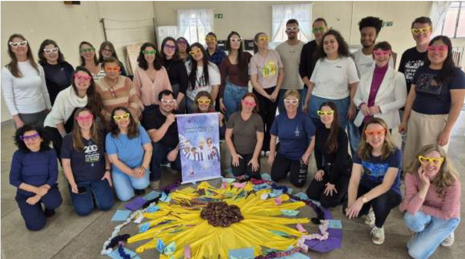
O programa busca ensinar e cantar 40 novas composições cristãs com crianças nas comunidades, de forma lúdica, criativa e amorosa

IECLB coloca à disposição de todos os sínodos, é fruto de uma semente lançada em outubro de 2023, quando um grupo de musicistas, reunidos na Comunidade Martin