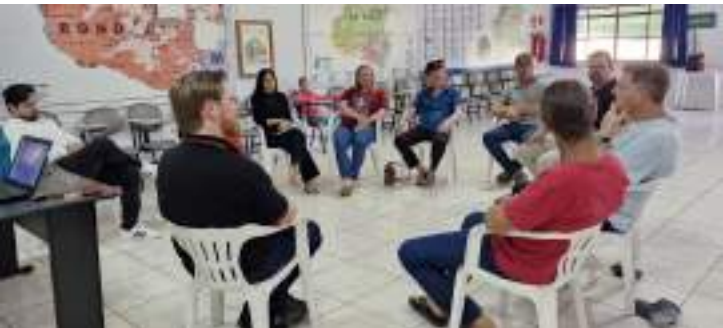
Divulgação O Caminho

bém promover os princípios do PAMI (Plano de Ação Missionária da IECLB), especialmente no que diz respeito à comunhão, solidariedade e corresponsabilidade entre comunidades. Além disso, contribui diretamente para o cumprimento de metas missionárias como fortalecer a presença pública da IECLB em diferentes contextos culturais e geográficos, promover a formação e o cuidado com lideranças, e ainda, estimular a vivência comunitária e o compromisso com a missão de Deus no mundo.