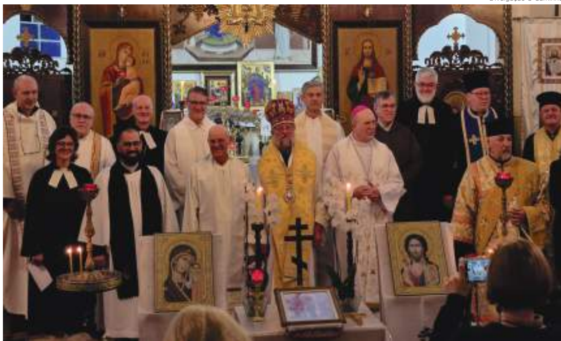
O ecumenismo incentiva o diálogo, o respeito mútuo e a cooperação entre as pessoas cristãs no mundo

Participaram do Concílio de Nicéia em torno de 318 bispos que tomaram algumas decisões importantes que valem ainda hoje. Por exemplo, que a Páscoa deveria ser celebrada no primeiro domingo após a primeira lua cheia, no início da primavera no hemisfério Norte, quando o dia e a noite têm o mesmo tempo de duração. Outra decisão importante foi afirmar que Jesus era da mesma substância do Pai, portanto, ele é da mesma essência divina de Deus e, por isso, Jesus pode redimir a humanidade do pecado. Em 381, o