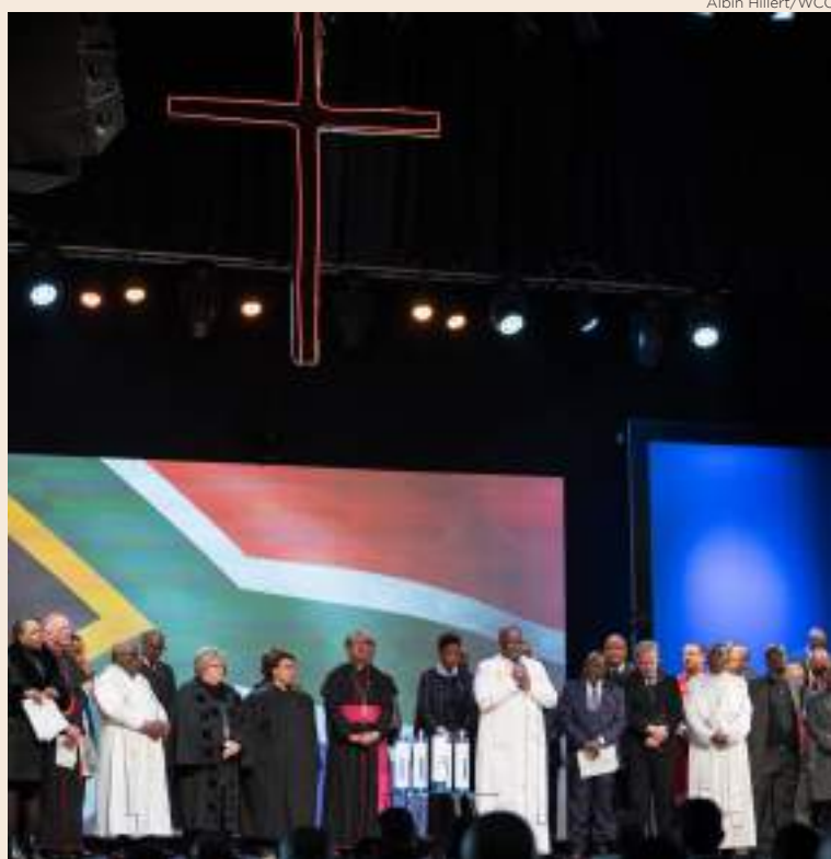
Foi possível experimentar a vivência da comunhão entre diferentes igrejas

A reunião aconteceu na África do Sul, a convite