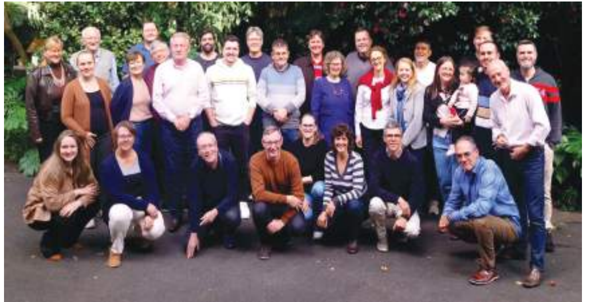
Anualmente o Sínodo oferece formação para aprofundamento teológico e comunhão entre ministros e ministras

No Fórum de Missão, realizado em abril de 2024, este foi um dos temas predominantes. “Como ser igreja diversa sem perder a identidade?” E aqui, pensa-