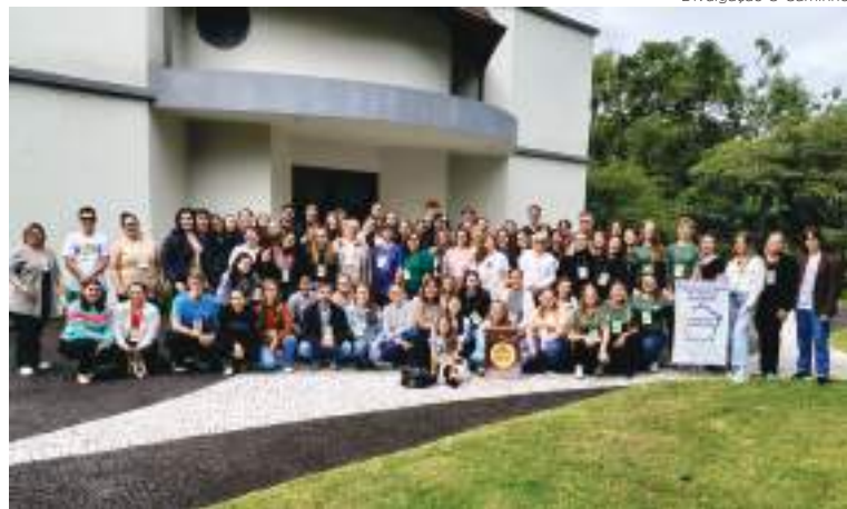
A formação de lideranças é uma prioridade prevista no Planejamento do Sínodo