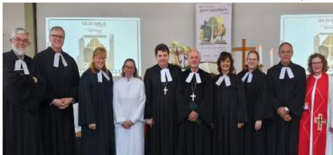
Dias da Igreja são espaços para reafirmar a caminhada de fé como povo de Deus e refletir sobre temas importantes

O domingo amanheceu chovendo e com bastante frio. Mesmo assim, cerca de 350 pessoas se encontraram na Comunidade Luterana da Cruz, em Curitiba, para o culto de ação de graças pela generosidade de Deus. Animados pelo grupo de metais e pelo coralão, com integrantes de vários corais comunitários, fomos desa-