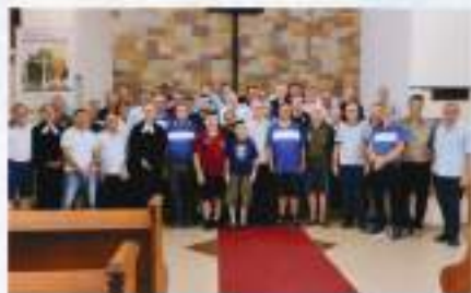
Assembleia Geral da Lelut Nacional, em Estrela/RS