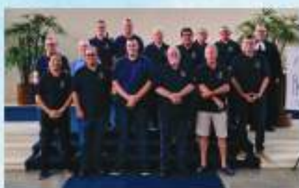
Instalação da Diretoria do Núcleo da Comunidade da Itoupava Seca, em Blumenau/SC.