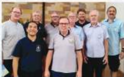
Comitiva do Vale do Itajaí na Assembleia Geral da Lelut