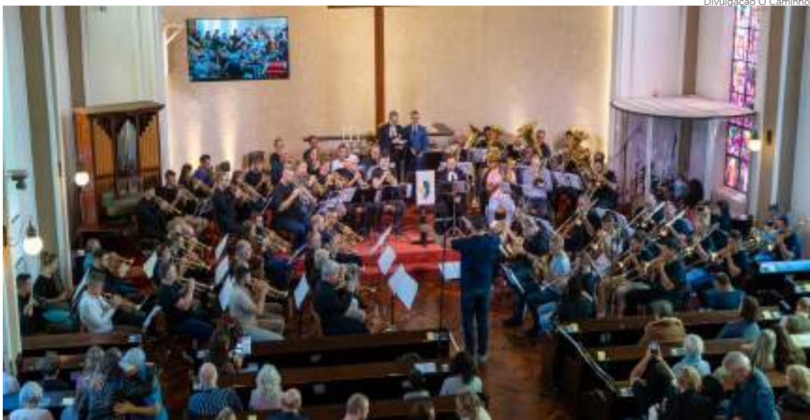
A Obra Missionária de Metais Acordai é uma organização vinculada à Comunhão Martin Lutero