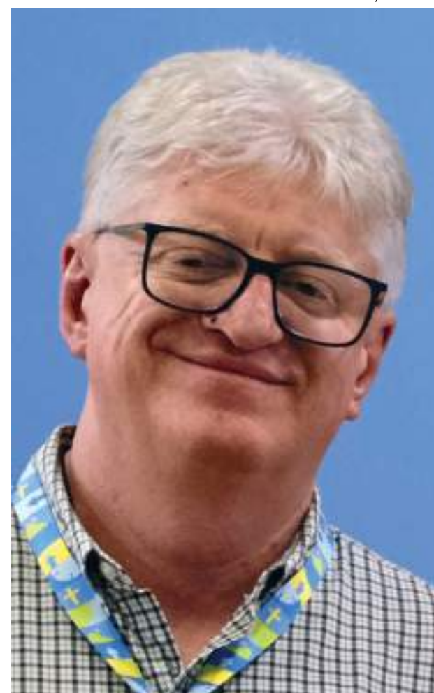
P. Odair: Um grande mutirão levará a mais uma grande Campanha Vai e Vem

Como em edições anteriores, a Campanha Vai e Vem 2025 contará com uma ampla divulgação nos canais de comunicação da IECLB. Para inspirar o engajamento