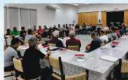
Reunião do Núcleo da Comunidade Blumenau Velha, em março de 2025.