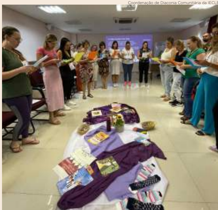
Coordenação de Diaconia Comunitária da IECLB