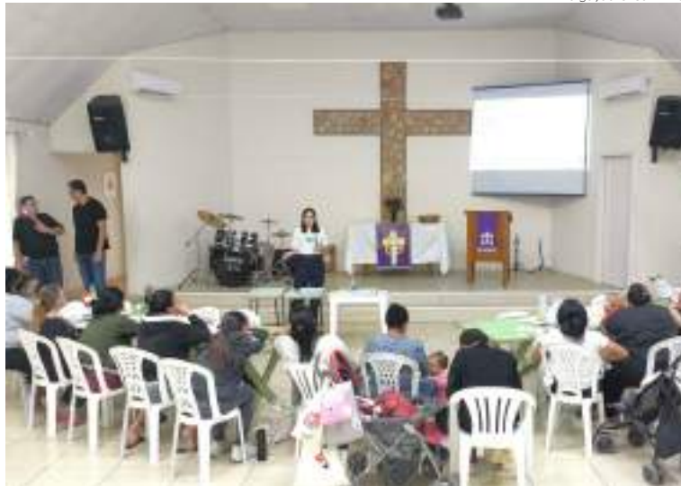
Todas as mulheres receberam o certificado da Missão Aliança