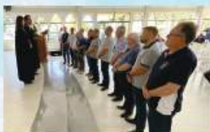
Assembleia e instalação da nova Coordenação Sinodal, em 28/09/2024, em Itapema/SC.