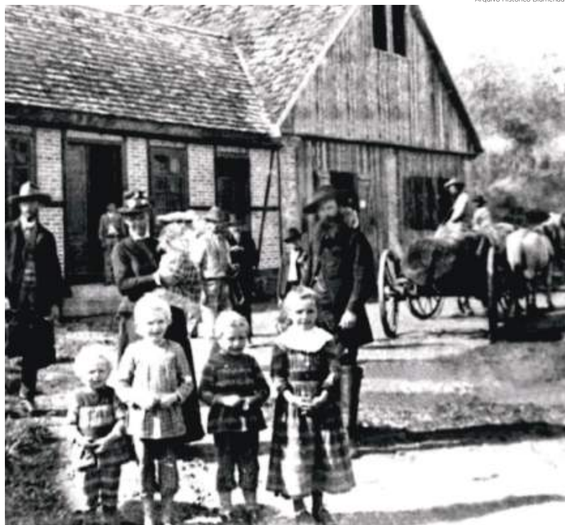
Comunidade do Teste, Colônia Blumenau, atual Pomerode. Colonos pomeranos que ocuparam o Vale do Rio do Teste

Quero destacar aqui a conotação altamente pejorativa que se empregava na forma como estes imigrantes eram tratados. O termo “colono” era empregado como sinônimo de alguém rude, tosco, grosso, que não sabia se comportar em sociedade, que não dominava a etiqueta de “gente civilizada”. Não sabia se vestir, não sabia falar, não sabia se compor-