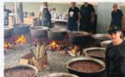
Feijoada beneficente no Núcleo de Pomerode/SC.

AGENDA: O Núcleo de Balneário Camboriú convida para o 70º Jantar à Italiana, que acontecerá no dia 11 de julho, das 19h às 22h, na Comunidade de B. Camboriú.