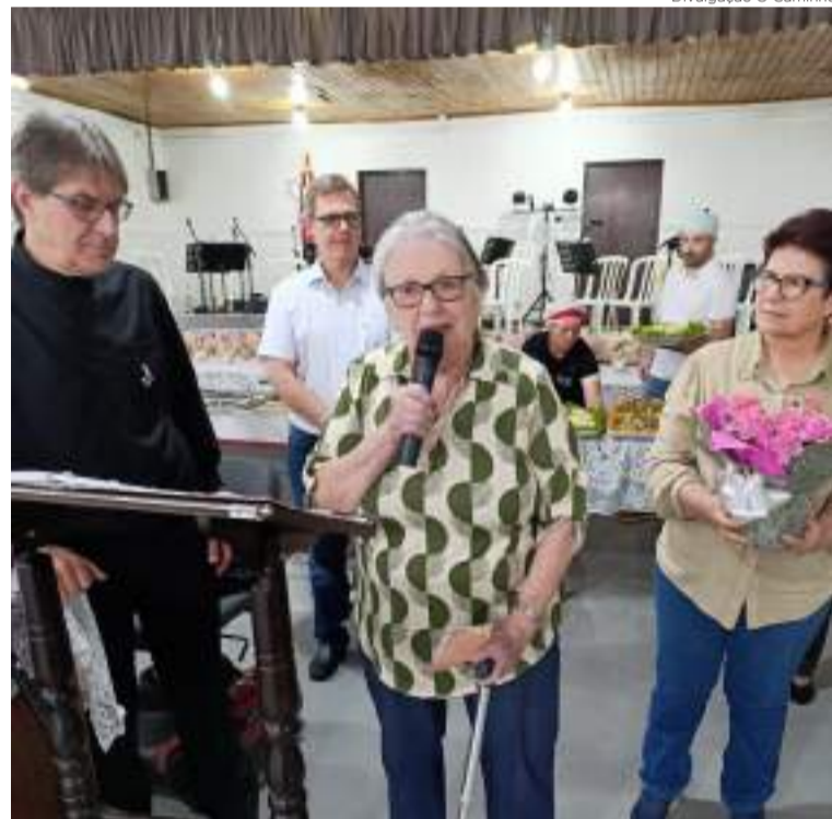
Divulgação O Caminho

O Grupo de Pessoas Idosas Girassol celebrou seu jubileu de 30 anos em Corupá, reunindo mais de 180 participantes em um dia de gratidão