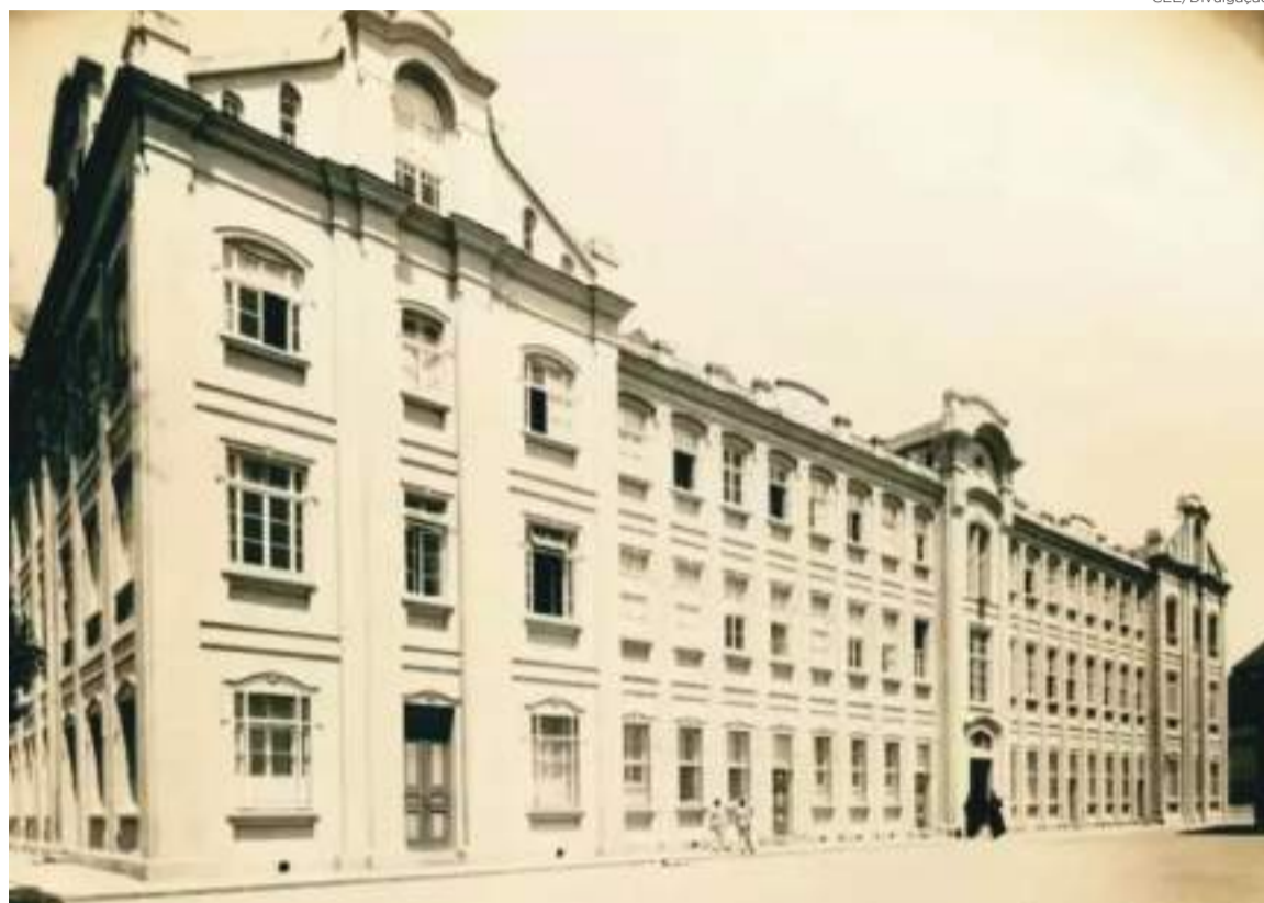
Filhos da elite luterana estudavam no Colégio Catarinense, em Florianópolis, onde tensões religiosas emergiam diante das tentativas de conversão ao catolicismo por parte dos jesuítas. O conceito de ecumenismo permanecia distante

Muitos filhos da elite luterana continuavam seus estudos em Florianópolis, no conceituado Colégio