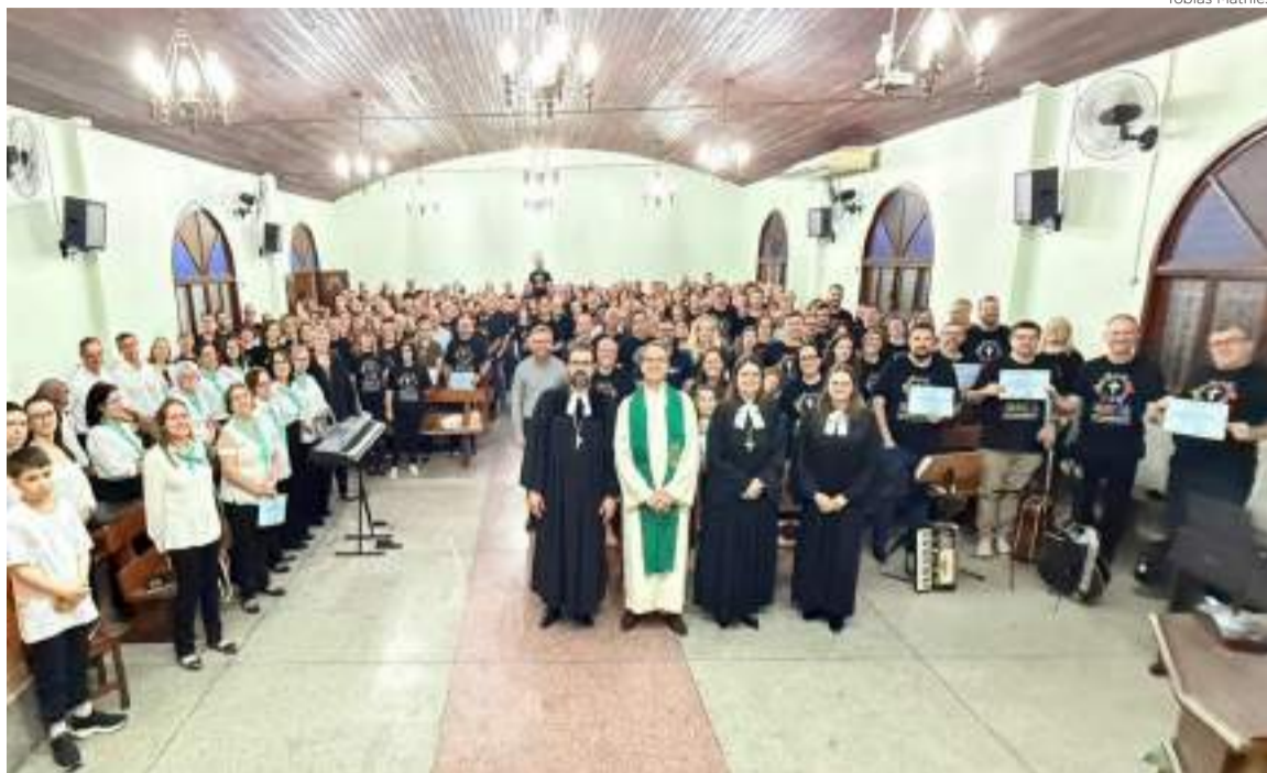
Formação, fé e comunhão: participantes do programa ‘Igreja em Movimento’ celebram juntos o 1º módulo

A metodologia adotada valorizou o protagonismo dos participantes, com uso de estratégias ativas que estimularam reflexão crítica, troca de experiências e aplicação prática dos conteúdos. Entre as dinâmicas, destaca-