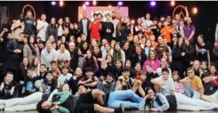
O encontro reavivou a chama da fé e reafirmou o compromisso com o próximo

Nos dias 17 e 19 de outubro, cerca de 90 jovens participaram do “Primeiro Retiro para Confirmandos e Confirmandas e Jumorins do Núcleo Joinville”, Sínodo Norte Catarinense. O encontro foi realizado no Acampamento Moriah, em Mafra/SC, e teve como tema principal “Level Up”. Usando como metáfora o passar de fase dos jogos eletrônicos, as pessoas participantes foram conduzidas a refletir sobre o compromisso pessoal com Jesus Cristo e com a Igreja. Em meio aos desafios do mundo globalizado, às pressões das redes sociais e às lutas emocionais tão presentes na vida dos jovens, o tema convidou a pensar como se fortalecer para dar um passo a mais no compromisso com Jesus e sua Igreja. “O “Level Up” destacou a importância do amadurecimento na fé e na compreensão que não é possível permanecer indiferente à vida comunitária. Ser discípulo e discípula de Jesus significa dar continuidade a Sua obra, vivendo com propósito e compromisso.