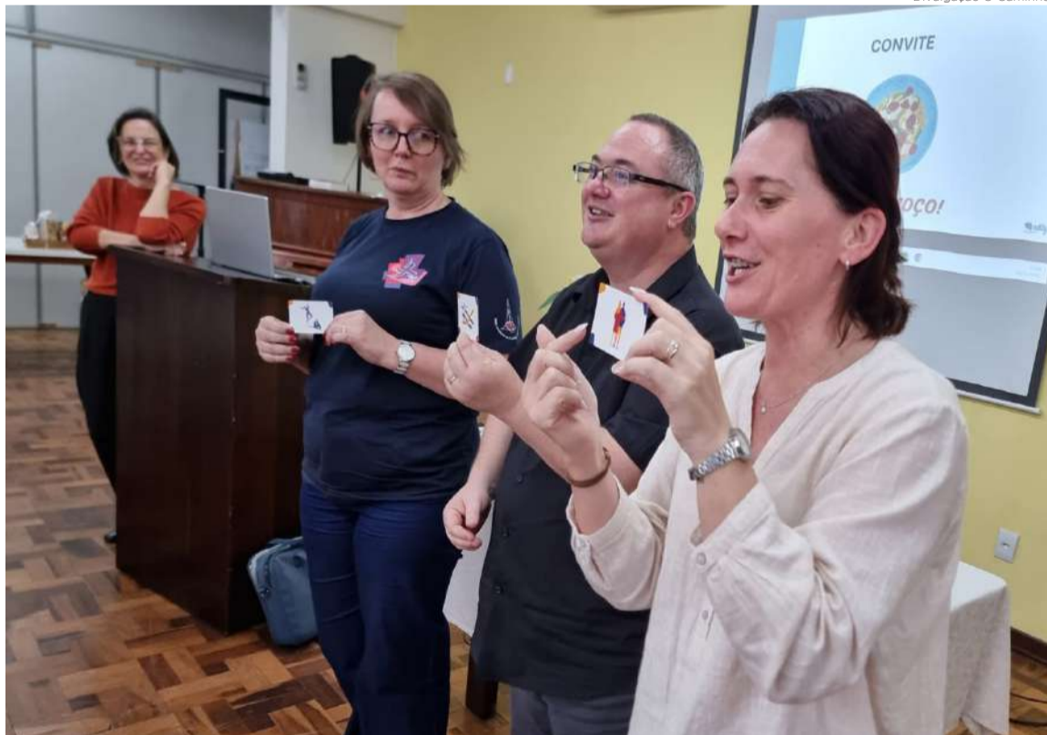
Rede de apoio fortalece a saúde e o bem-estar de ministras e ministros no Sínodo Norte Catarinense

A partir de reflexões e preocupações com a saúde e o bem-estar integral de ministras e ministros, o Sínodo Norte Catarinense passa a disponibilizar uma rede de apoio profissional. Um conjunto de psicólogas,