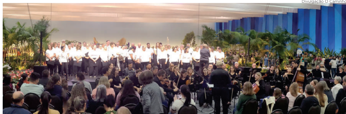
Em meio ao cenário encantador, a Orquestra Luterana de Joinville abrilhantou a Festa das Flores

Aconteceu na noite do dia 18 de novembro, em meio a milhares de flores, folhagens e águas dançantes, a apresentação da Orquestra Luterana de Joinville. Junto, encantou o Coro Luterano, formado por membros das diversas comunidades luteranas da cidade. O evento integrou a 85ª Festa das Flores de Joinville, tradicional celebração aguardada e festejada a cada ano.