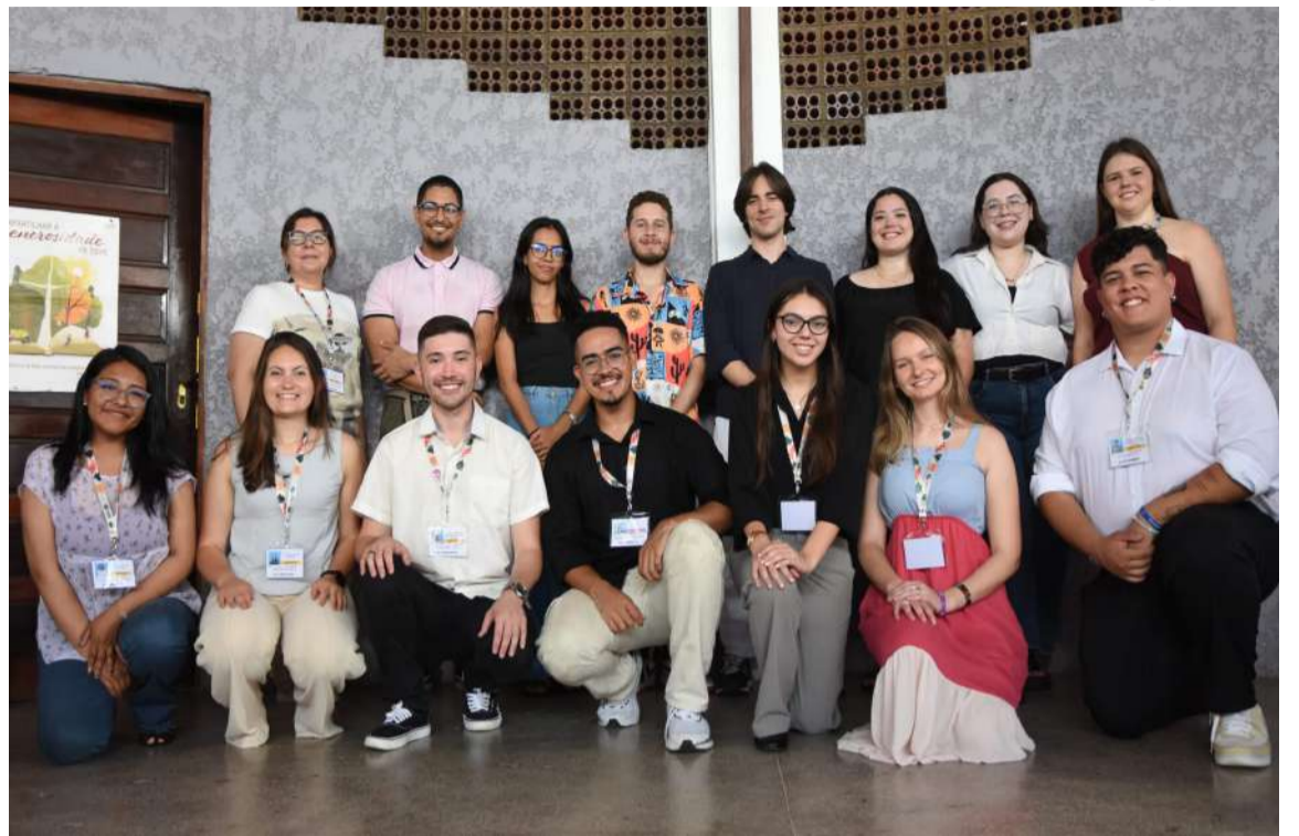
Jovens de diversas partes do Brasil vivenciaram a dinâmica de um evento ambiental e reafirmaram seu protagonismo