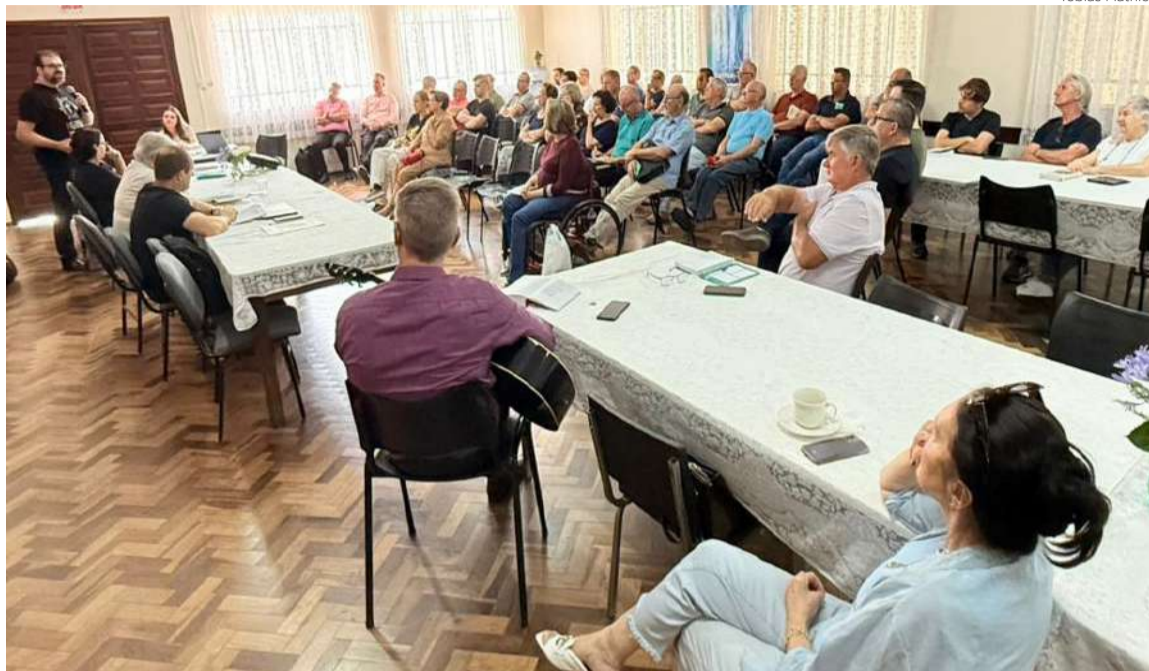
O Conselho Sinodal é composto por representantes das paróquias, ministros e ministras e setores de trabalho

Um dos pontos centrais foi a preocupação com o número reduzido de estudantes de Teologia na