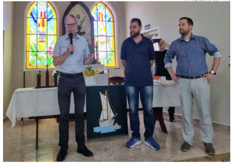
Em um dos vitrais da igreja está a figura de um cordeiro, que identifica a Igreja Moraviana em todo o mundo

A Igreja da Morávia, também conhecida como Unitas Fratrum, Irmãos Boêmios ou Irmandade de Herrnhut, remonta a 1457. Trata-se de uma Igreja Pro-