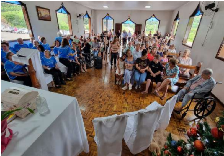
A celebração reuniu pessoas de diferentes confissões para comemorar o ano novo