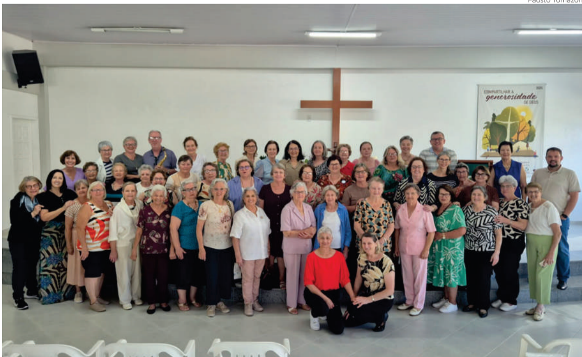
As atividades com pessoas idosas são exercidas com muito carinho por voluntários de diversas comunidades

O Sínodo concluiu em dezembro de 2025 as atividades dos diversos setores de trabalho que compõem a caminhada sinodal.