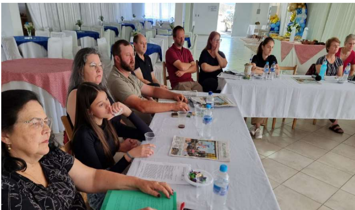
Os encontros, além de discutirem os anseios e as ideias das lideranças, também promovem convivência